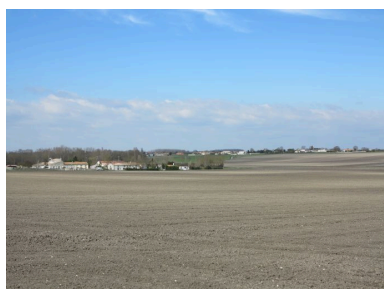
Bussas et Brézillas vus depuis le sud-ouest.