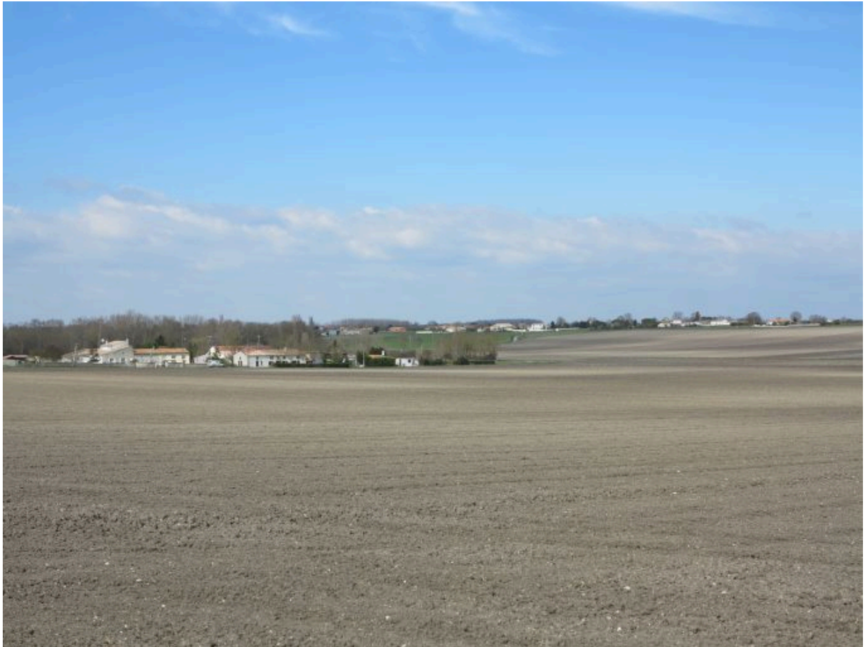
Bussas et Brézillas vus depuis le sud-ouest.