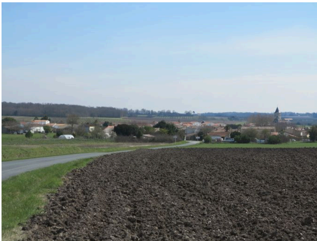
Le bourg vu depuis le nord-ouest.