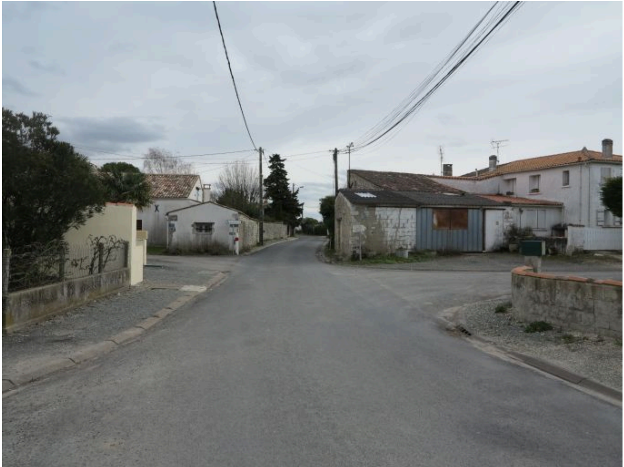
Le hameau de Brézillas.