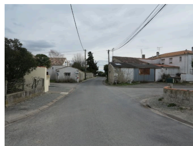
Le hameau de Brézillas.