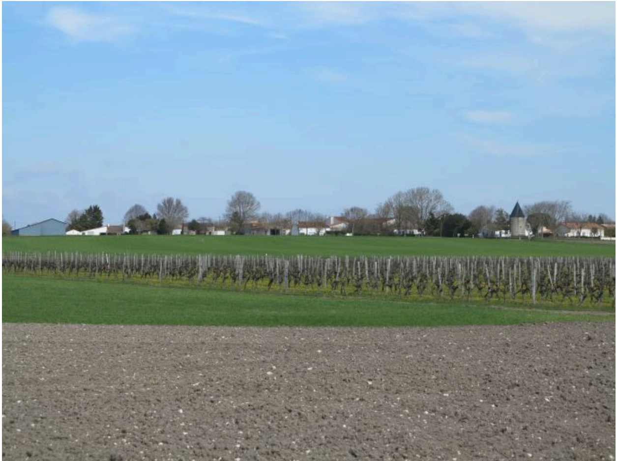
La hameau de Liboulas au sommet de la ligne de collines.