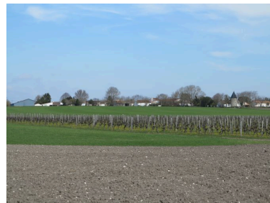
La hameau de Liboulas au sommets de la ligne de collines.