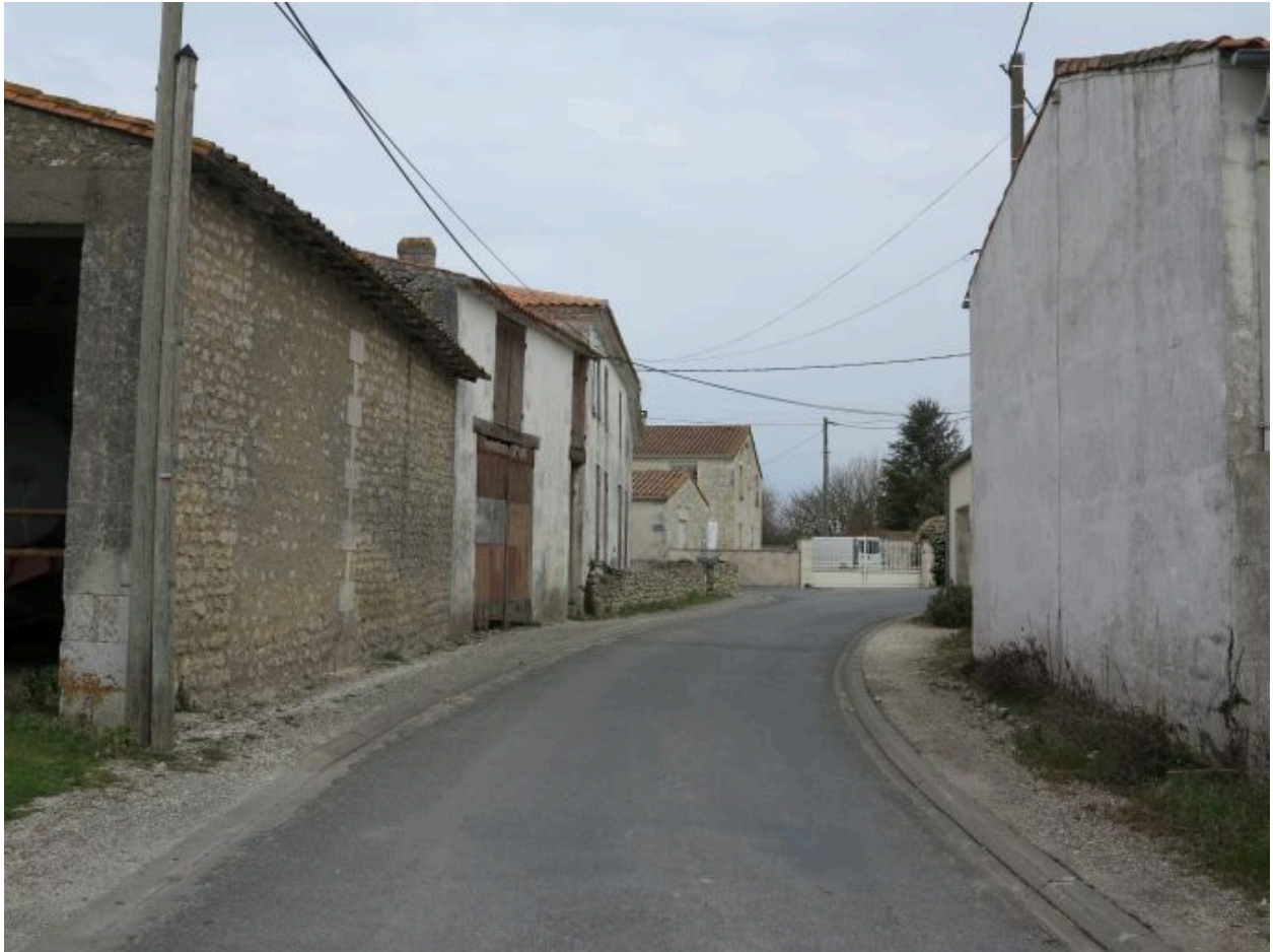
Le hameau de Liboulas.