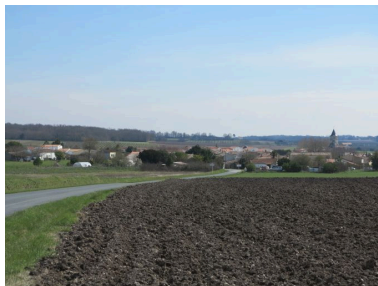
Le bourg vu depuis le nord-ouest.