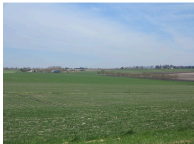
Fermes isolées au milieu de la champagne au nord de la commune.