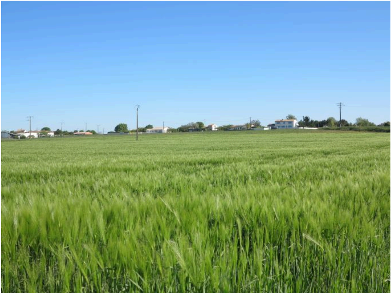
Le hameau de Brézillas au sommet de la colline.