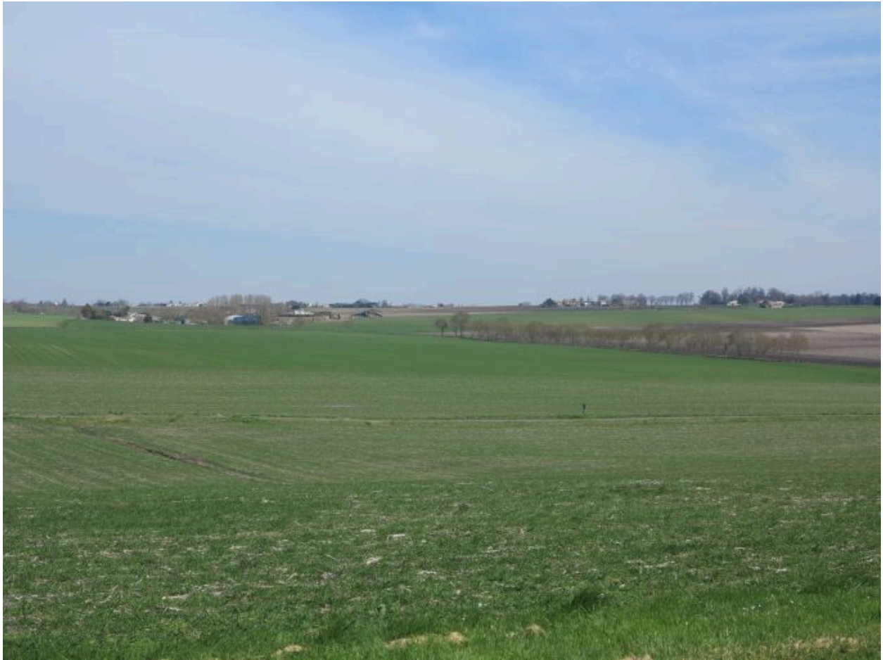
Fermes isolées au milieu de la campagne au nord de la commune.