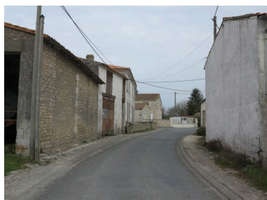
Le hameau de Liboulas.