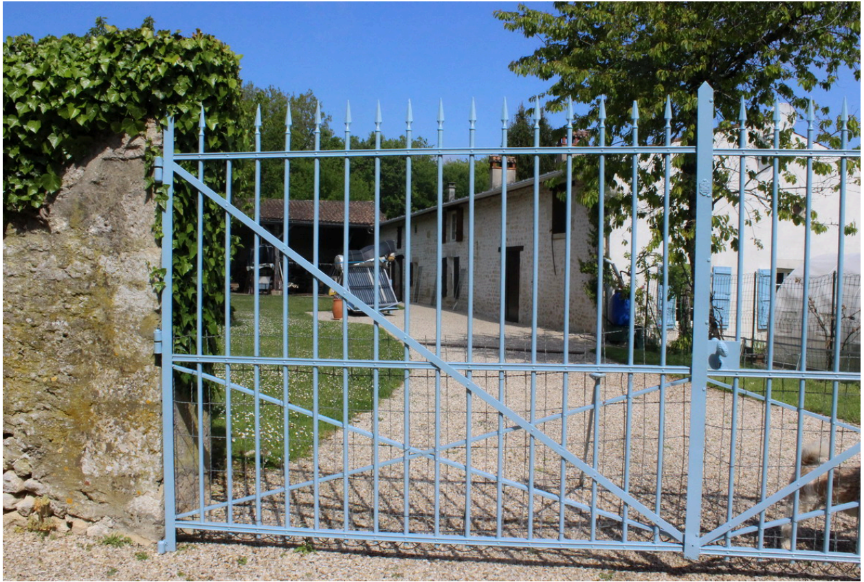
Le corps principal.