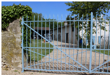
Le corps principal.