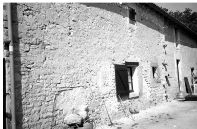
Une partie du corps principal, 2000.