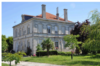
Façades postérieure et latérale nord-ouest.