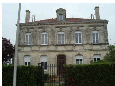
Façade principale. IVR72_20123302889NUCA