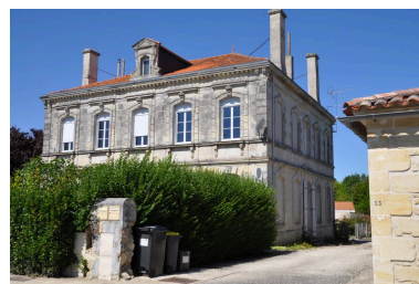
Vue d'ensemble. IVR72_20123302621NUCA