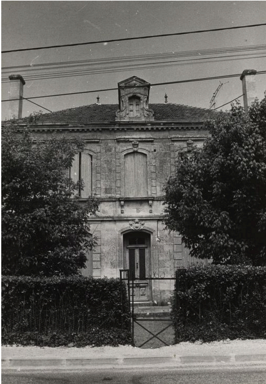
Façade principale (état en 1974).