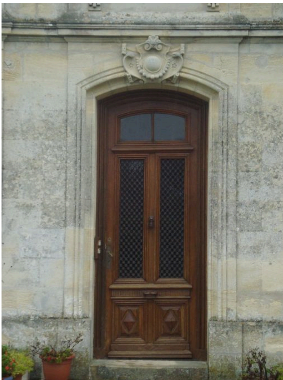
Façade principale : détail de la porte.