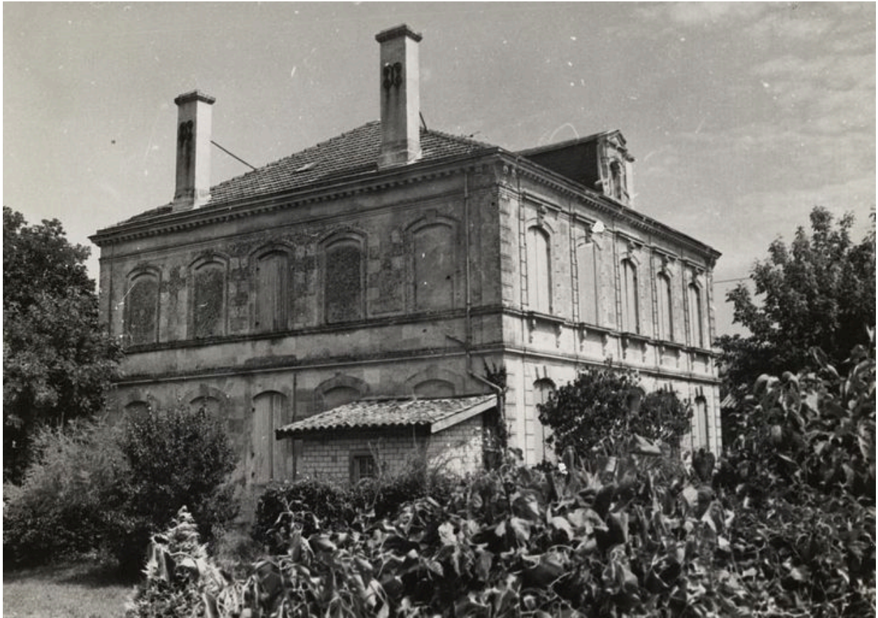
Vue d'ensemble (état en 1974).