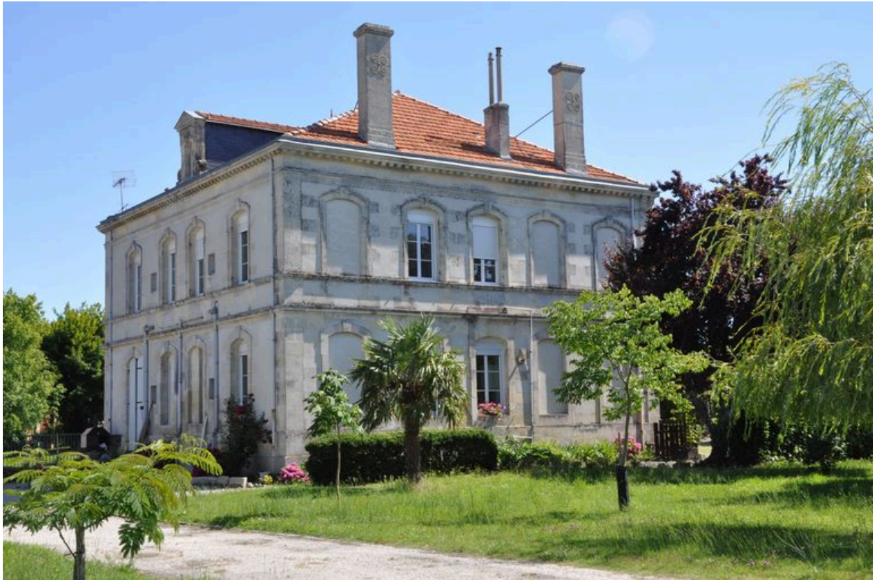
Façades postérieure et latérale nord-ouest.