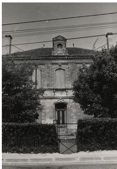
Façade principale (état en 1974).