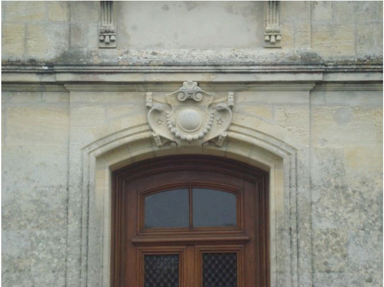
Façade principale, porte : détail de l'agrafe.