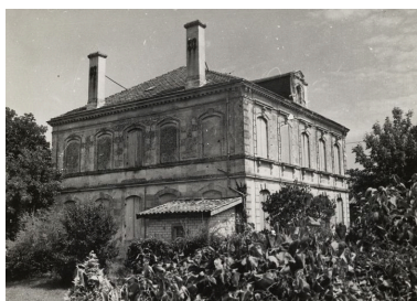
Vue d'ensemble (état en 1974).