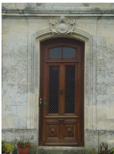
Façade principale : détail de la porte.