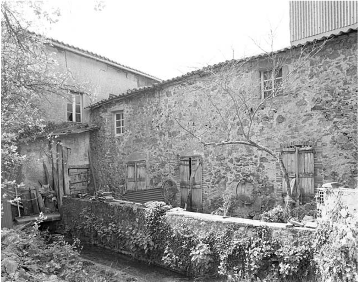
La minoterie et l'ancien logement patronal vus de l'est.