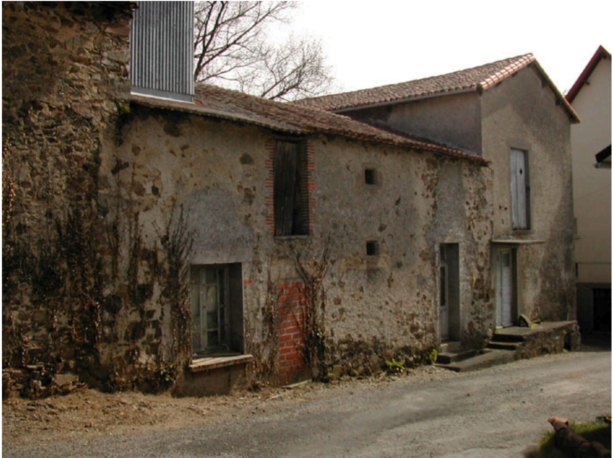
La minoterie et l'ancien logement patronal vus du nord-ouest.