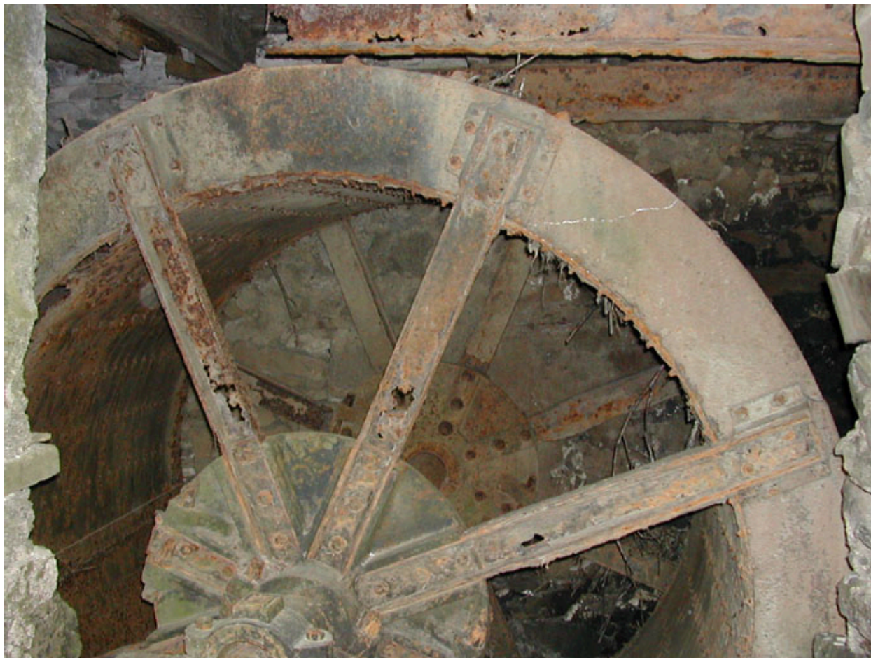
Vue de la roue métallique de dessus.