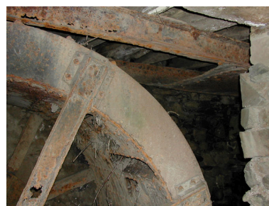
Vue de la roue métallique de dessus : arrivée de l'eau.