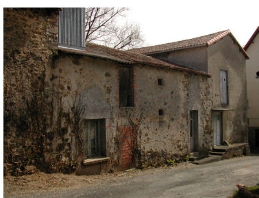
La minoterie et l'ancien logement patronal vus du nord-ouest. IVR54_20037900479NUCA