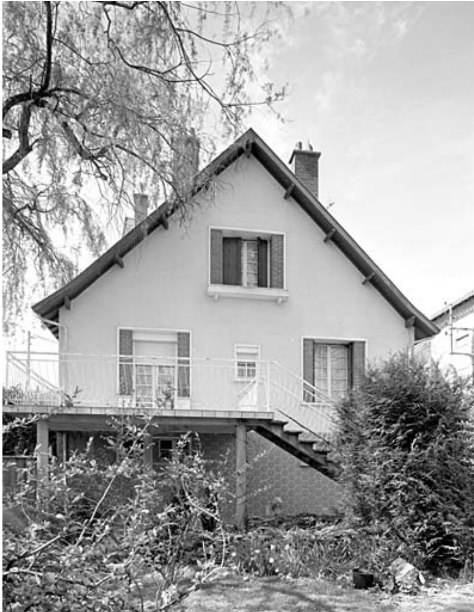
Logement patronal de 1950 vu de l'est.