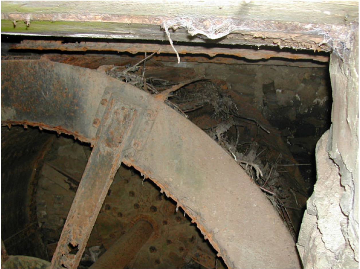
Vue de la roue métallique de dessus : les augets.