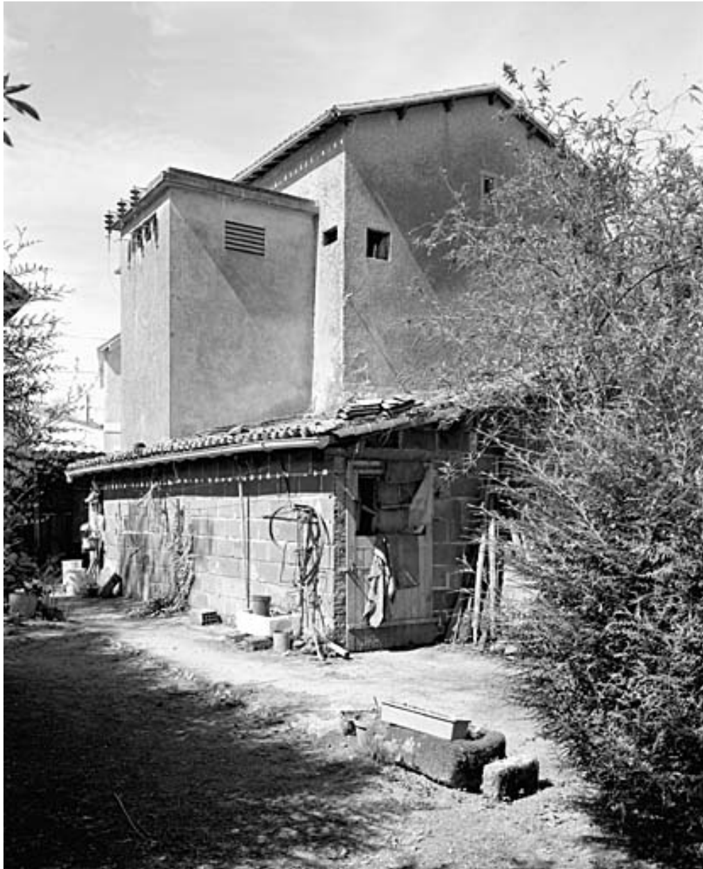
La minoterie vue du sud.