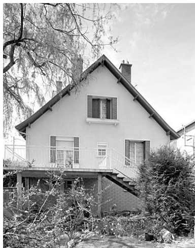
Logement patronal de 1950 vu de l'est.