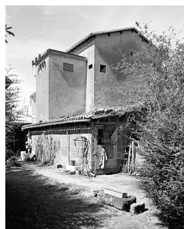
La minoterie vue du sud. IVR54_20037900447V