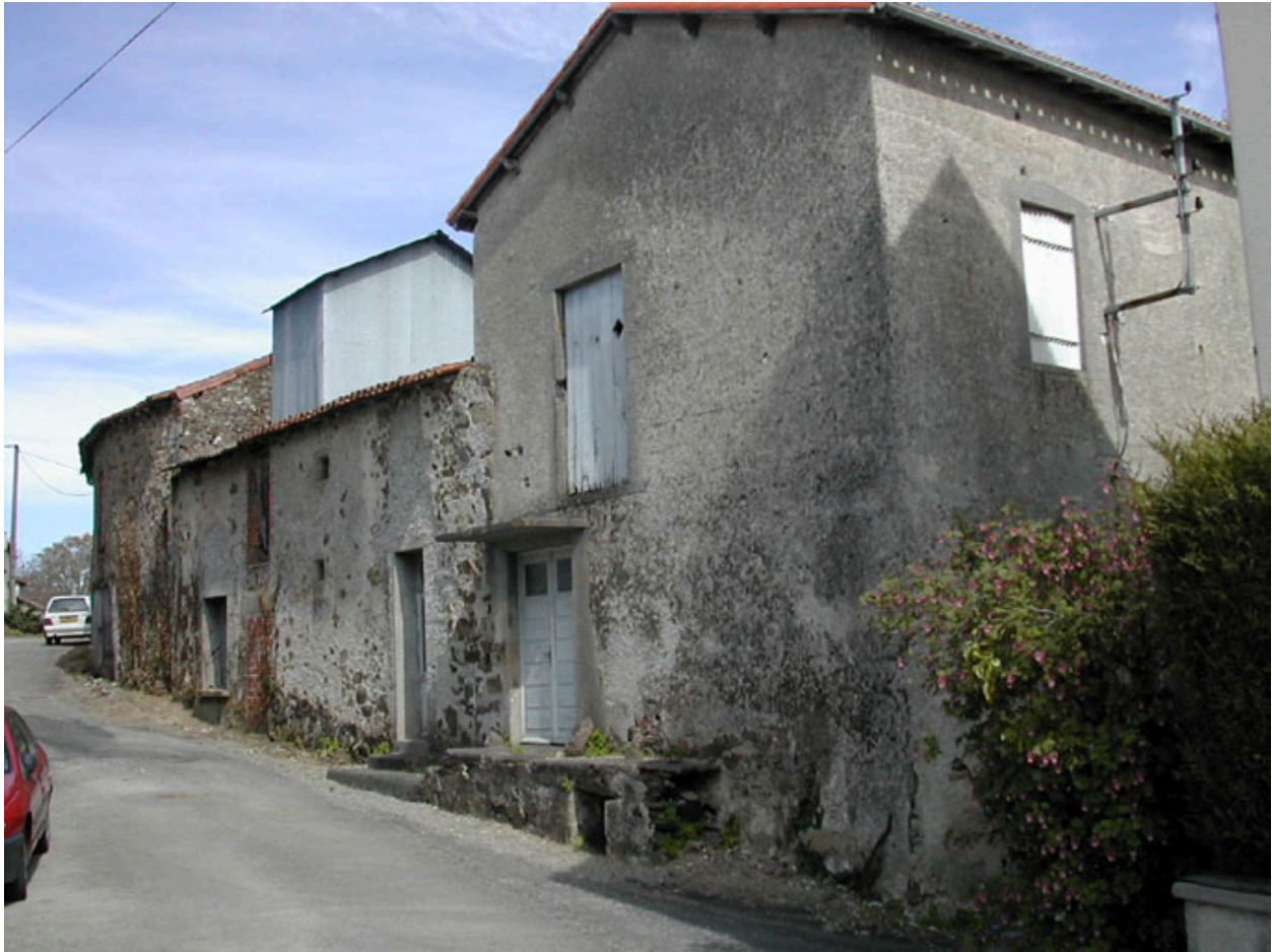
La minoterie et l'ancien logement patronal vus de l'ouest.