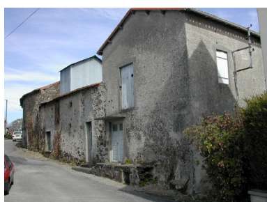
La minoterie et l'ancien logement patronal vus de l'ouest.