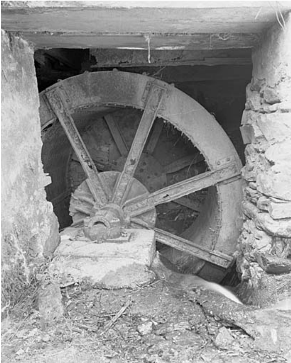
La roue métallique de dessus.