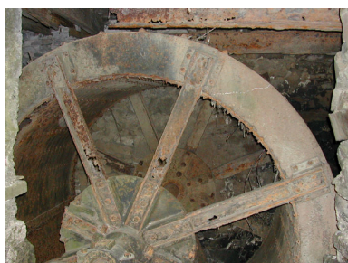
Vue de la roue métallique de dessus. IVR54_20037900476NUCA