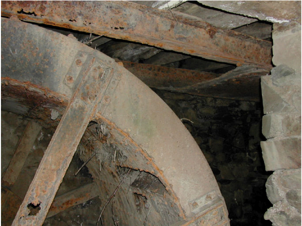
Vue de la roue métallique de dessus : arrivée de l'eau.