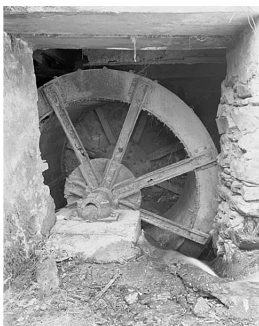
La roue métallique de dessus. IVR54_20037900449V