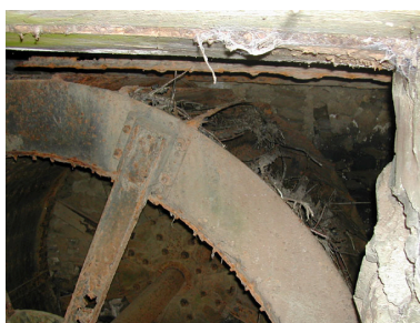
Vue de la roue métallique de dessus : les augets. IVR54_20037900477NUCA