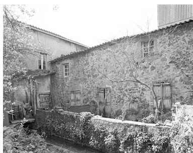
La minoterie et l'ancien logement patronal vus de l'est. IVR54_20037900448V