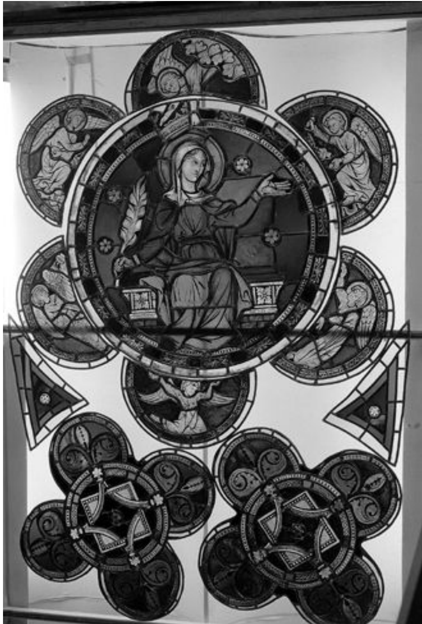
Baie 23 : différents éléments du tympan.