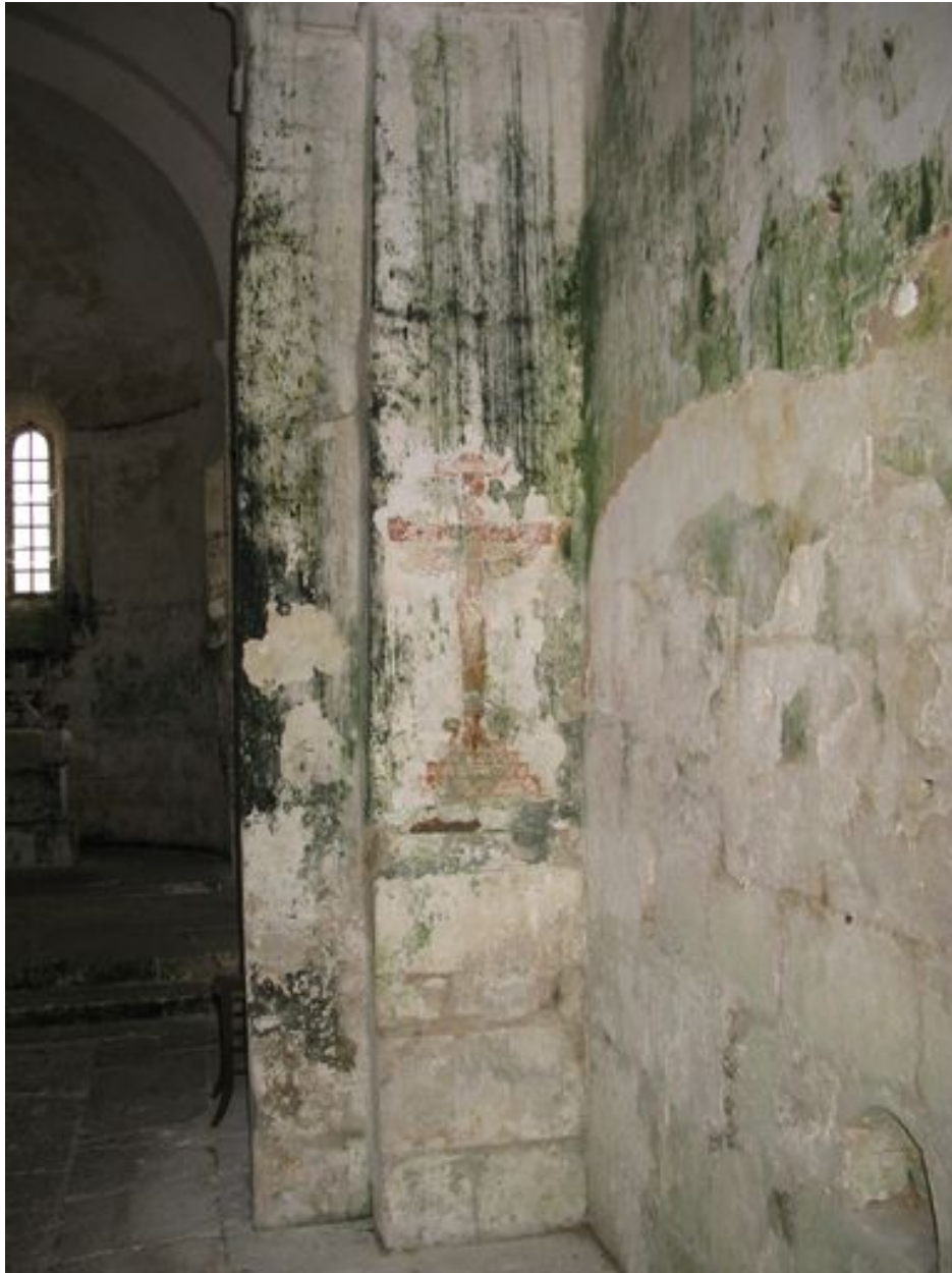
Croix peinte sur la face est du pilier sud-ouest de l'ancienne travée sous clocher.