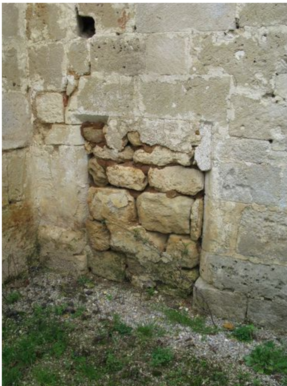
Ancienne travée sous clocher, mur sud, porte murée.