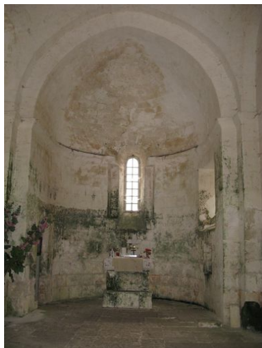
Abside.