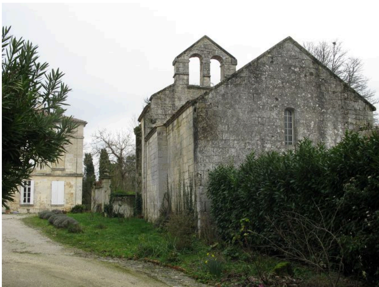
Vue générale depuis le nord-ouest.