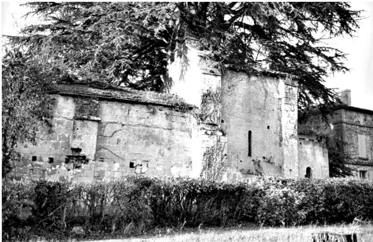
Mur sud. Cliché de 1981.