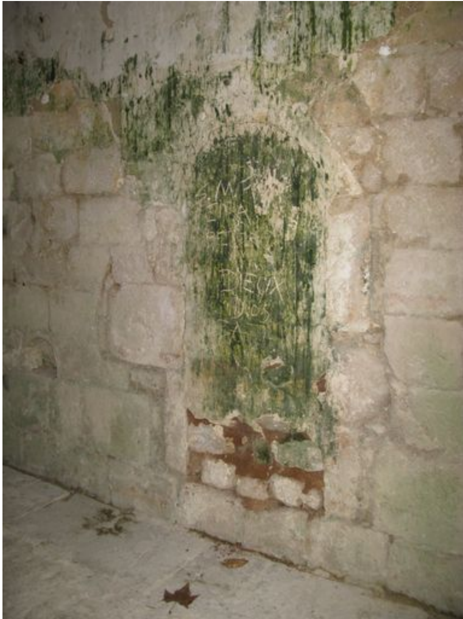
Mur sud de la nef, porte murée.