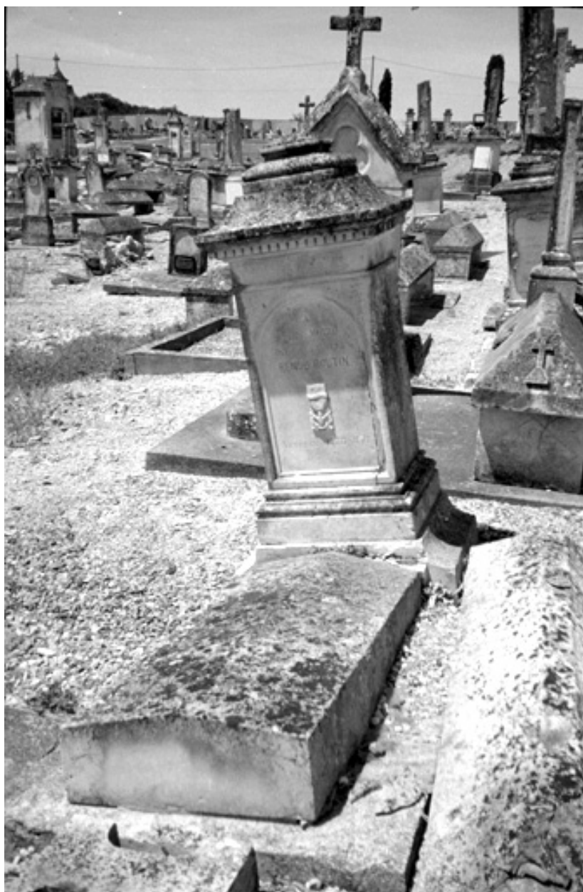
Vue générale du tombeau de la famille Renou-Boutin.