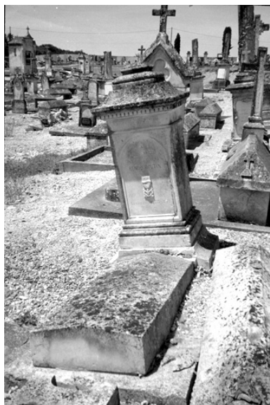
Vue générale du tombeau de la famille Renou-Boutin.