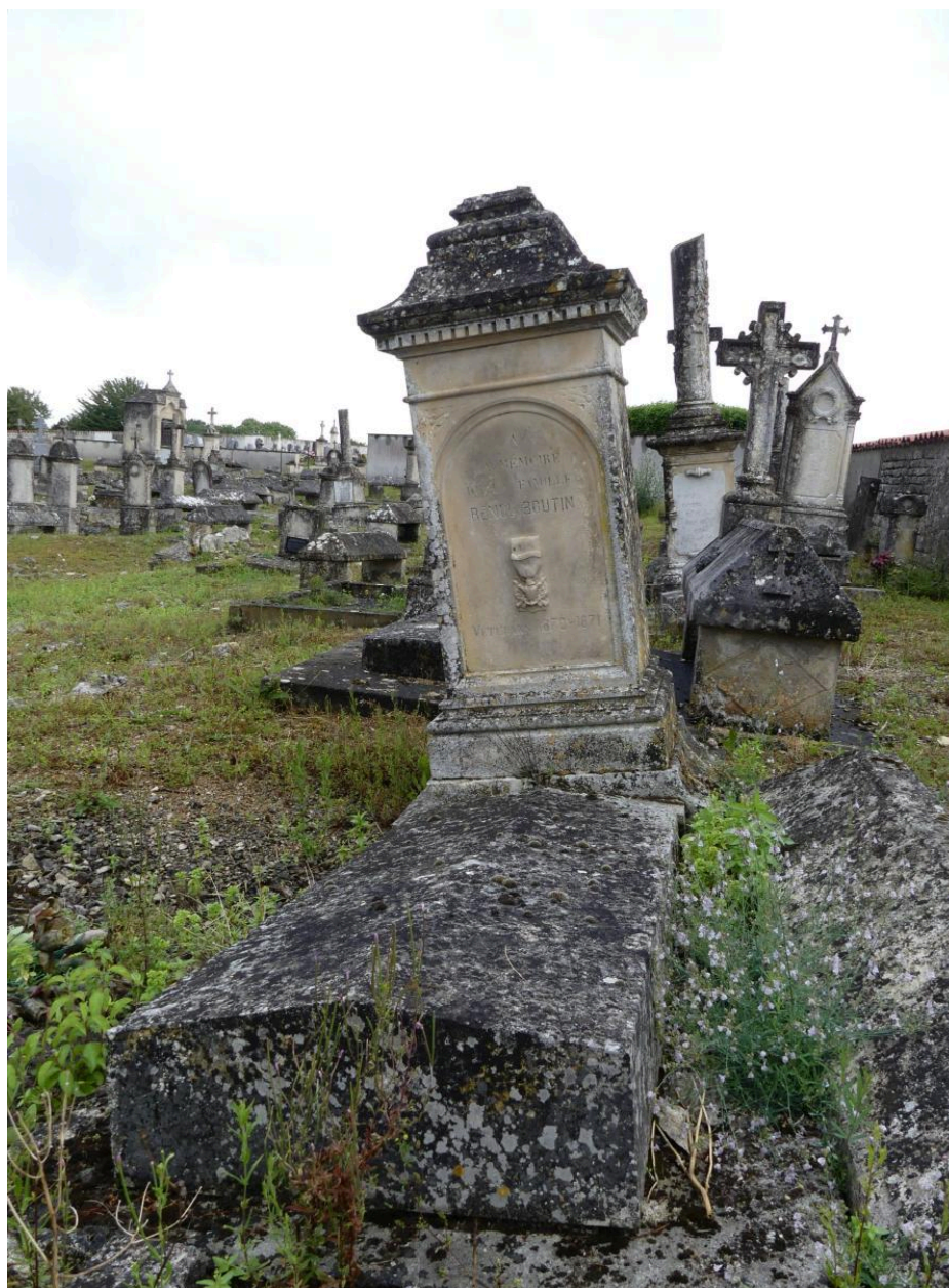
Vue générale du tombeau de la famille Renou-Boutin.