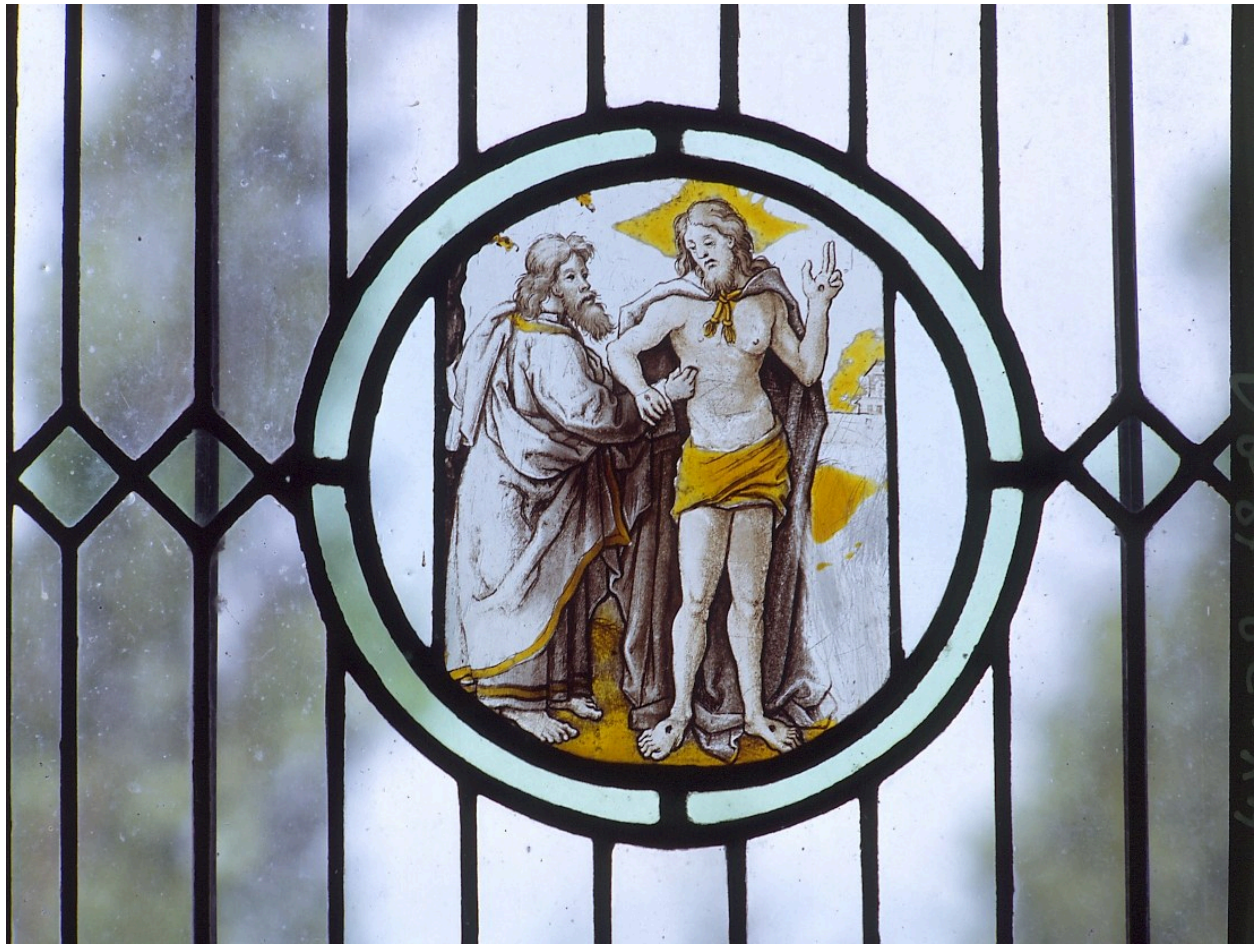
Vantail supérieur droit : l'incrédulité de saint Thomas.