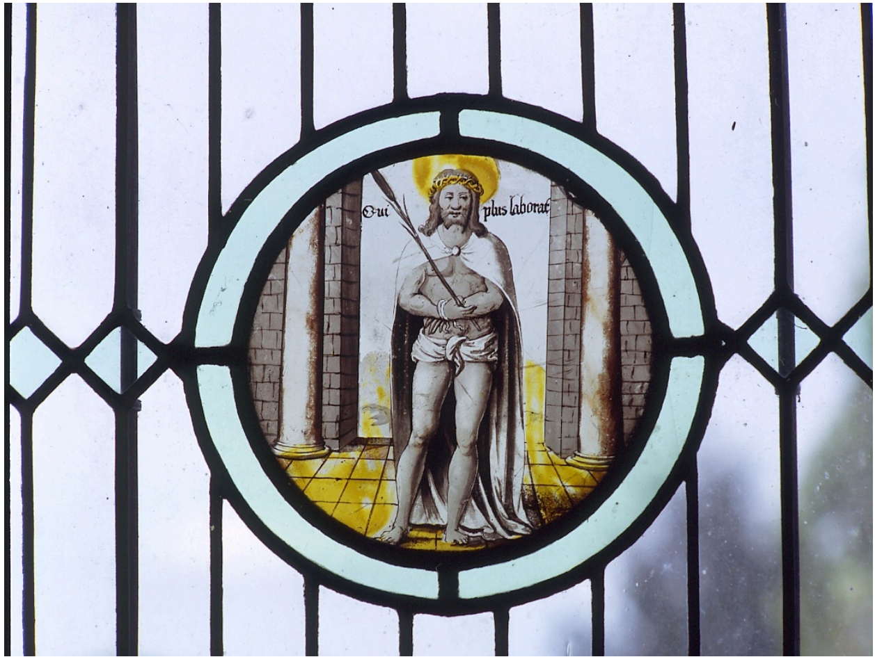
Vantail supérieur gauche : Ecce homo.