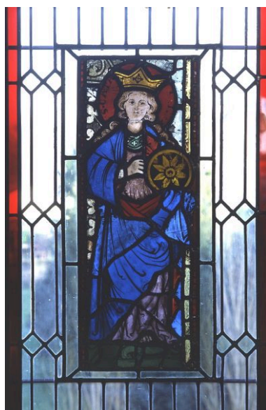
Vantail inférieur droit : sainte Catherine d'Alexandrie.