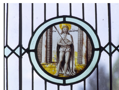
Vantail supérieur gauche : Ecce homo.