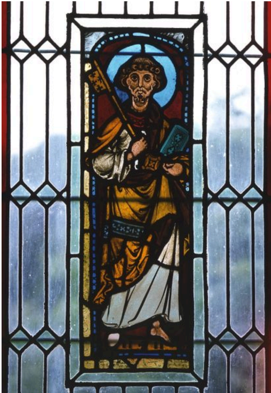
Vantail inférieur gauche: saint Pierre.