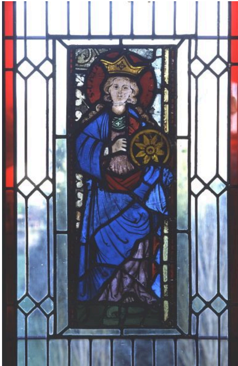
Vantail inférieur droit : sainte Catherine d'Alexandrie.