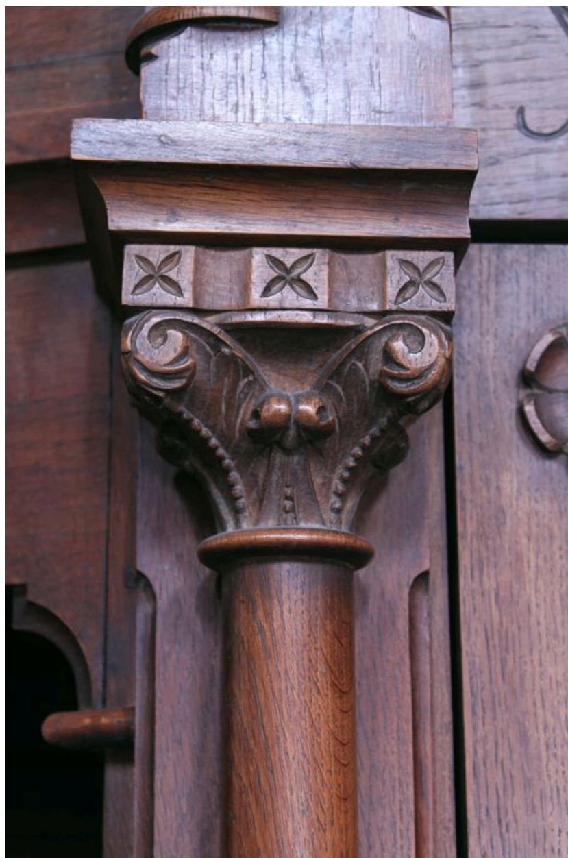
Détail d'un confessionnal : chapiteau de colonnette.