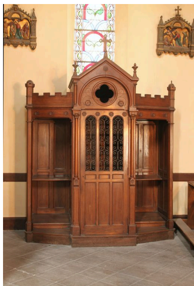
Un confessionnal. IVR72_20124000506NUC2A