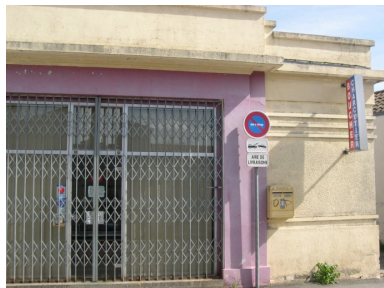
Façade.