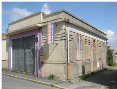
Vue latérale. IVR54_20061700715NUCA