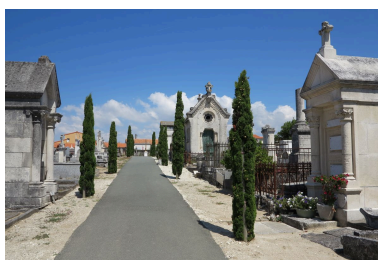
Une des principales allées du cimetière, à l'ouest, dans l'ancienne partie catholique.