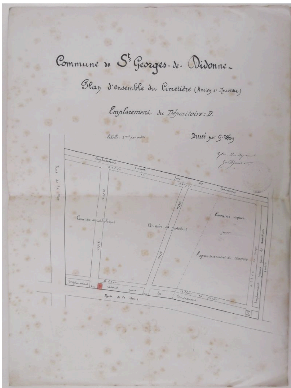
Plan du cimetière vers 1911.