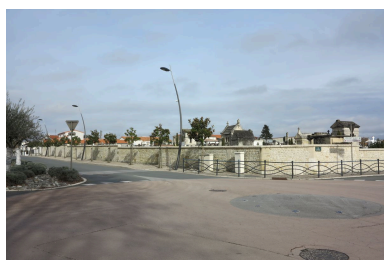
Le cimetière vu depuis le sud-ouest.