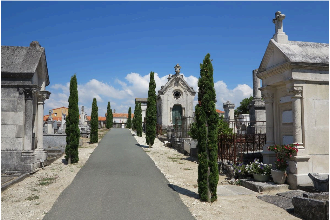
Une des principales allées du cimetière, à l'ouest, dans l'ancienne partie catholique.