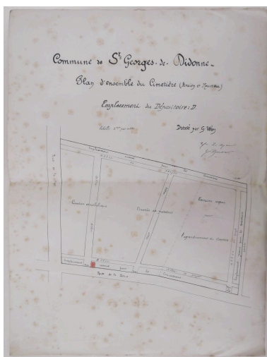
Plan du cimetière vers 1911.