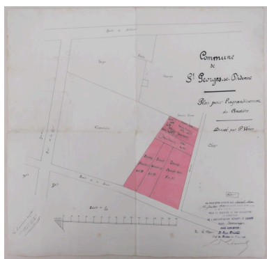
Plan d'agrandissement du cimetière vers 1911. IVR54_20141709388NUCA