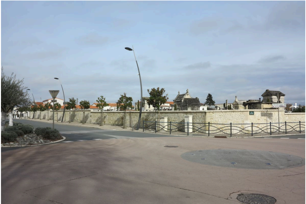
Le cimetière vu depuis le sud-ouest.