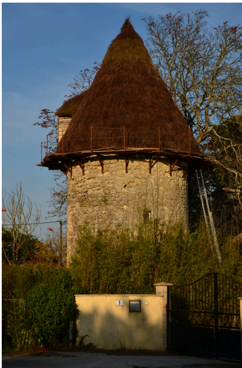
Moulin des Trois-Moulins.