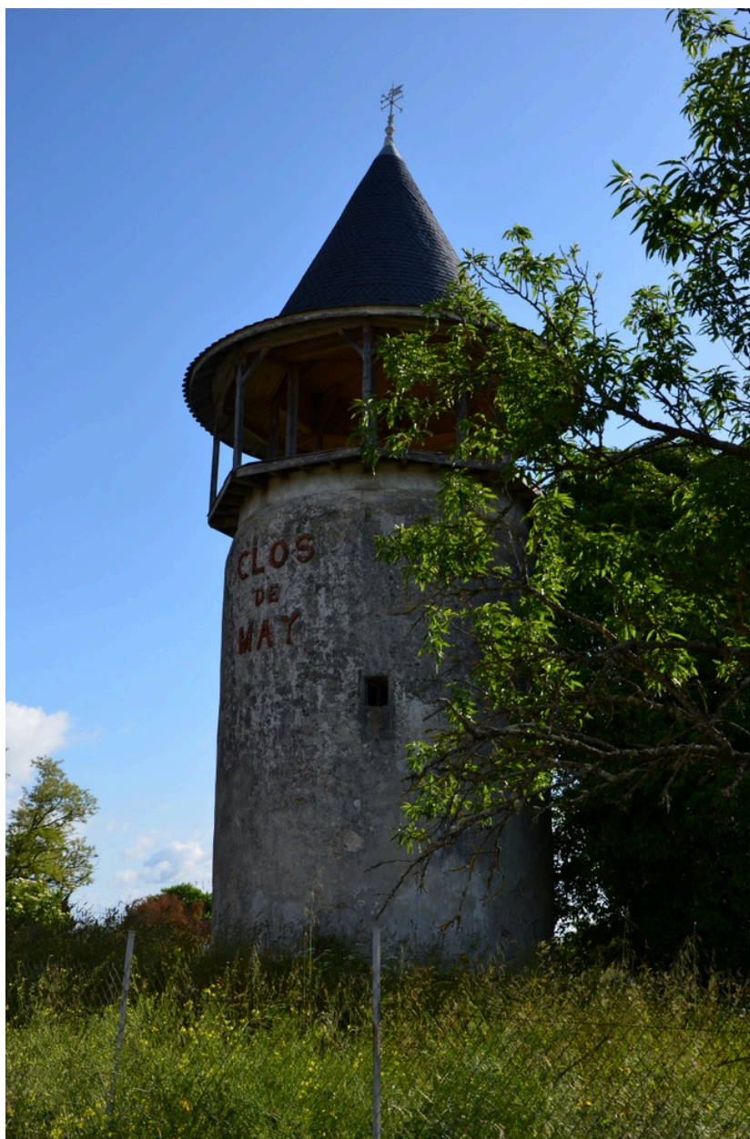
Moulin du Clos de May.