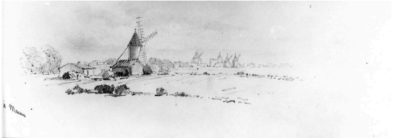
Le moulin de la croix de Bern vers les Trois Moulins, vers 1849.