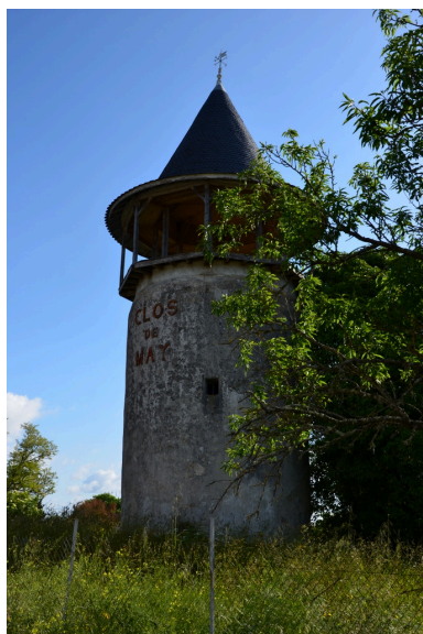
Moulin du Clos de May. IVR72_20143306789NUC2A