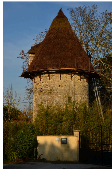
Moulin des Trois-Moulins.