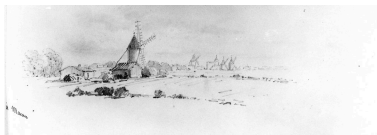
Le moulin de la croix de Bern vers les Trois Moulins, vers 1849. IVR72_19903302643V