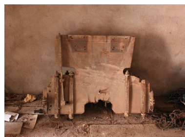
Mouton déposé d'une cloche. IVR72_20124000707NUC2A