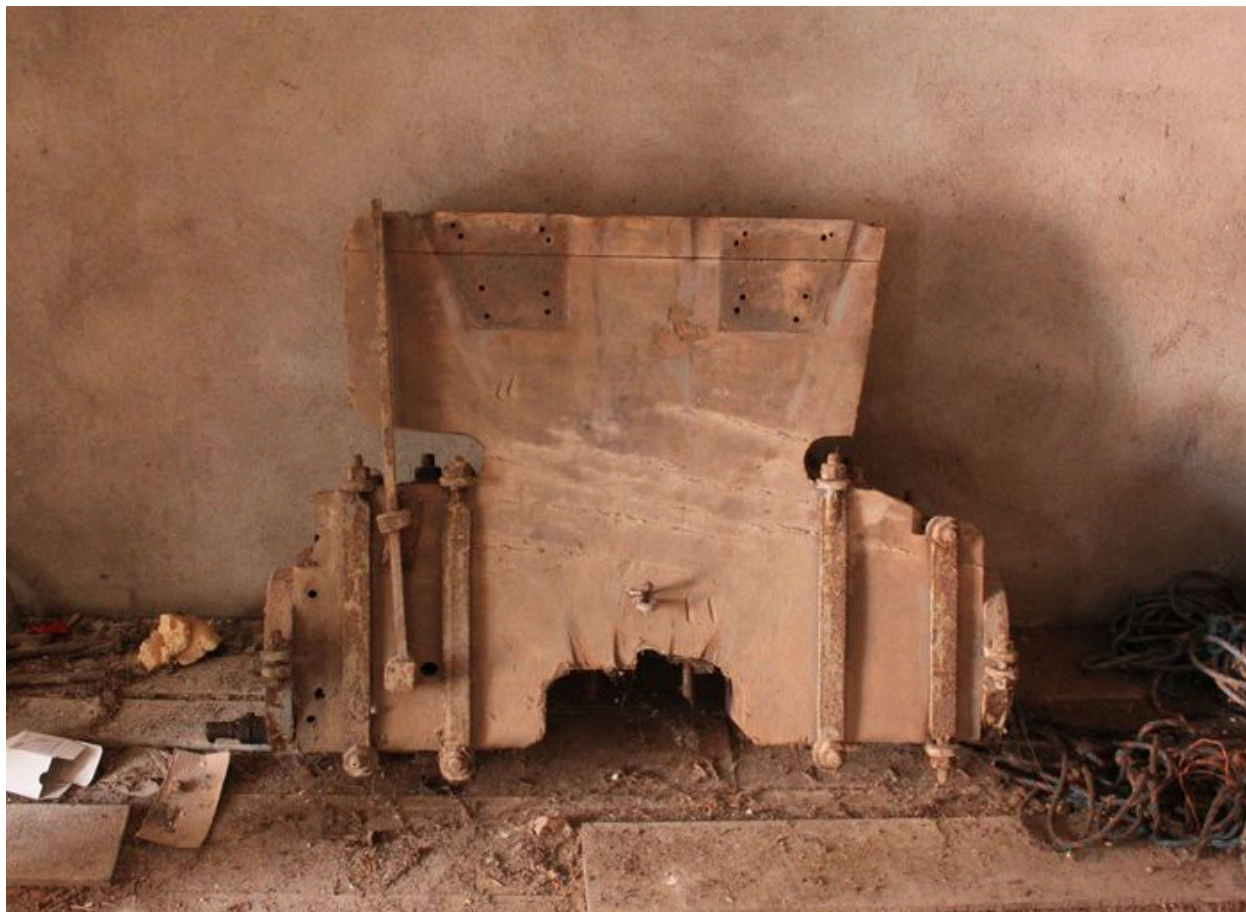
Mouton déposé d'une cloche.