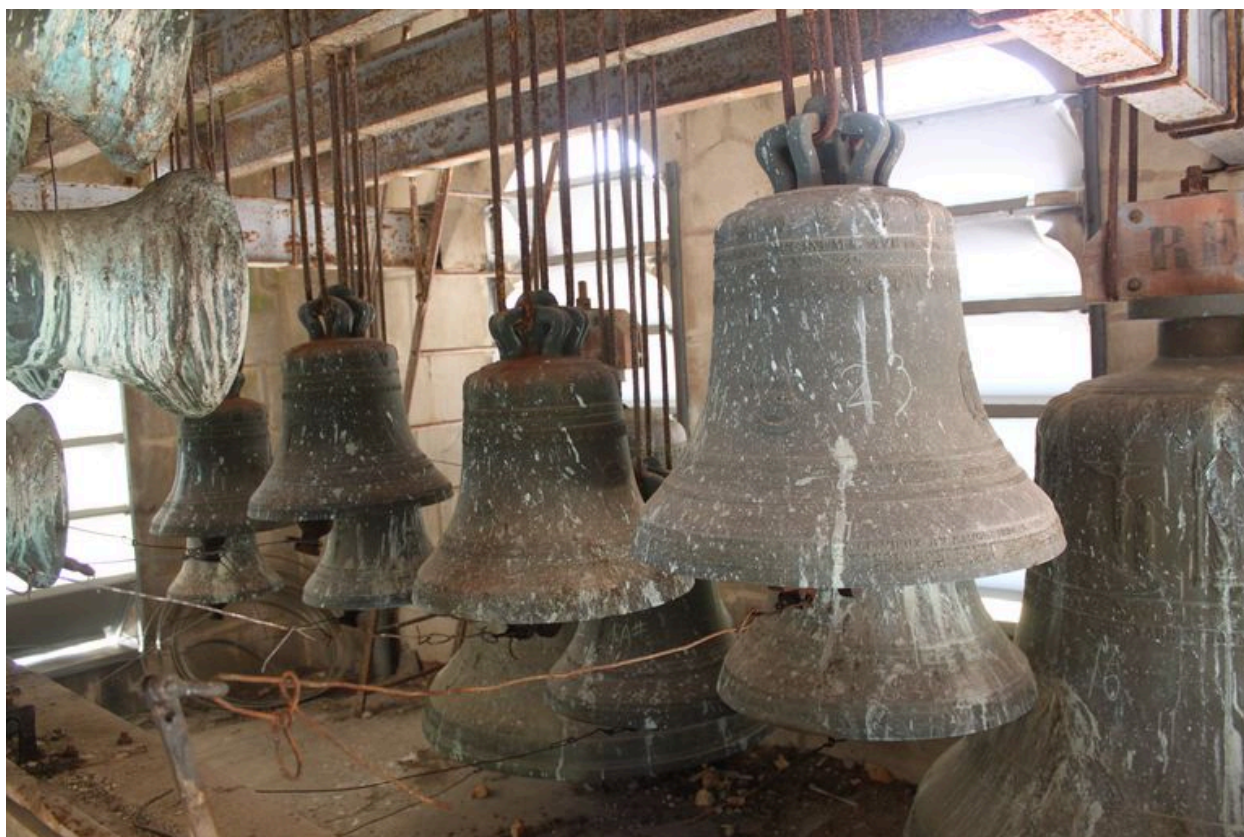
Quelques cloches au troisième niveau du clocher.