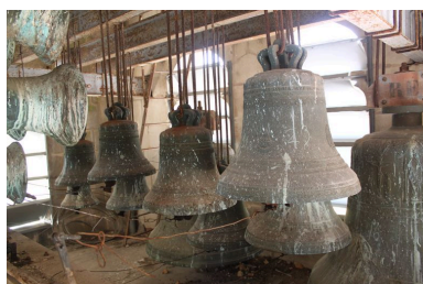
Quelques cloches au troisième niveau du clocher. IVR72_20124000784NUC2A