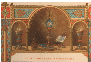
Canon central : détail du décor.