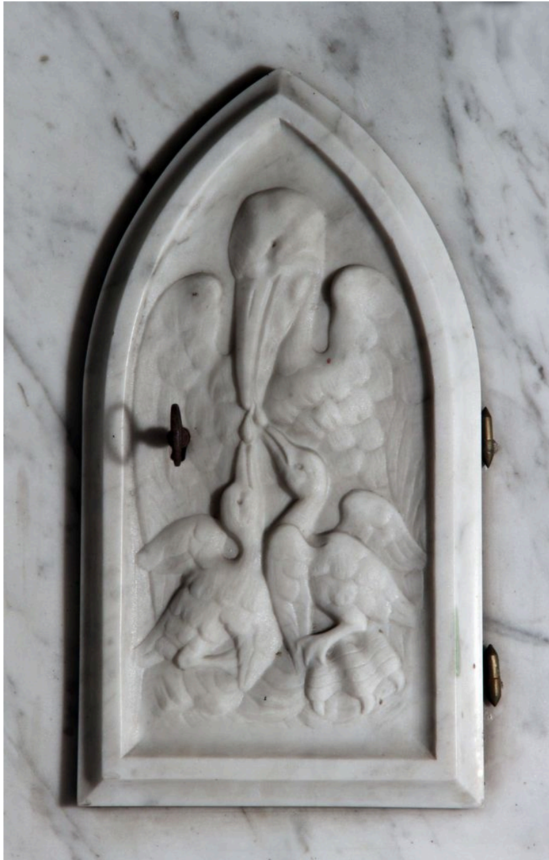
Détail de la porte du tabernacle : Pélican mystique.