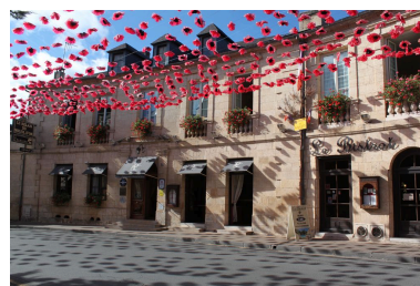
Elévation sur rue (est).