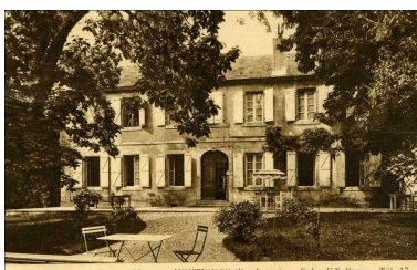
Carte postale, début du 20e siècle : élévation sur jardin (ouest). IVR72_20122401653NUC2A