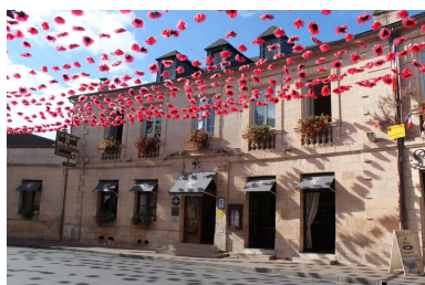
Elévation sur rue (est), demeure de la fin du 18e siècle.