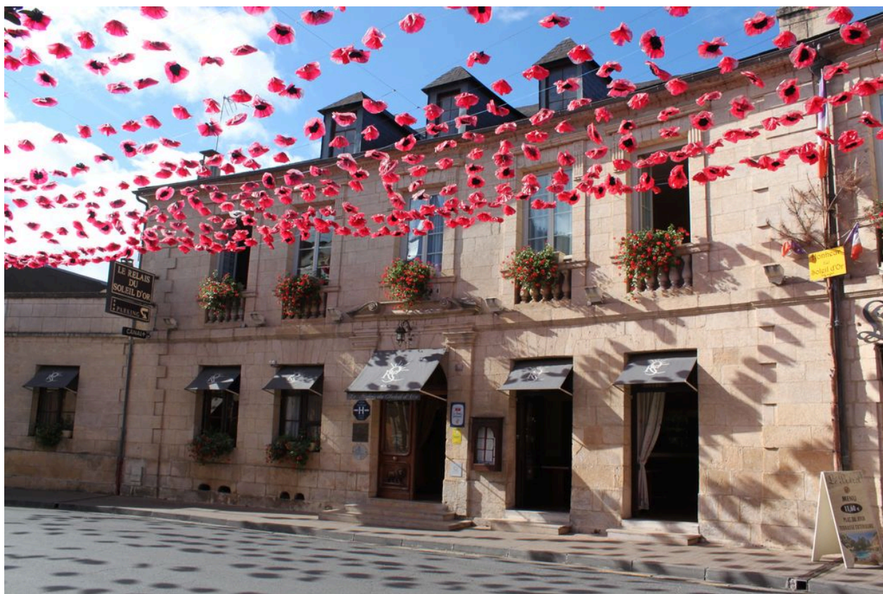
Elévation sur rue (est), demeure de la fin du 18e siècle.