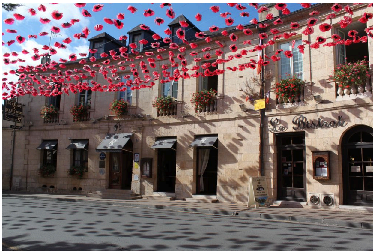
Elévation sur rue (est).