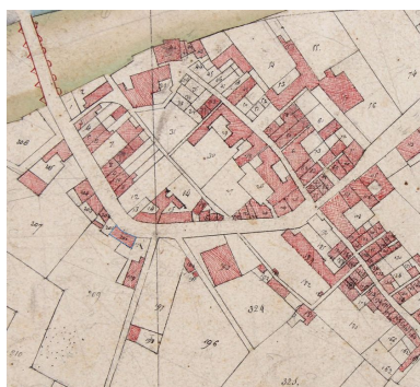
Extrait du plan cadastral de 1813, feuille D1.