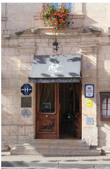
Elévation sur rue (est), porte d'entrée.