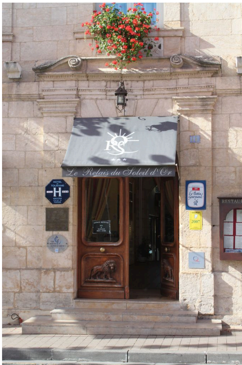
Elévation sur rue (est), porte d'entrée.