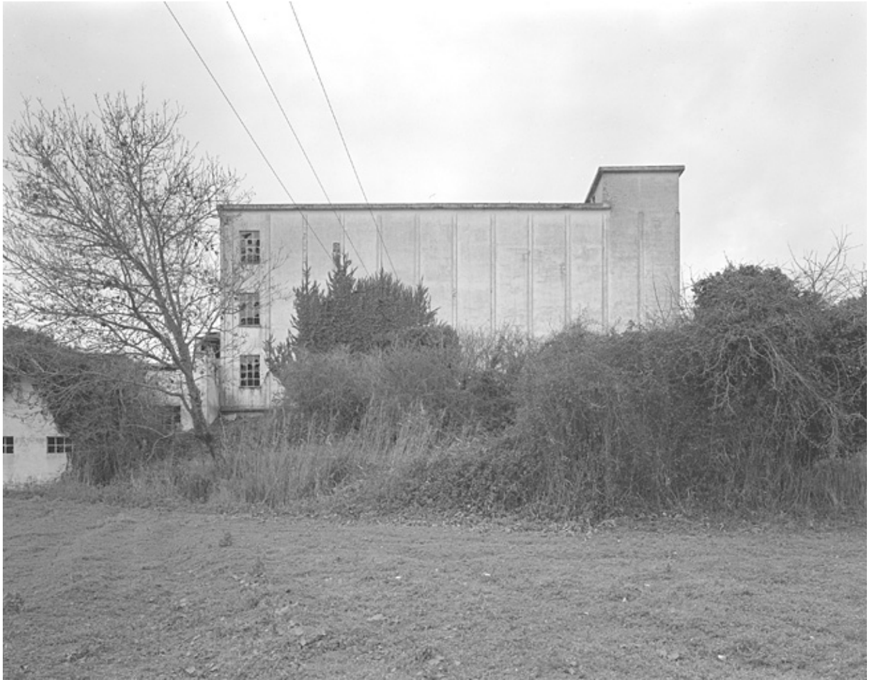
Vue prise de l'est.