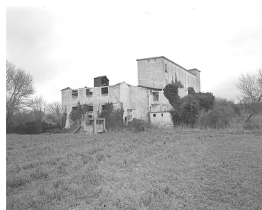
Vue prise du sud.