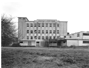
Vue prise de l'ouest. IVR54_19981700018V