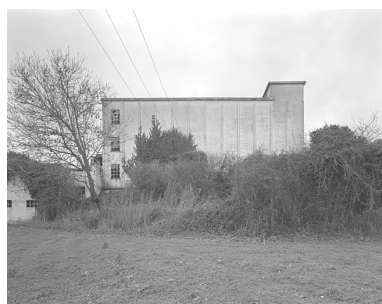
Vue prise de l'est. IVR54_19981700020V