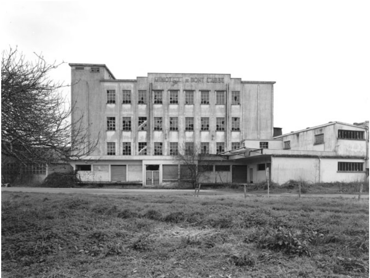
Vue prise de l'ouest.