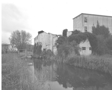
Vue prise du sud est. IVR54_19981700021V