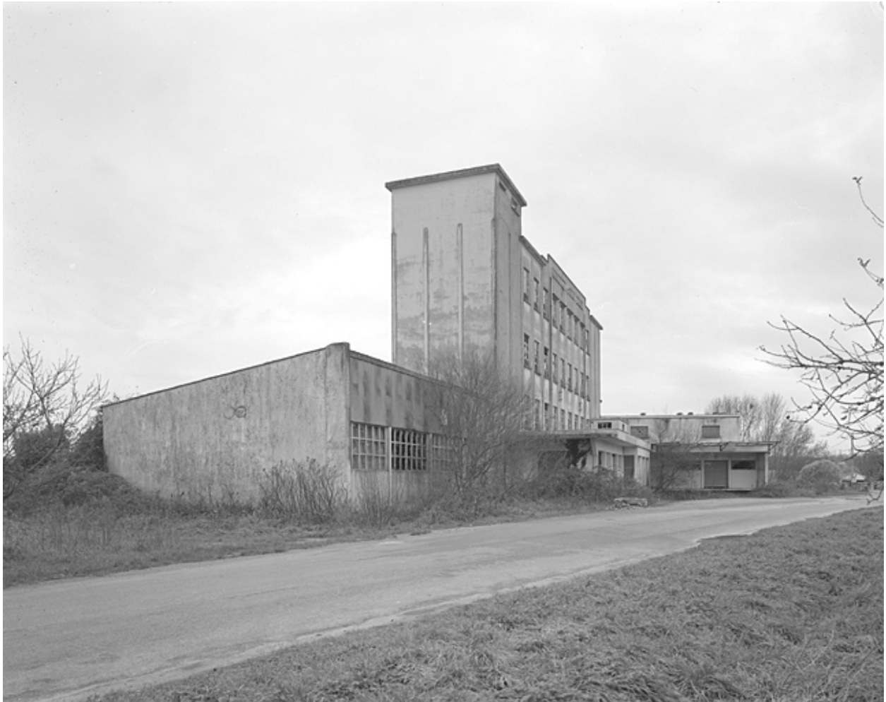
Vue prise du nord.