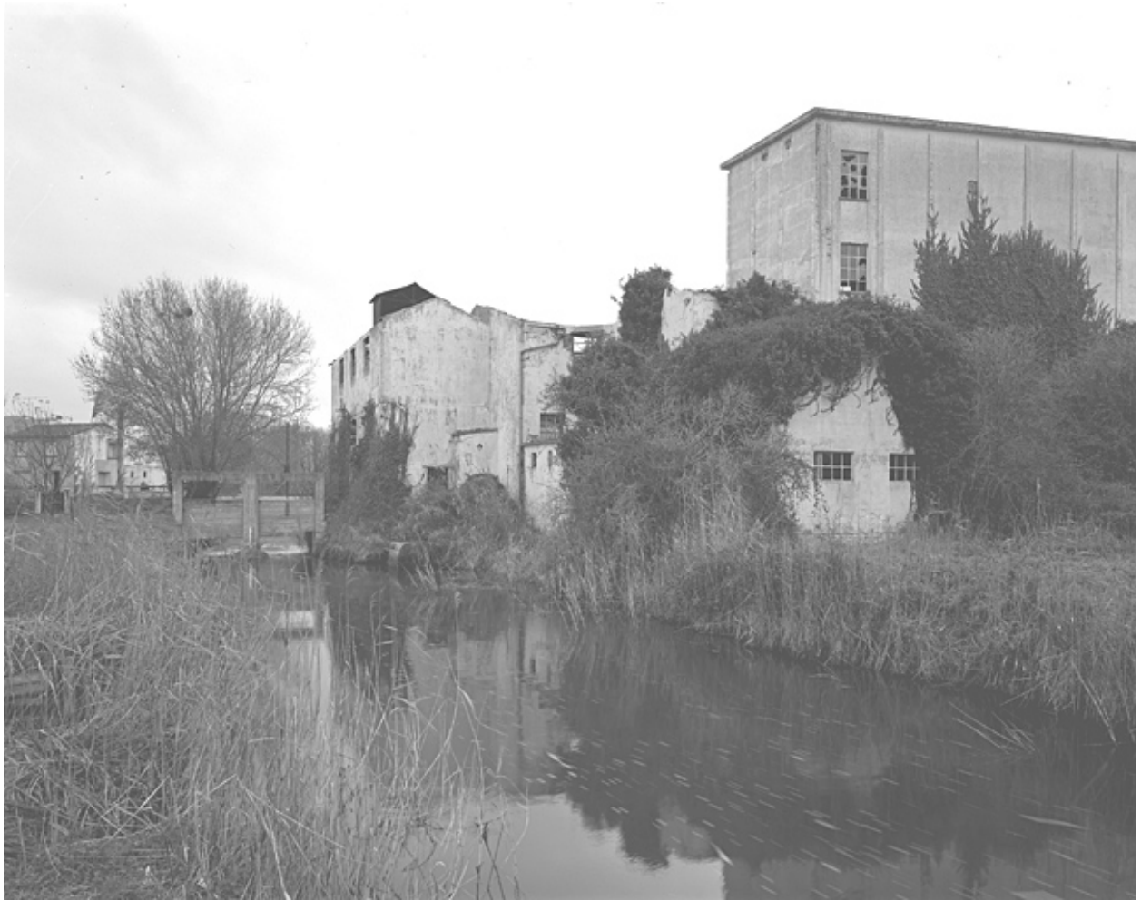
Vue prise du sud est.