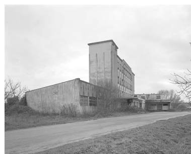
Vue prise du nord. IVR54_19981700019V