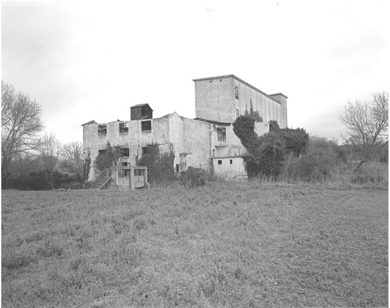
Vue prise du sud.