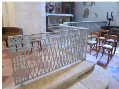
Vue d'ensemble de la clôture.