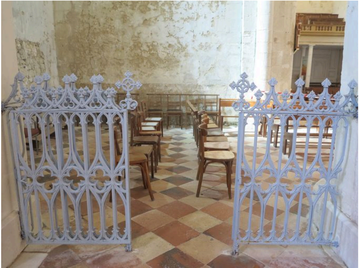
Détail d'éléments fermant une chapelle.