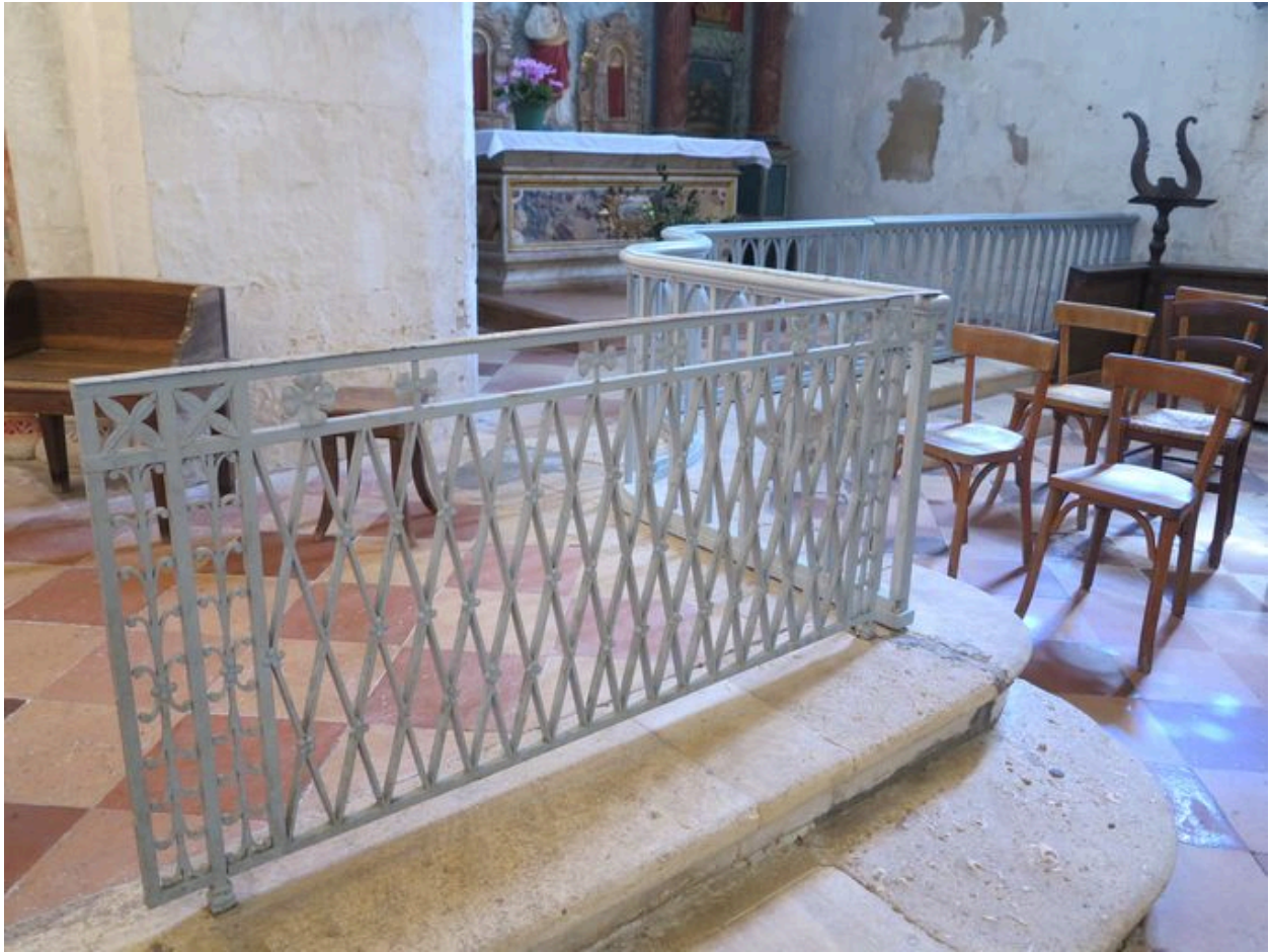
Vue d'ensemble de la clôture.