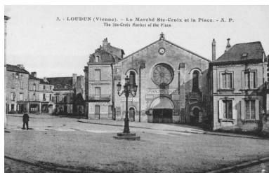
Façade occidentale, carte postale du début du 20e siècle.