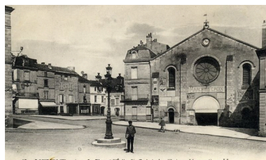
Façade occidentale, carte postale ancienne du début du 20e siècle. IVR54_20108602048NUC