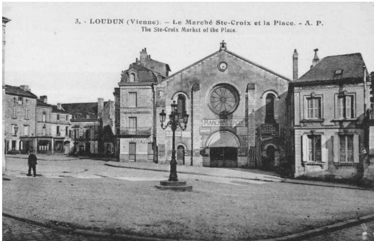
Façade occidentale, carte postale du début du 20e siècle.