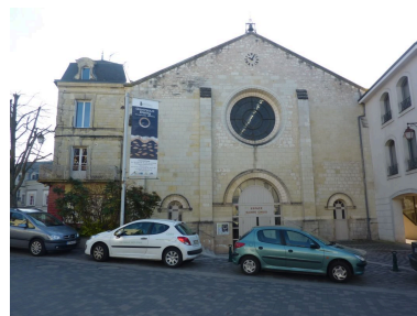
L'ancienne collégiale, dont la façade occidentale a été très remaniée au 19e siècle, donne sur une petite place et sur la rue, au coeur du centre ancien de Loudun.