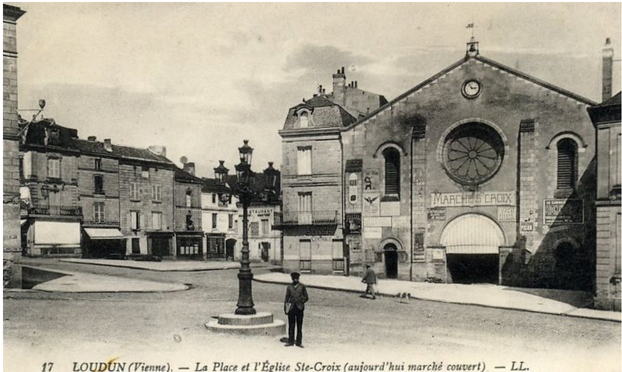
Façade occidentale, carte postale ancienne du début du 20e siècle.