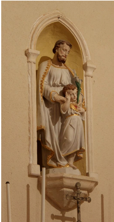
Ensemble de l'autel de saint Joseph : statue de saint Joseph à l'Enfant.