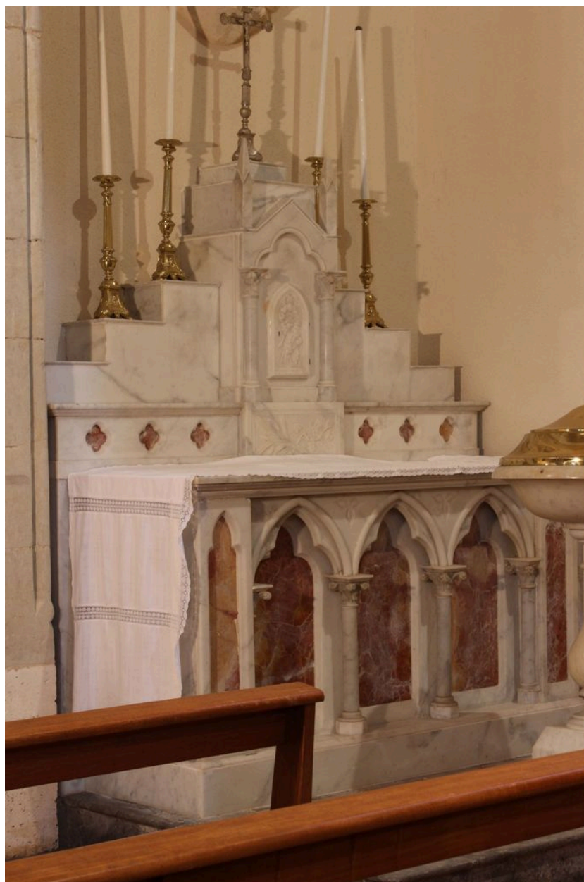
Autel de saint Joseph.