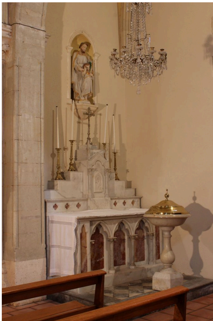
Ensemble de l'autel de saint Joseph avec la niche et la statue.