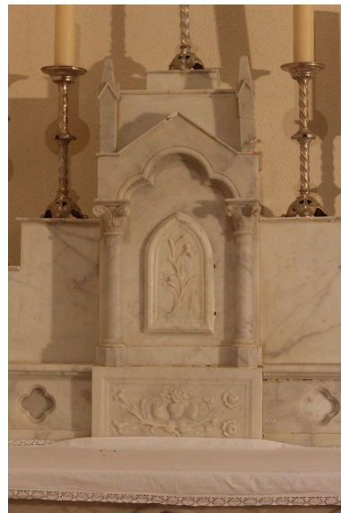
Autel de la Vierge : détail du tabernacle. IVR72_20134001402NUC2A