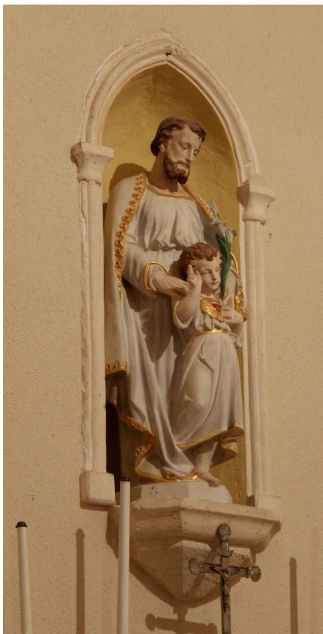
Ensemble de l'autel de saint Joseph : statue de saint Joseph à l'Enfant.