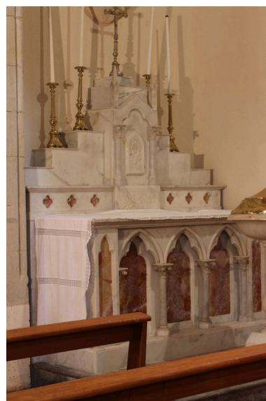
Autel de saint Joseph. IVR72_20134001399NUC2A