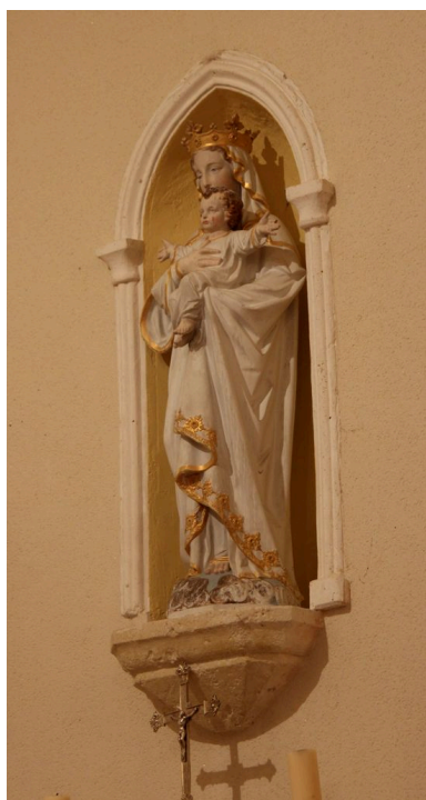
Ensemble de l'autel de la Vierge : statue de la Vierge à l'Enfant.