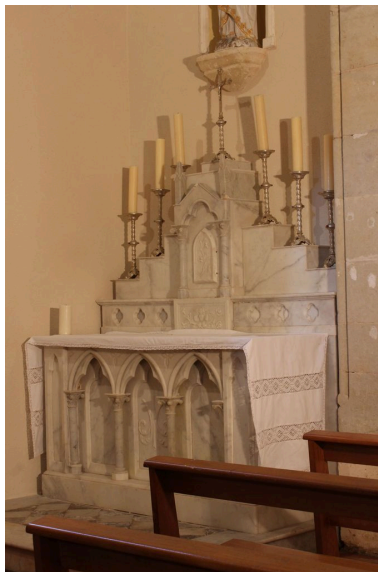
Autel de la Vierge.