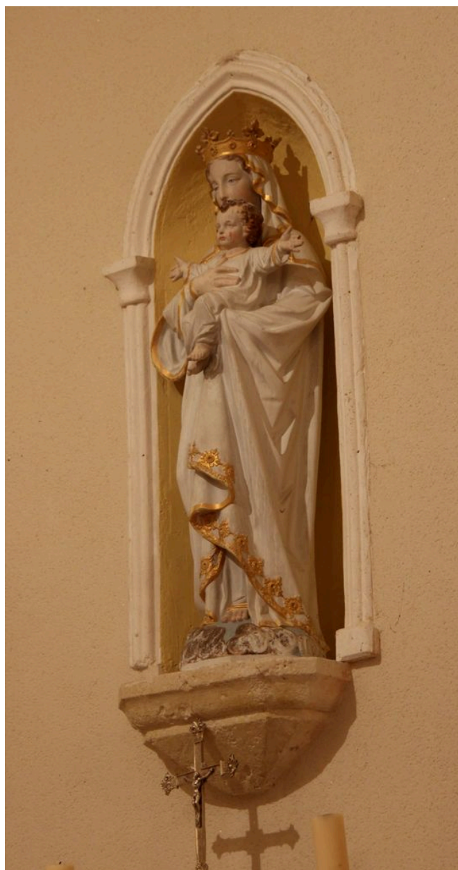
Ensemble de l'autel de la Vierge : statue de la Vierge à l'Enfant.