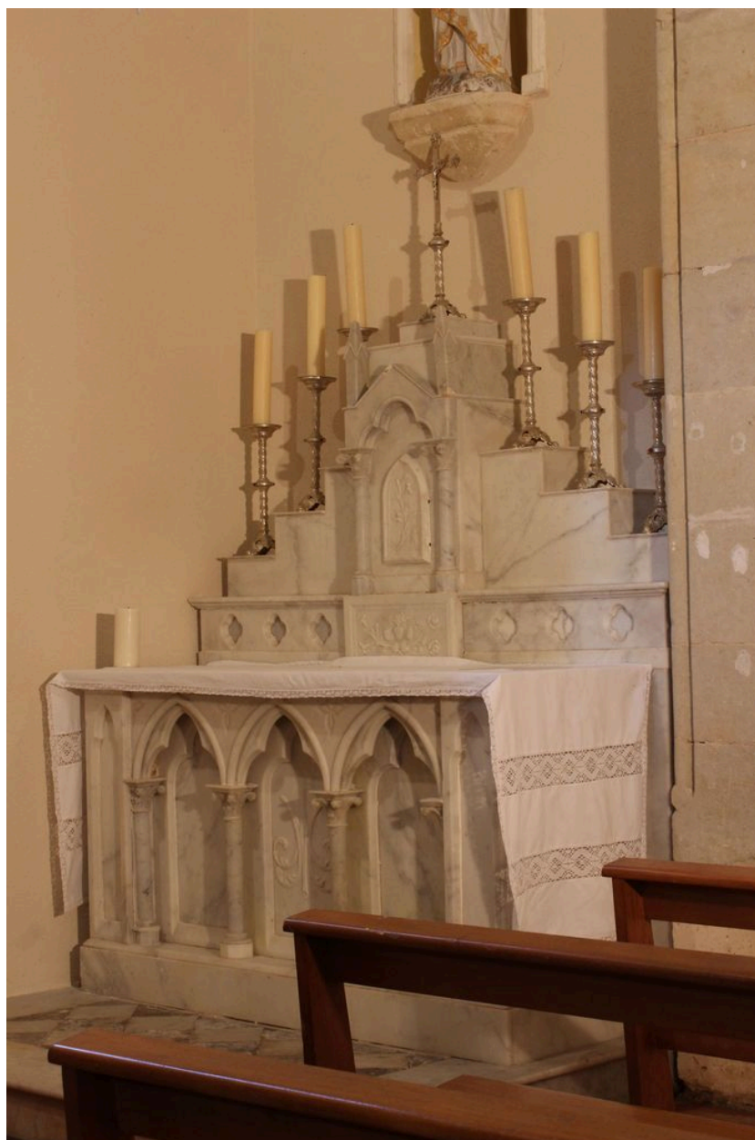
Autel de la Vierge.