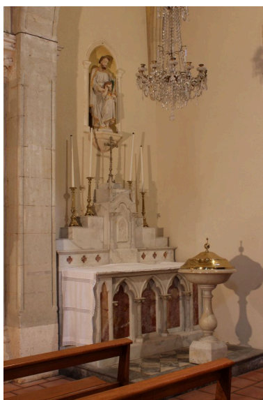
Ensemble de l'autel de saint Joseph avec la niche et la statue. IVR72_20134001398NUC2A