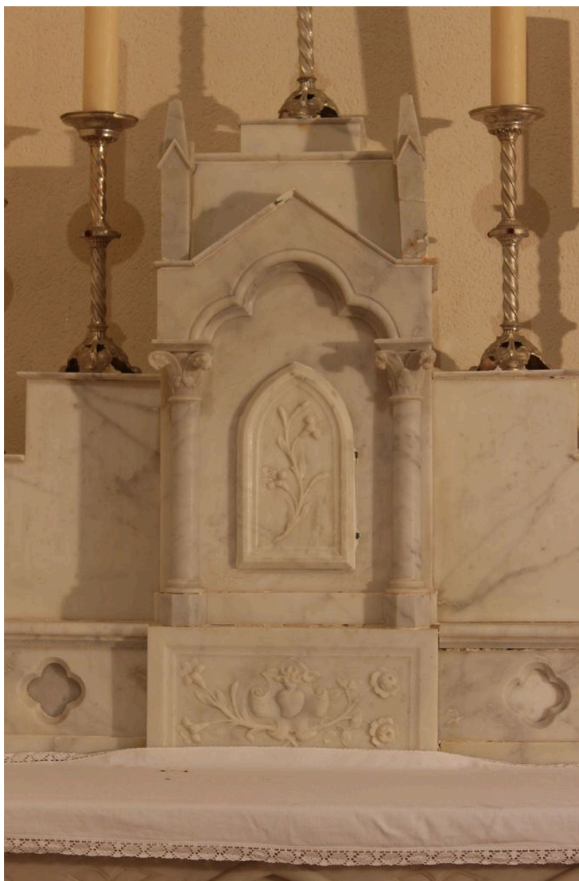
Autel de la Vierge : détail du tabernacle.