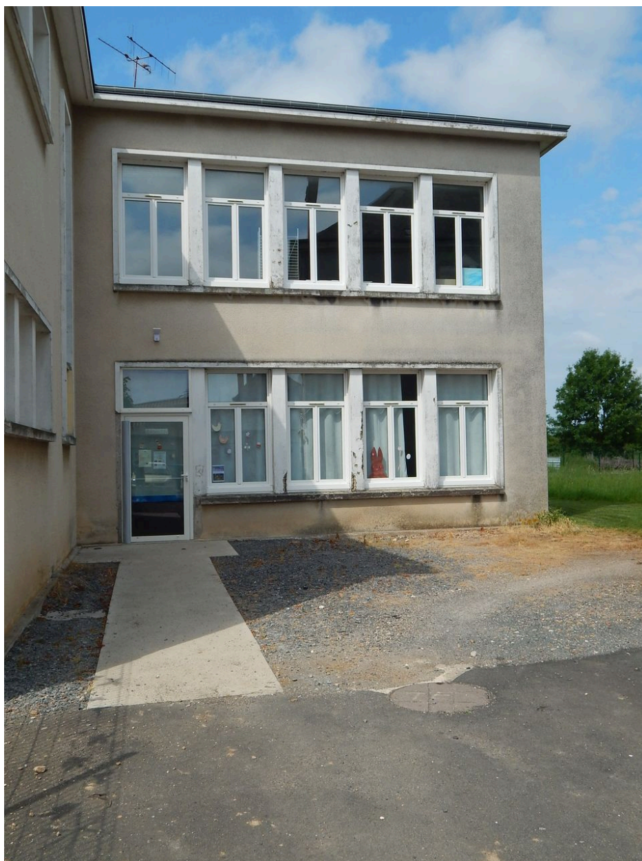
Partie orientale du bâtiment construit dans les années 1950.