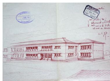
Croquis de 1957, représentant le bâtiment construit dans les années 1950.