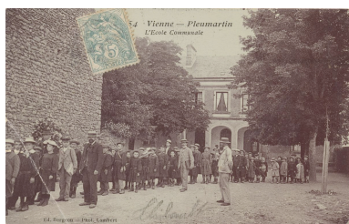
Carte postale : l'ancienne école des filles, devenue ensuite école des garçons.