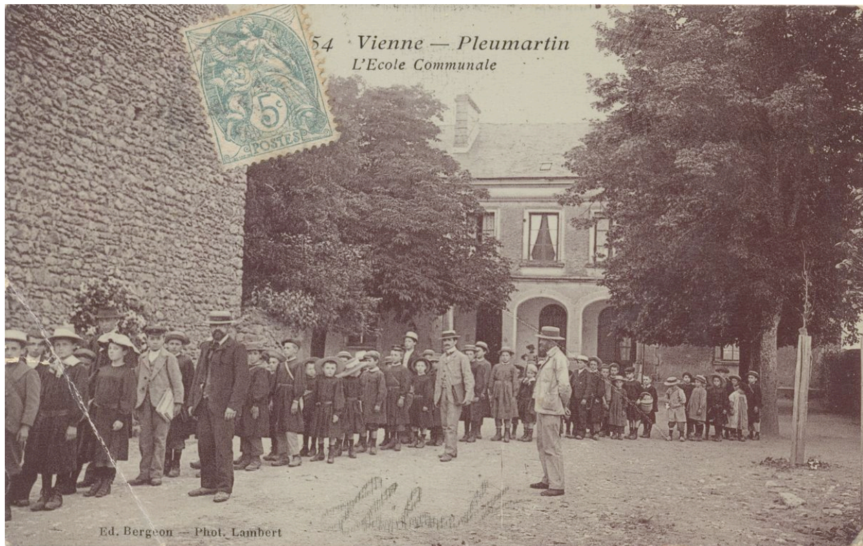
Carte postale : l'ancienne école des filles, devenue ensuite école des garçons.