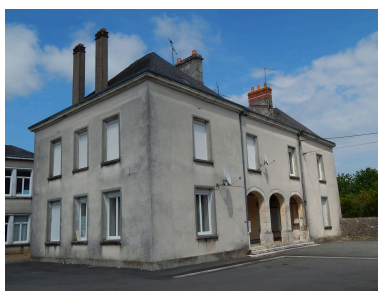
Ancienne école des filles. IVR75_20188607793NUCA