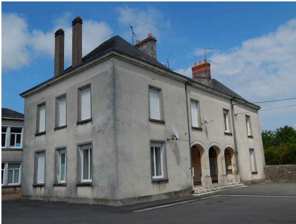
Ancienne école des filles.