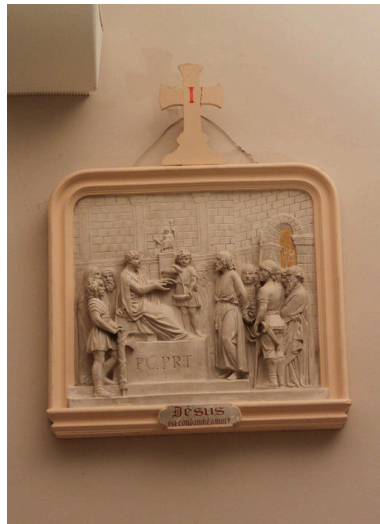
Station I. IVR72_20114001059NUC2A