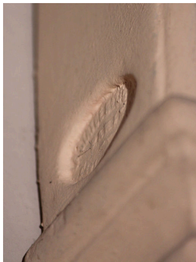
Cachet de fabricant sur la station I. IVR72_20114001060NUC2A