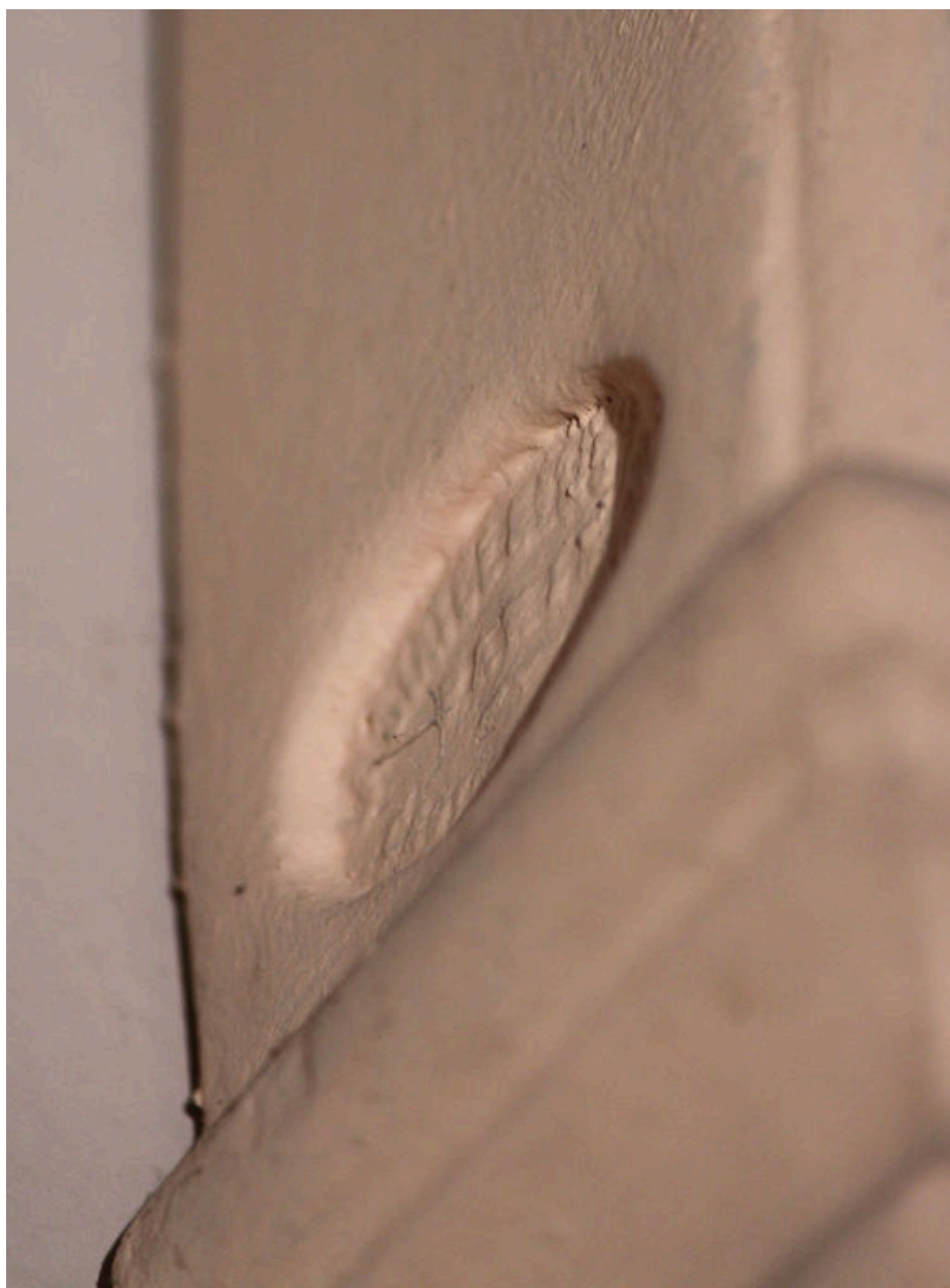
Cachet de fabricant sur la station I.