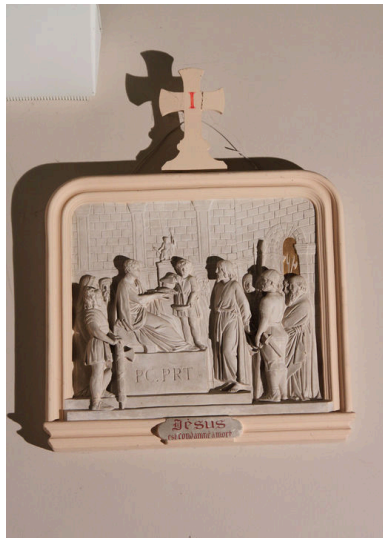
Station I. IVR72_20114001058NUC2A