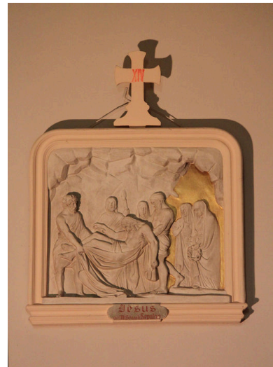
Station XIV. IVR72_20114001061NUC2A