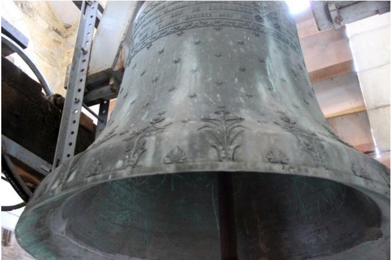
Détail du décor au bas du vase.