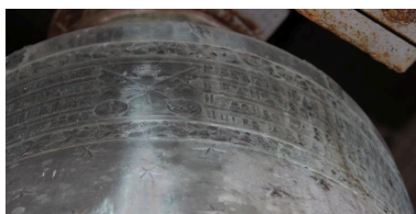
Détail de la dédicace (tiare et clés) sur le vase supérieur.

IVR72_20196401033NUC2A