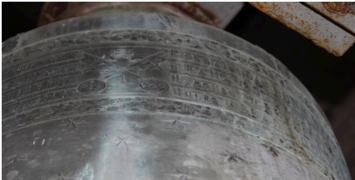
Détail de la dédicace (tiare et clés) sur le vase supérieur.