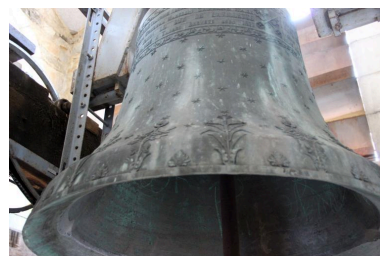
Détail du décor au bas du vase. IVR72_20196401035NUC2A

IVR72_20196401034NUC2A