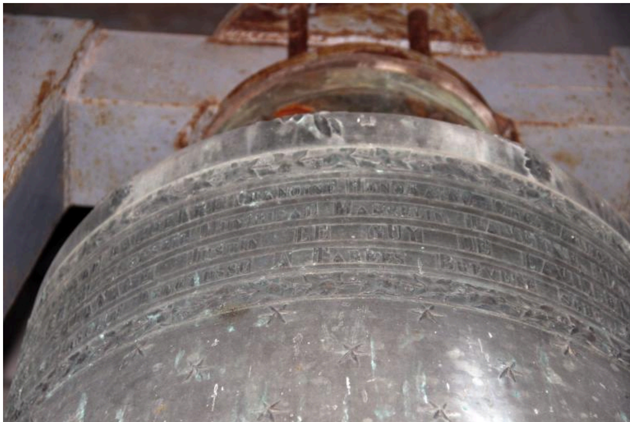
Détail de la dédicace sur le vase supérieur.