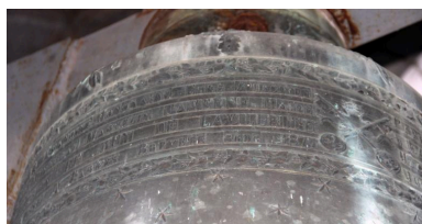
Détail de la dédicace sur le vase supérieur.

IVR72_20196401032NUC2A