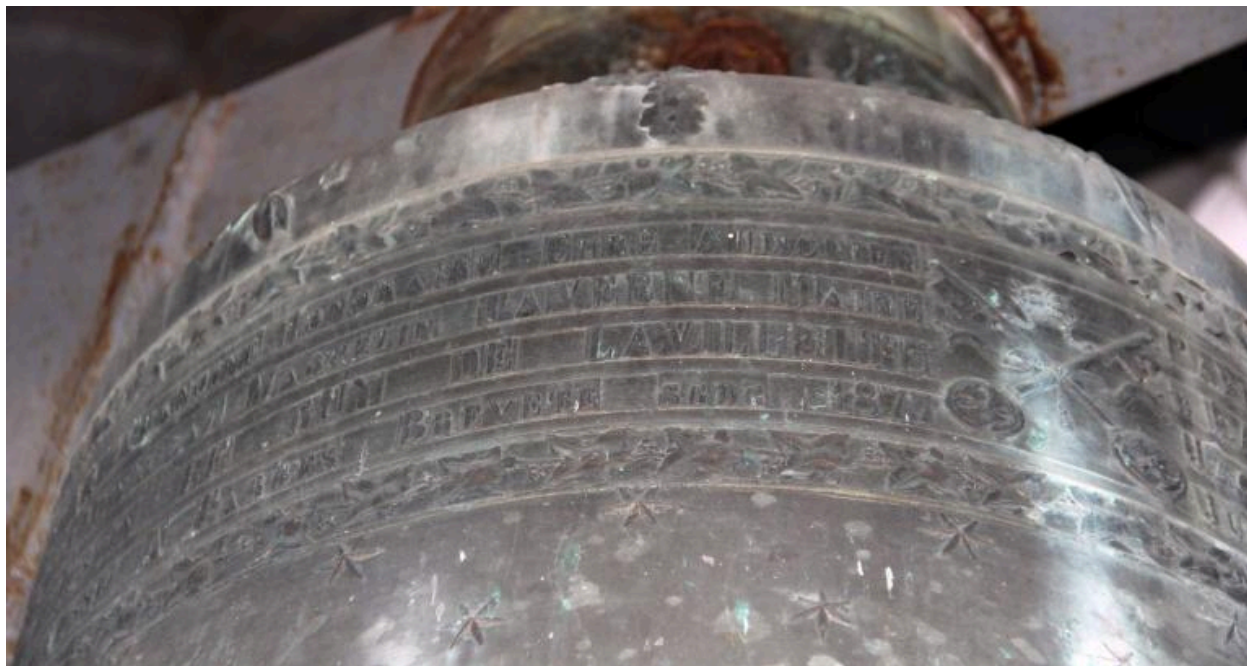
Détail de la dédicace sur le vase supérieur.