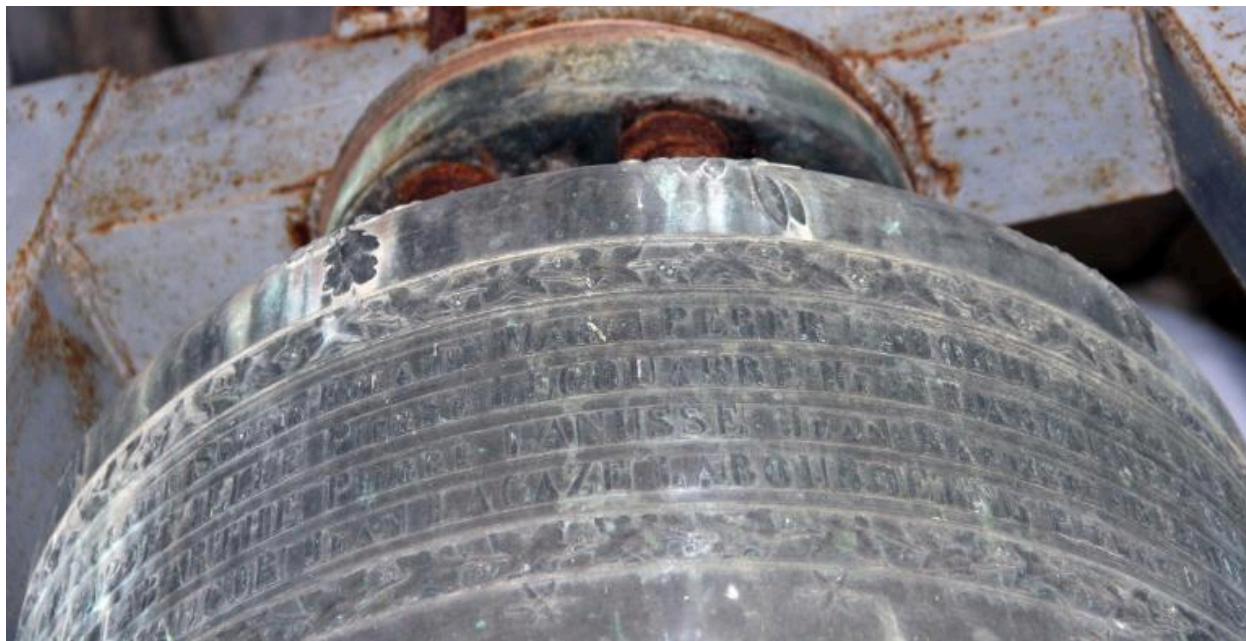
Détail de la dédicace sur le vase supérieur.