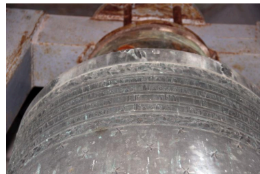
Détail de la dédicace sur le vase supérieur.

Phot. Jean-Philippe Maissonave IVR72_20196401031NUC2A