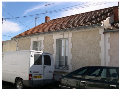
Elévation antérieure.