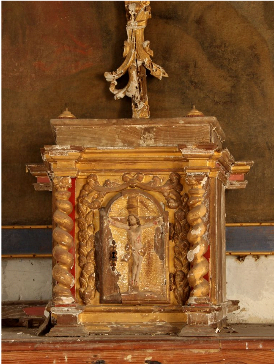
Ensemble de face.