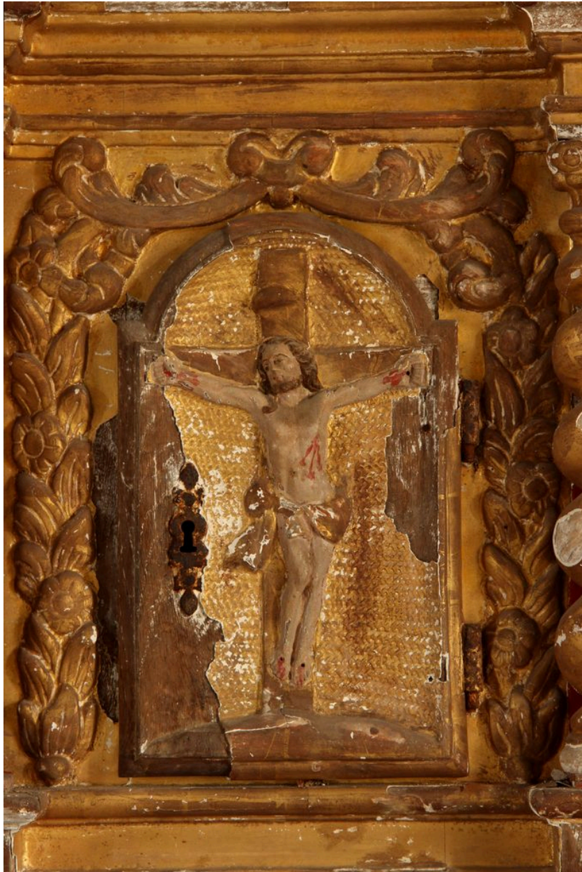
Détail de la porte (Christ en croix).