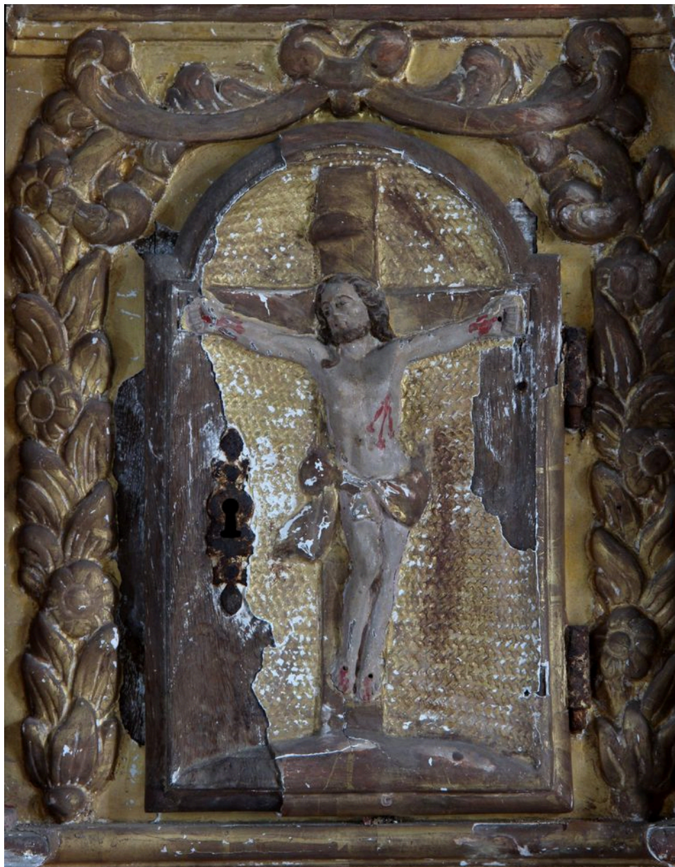
Détail de la porte (Christ en croix).