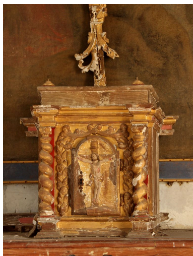
Ensemble de face.

Phot. Jean-Philippe Maisonnave IVR72_20144000940NUC2A