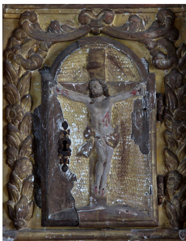
Détail de la porte (Christ en croix).

Phot. Jean-Philippe Maisonnave IVR72_20144000942NUC2A