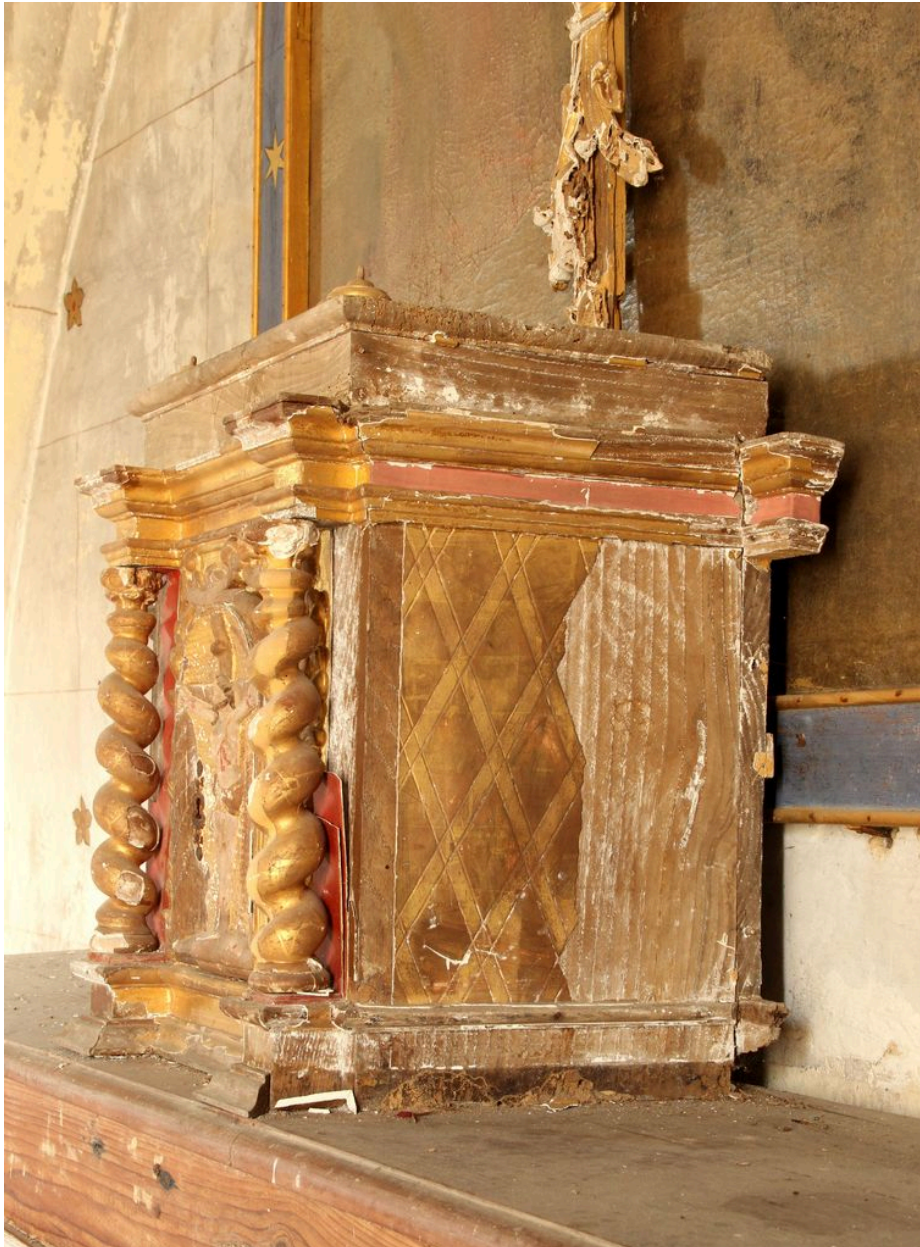
Ensemble du côté droit.