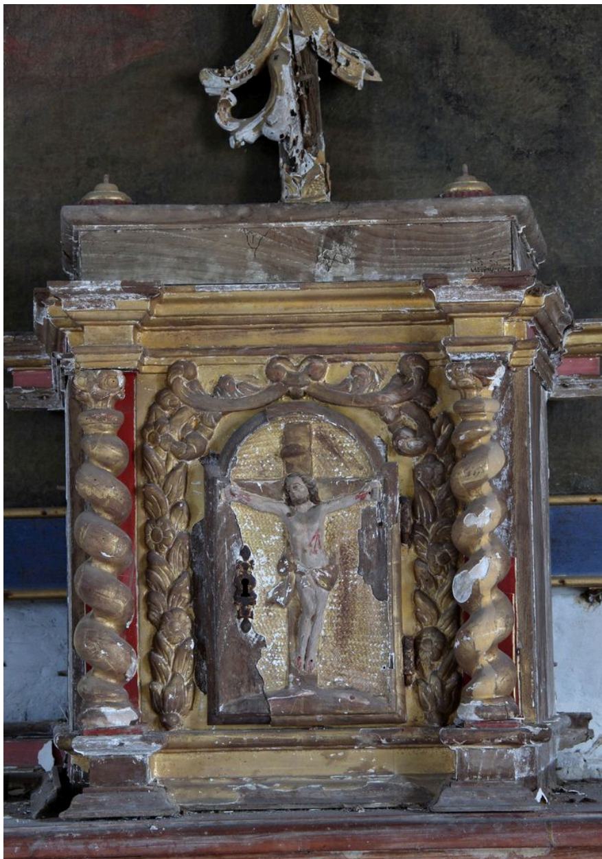
Ensemble de face.