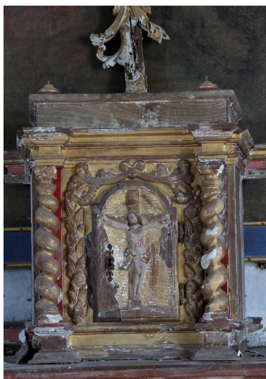
Ensemble de face.

Phot. Jean-Philippe Maisonnave IVR72_20144000940NUC2A