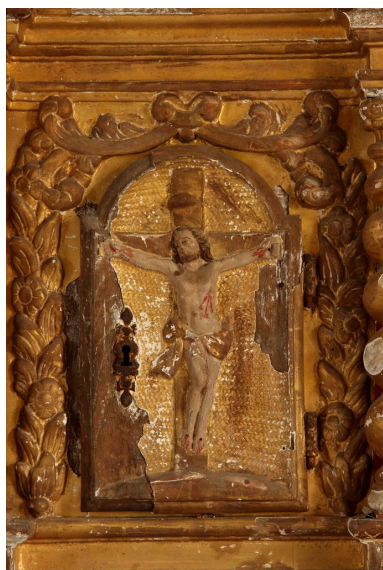
Détail de la porte (Christ en croix).

Phot. Jean-Philippe Maisonnave IVR72_20144000941NUC2A