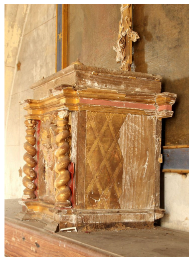
Ensemble du côté droit.

IVR72_20144000944NUC2A