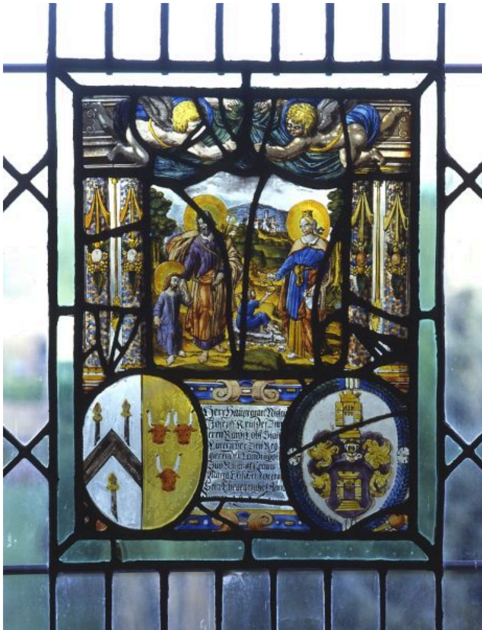
Vantail inférieur gauche.