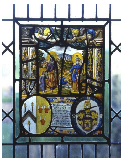
Vantail inférieur gauche. IVR74_19948701367XA