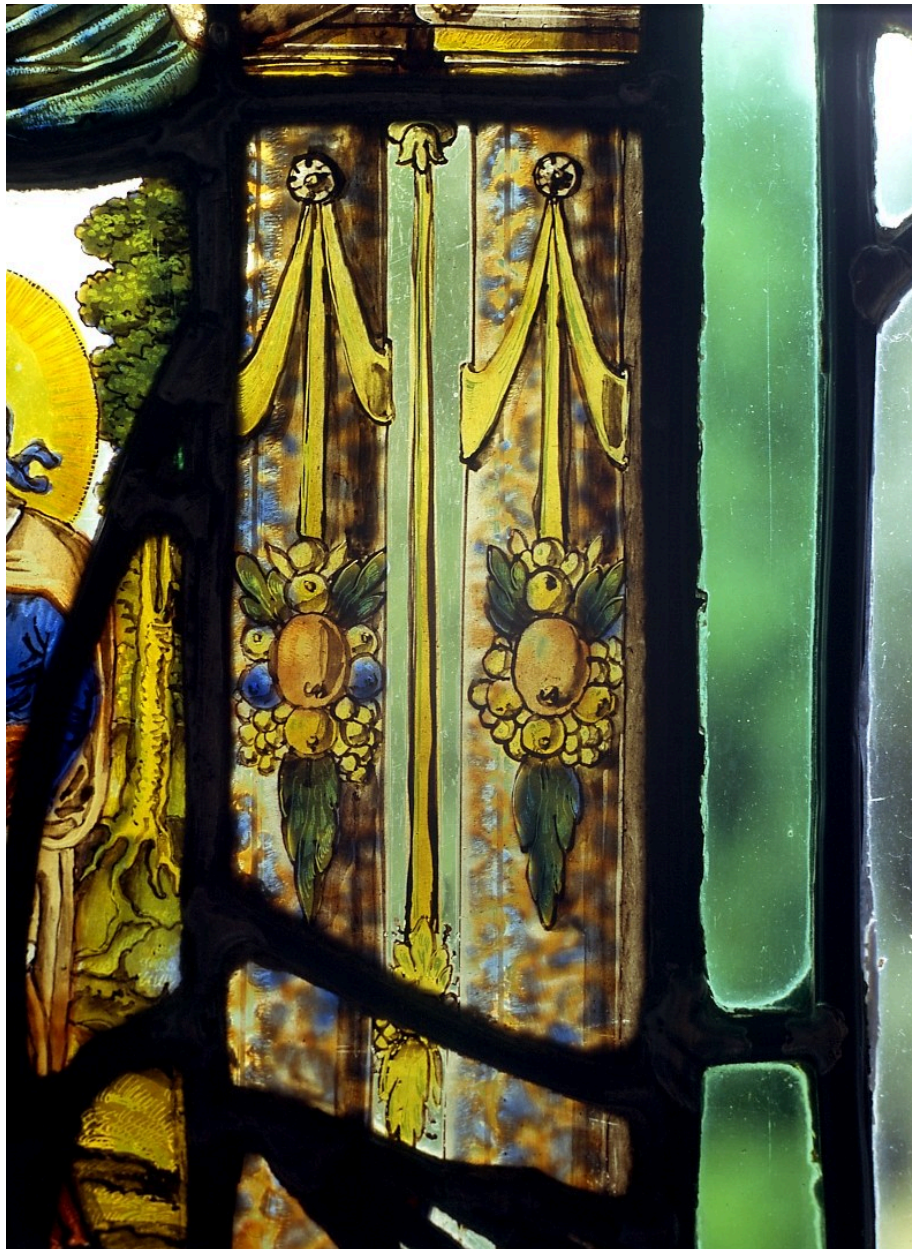
Vantail inférieur gauche : détail des colonnes de marbre ornées de grappes de fruits.