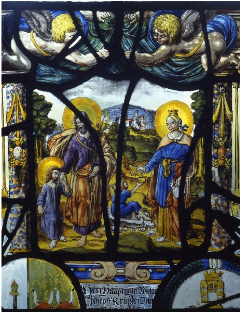
Vantail inférieur gauche : saint Joseph et l'Enfant Jésus, sainte Catherine faisant l'aumône.