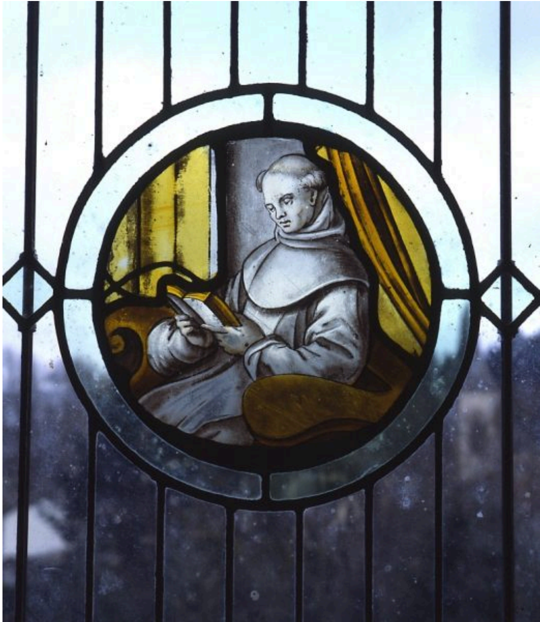
Vantail supérieur droit : moine lisant.