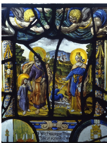
Vantail inférieur gauche : saint Joseph et l'Enfant Jésus, sainte Catherine faisant l'aumône.