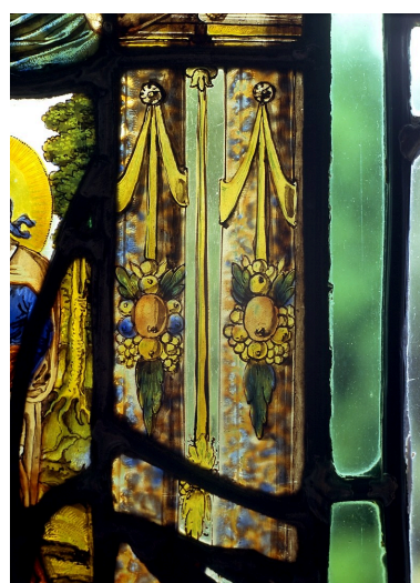
Vantail inférieur gauche : détail des colonnes de marbre ornées de grappes de fruits. IVR74_20068700624XA