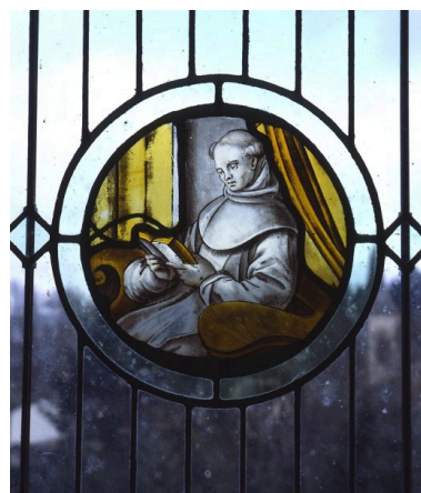
Vantail supérieur droit : moine lisant. IVR74_19948701361XA