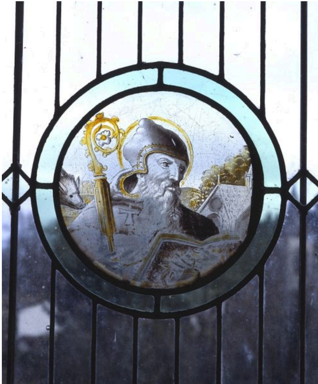
Vantail supérieur gauche : saint Antoine.