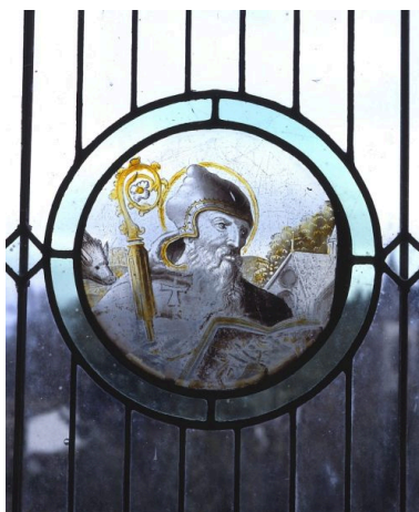
Vantail supérieur gauche : saint Antoine.