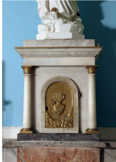
Tabernacle.