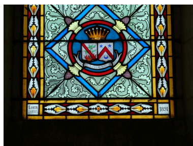
Détail des armoiries et de la signature du fabricant.