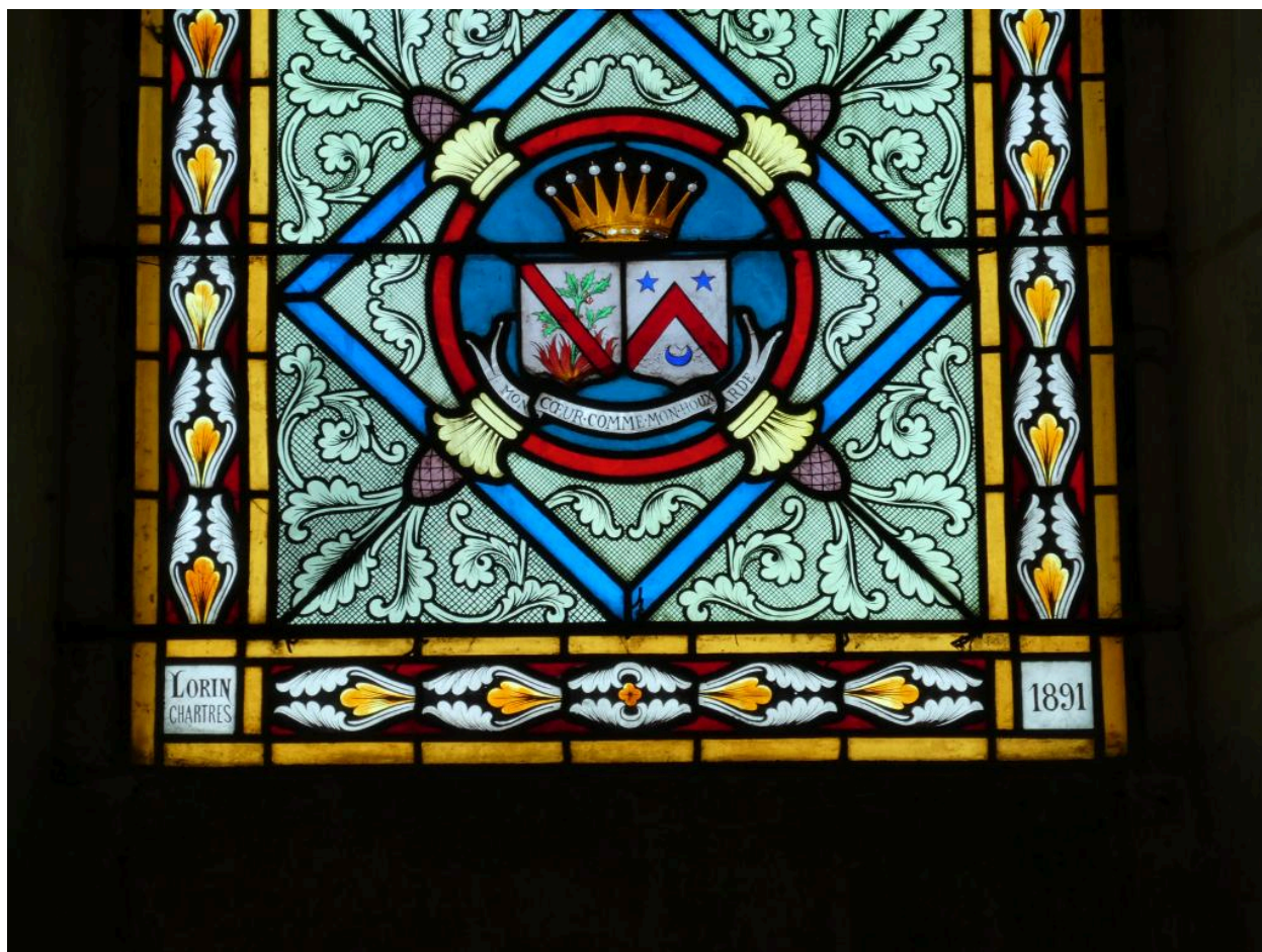
Détail des armoiries et de la signature du fabricant.