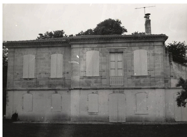
Façade antérieure : état en 1974.

IVR72_20123302795NUCA