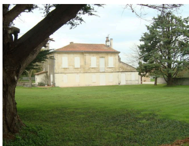
Vue du logis depuis le sud.