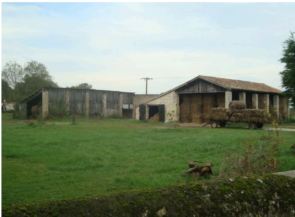
Hangar agricole et grange.