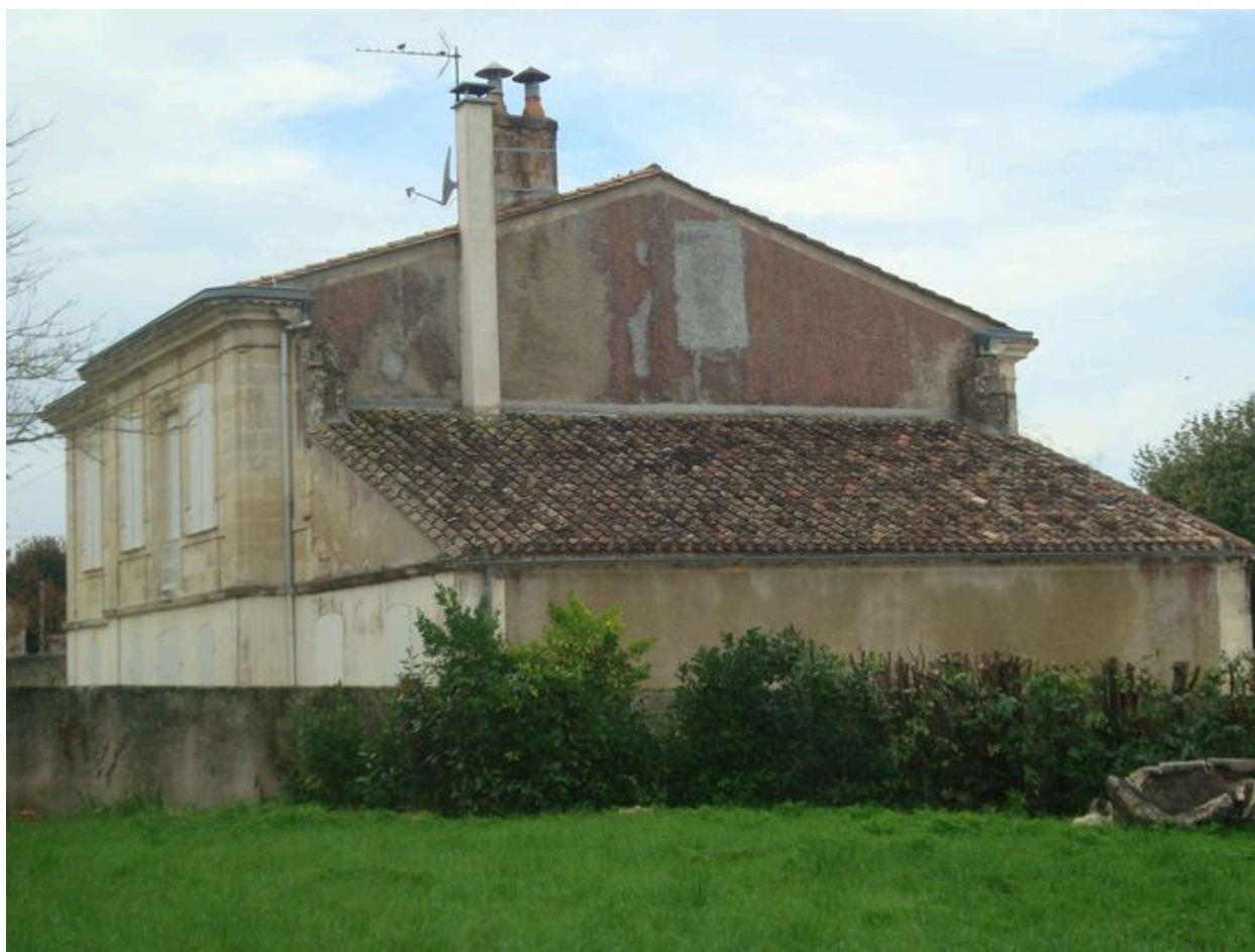
Vue d'ensemble du logis.