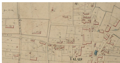
Extrait du plan cadastral de 1833, section C : parcelles 139 et 140.

Phot. Archives départementales de la Gironde IVR72_20123302795NUCA