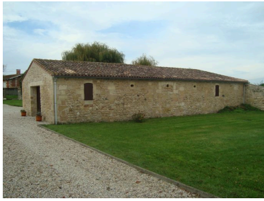
IVR72_20123302841NUCA