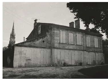
Façade postérieure : état en 1974.

Autr. Jessica Bidalun IVR72_19743302080X