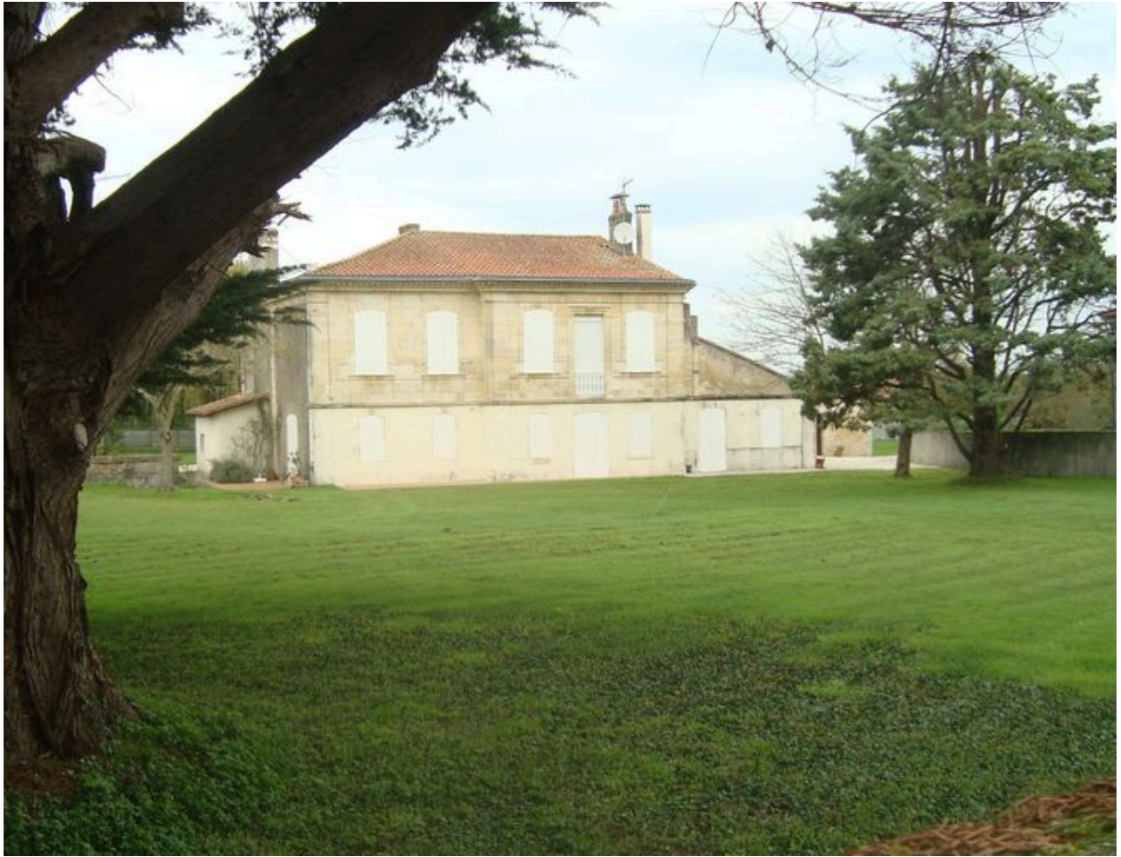
Vue du logis depuis le sud.