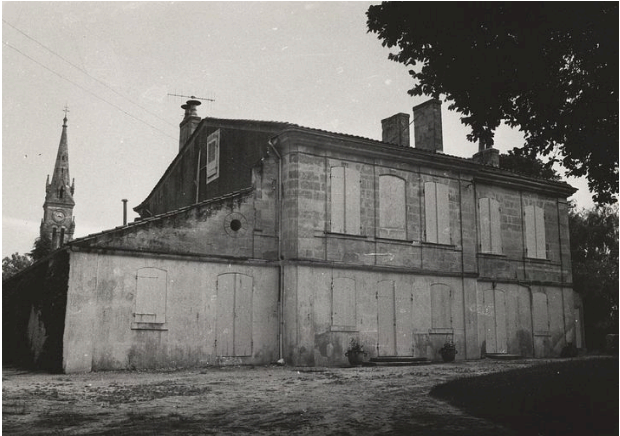
Façade postérieure : état en 1974.