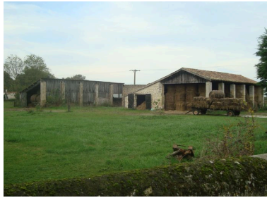
Hangar agricole et grange. IVR72_20123302839NUCA