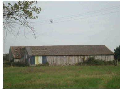
Bâtiments agricoles (façades postérieures). IVR72_20123302888NUCA