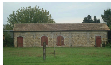
Chai. IVR72_20123302838NUCA