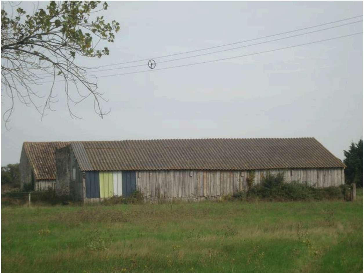
Bâtiments agricoles (façades postérieures).