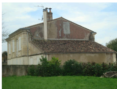
Vue d'ensemble du logis. IVR72_20123302836NUCA