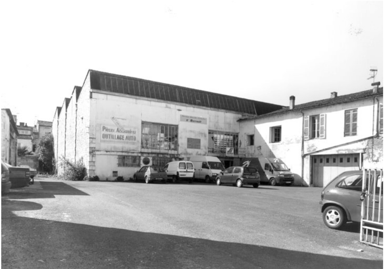
Vue d'ensemble prise du nord est.