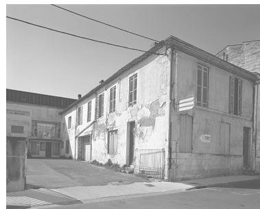
Bureau et logement vus du nord est. IVR54_19991700192V