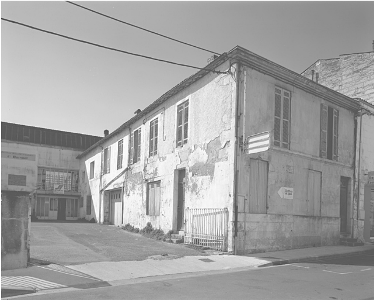
Bureau et logement vus du nord est.