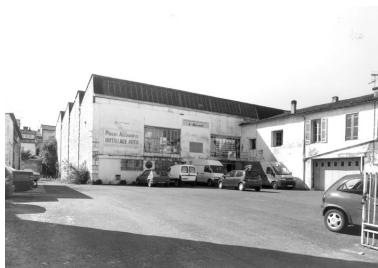
Vue d'ensemble prise du nord est. IVR54_19991700191V