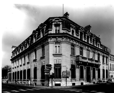
Élévations est et sud sur rue.