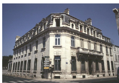
Vue d'ensemble depuis le sud-est. IVR54_20021702277ZA