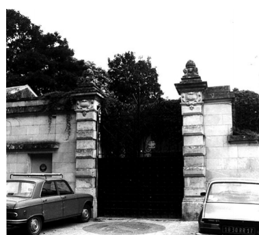
Portail à l'ouest donnant sur le chemin du Rempart. IVR54_19821700599Z