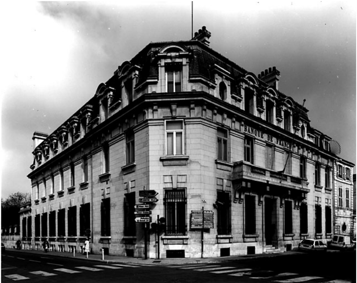
Elévations est et sud sur rue.