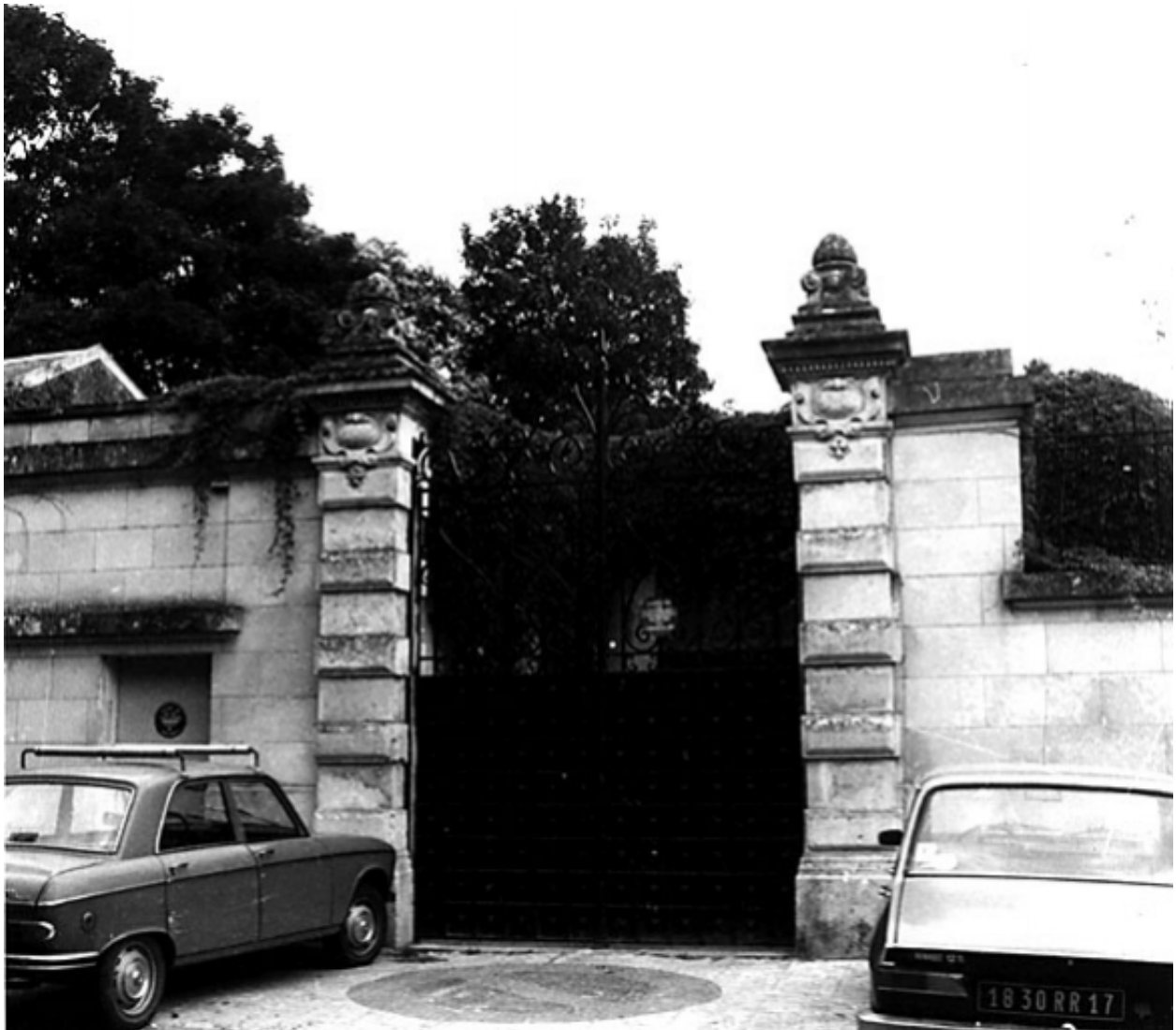
Portail à l'ouest donnant sur le chemin du Rempart.