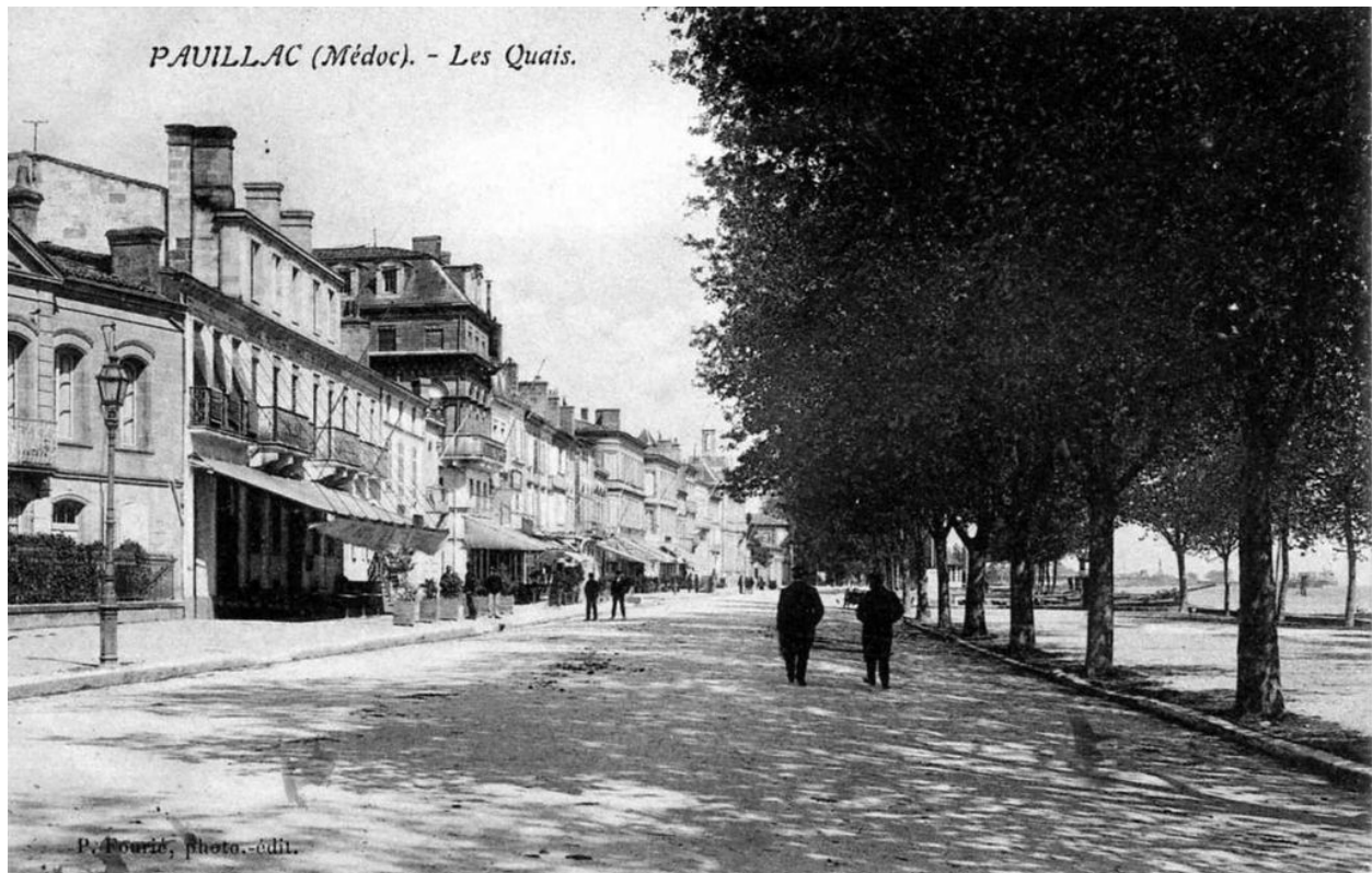
Carte postale (collection particulière) : Pauillac, les quais (P. Fourié).