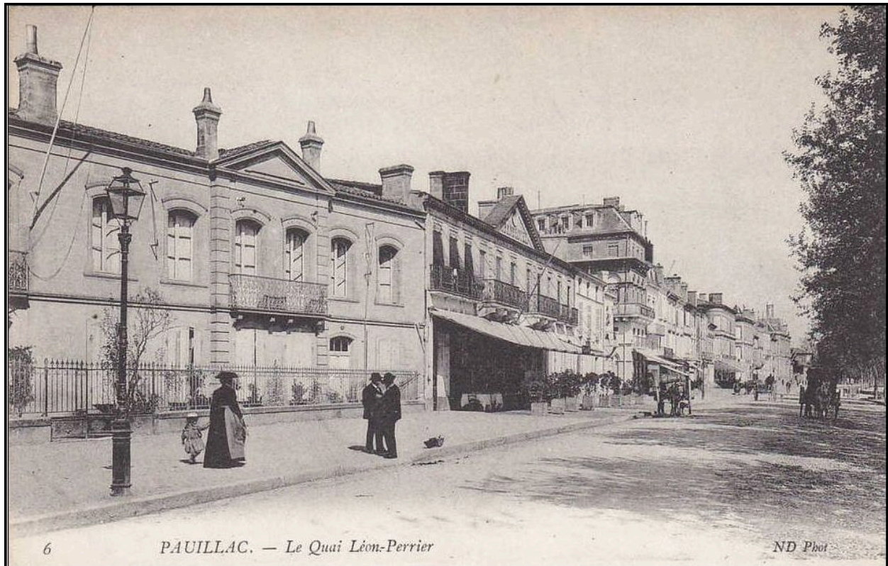
Carte postale, début 20e siècle (collection particulière) : Pauillac, le quai Léon-Perrier (ND Phot.).