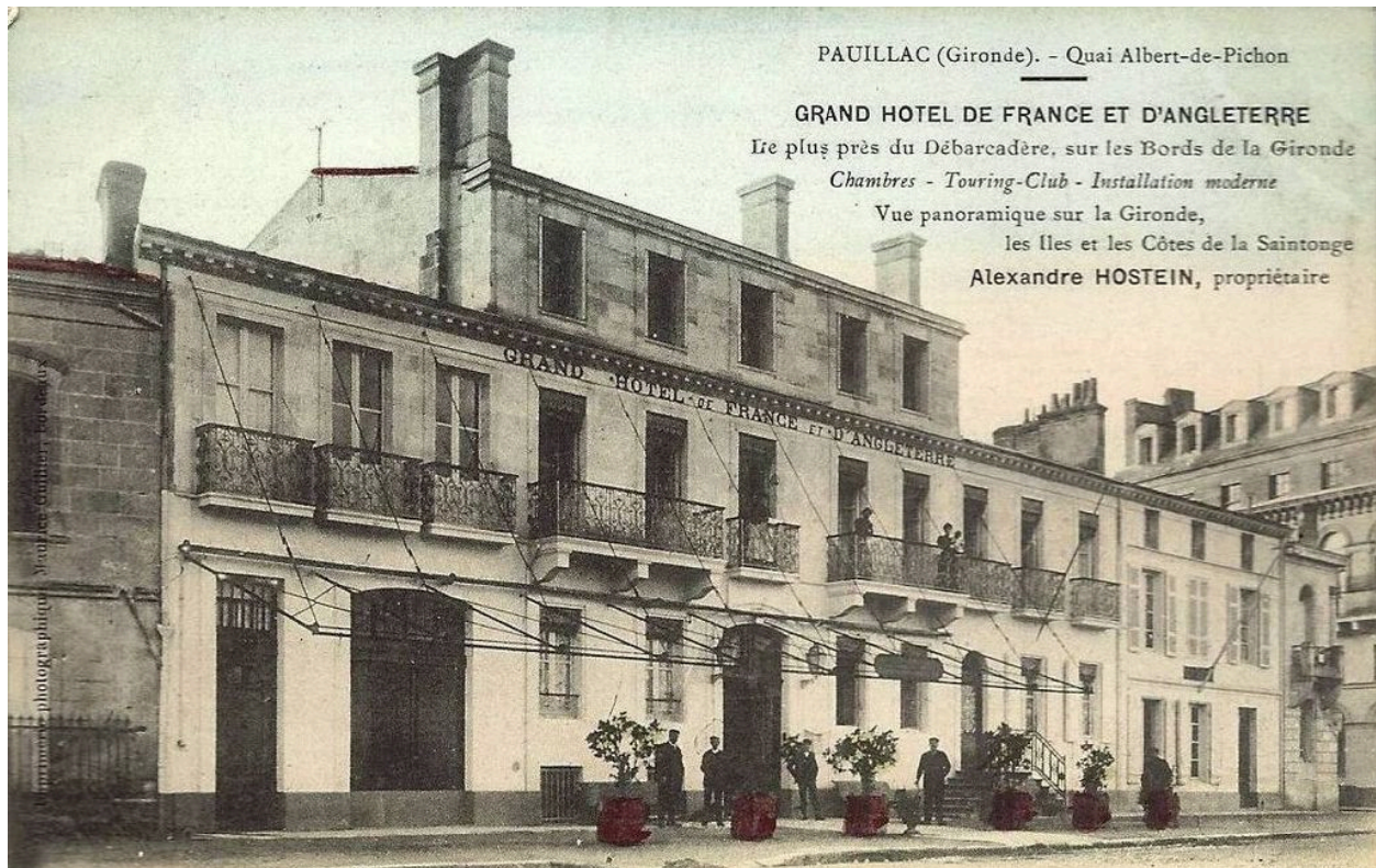
Carte postale (collection particulière) : Grand Hôtel de France et d'Angleterre, Pauillac (imprimerie photographique Maurice Guillier).