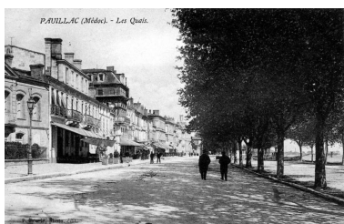
Carte postale (collection particulière) : Pauillac, les quais.