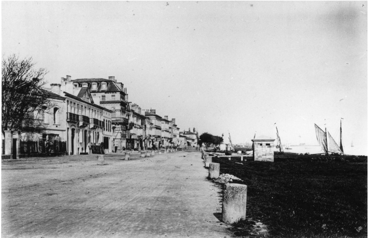
Photographie, vers 1868 : vue des quais.