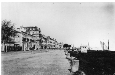
Photographie, vers 1868 : vue des quais.