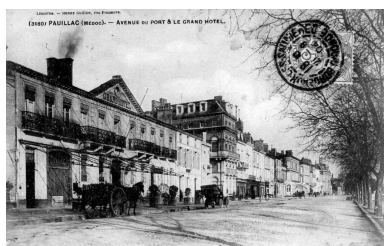
Carte postale (collection particulière) : Pauillac, avenue du port et le Grand Hôtel. IVR72_20173301472NUC1