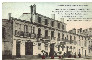
Carte postale (collection particulière) : Grand Hôtel de France et d'Angleterre, Pauillac (imprimerie photographique Maurice Guillier). IVR72_20173301549NUC1A