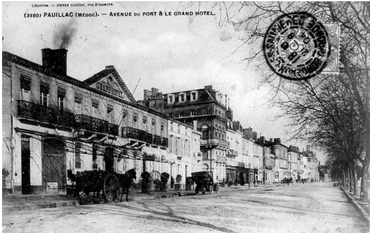
Carte postale (collection particulière) : Pauillac, avenue du port et le Grand Hôtel (Henry Guillier-Libourne).