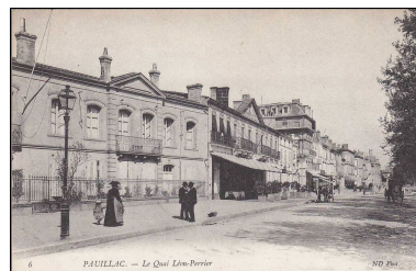
Carte postale, début 20e siècle (collection particulière) : Pauillac, le quai Léon-Perrier