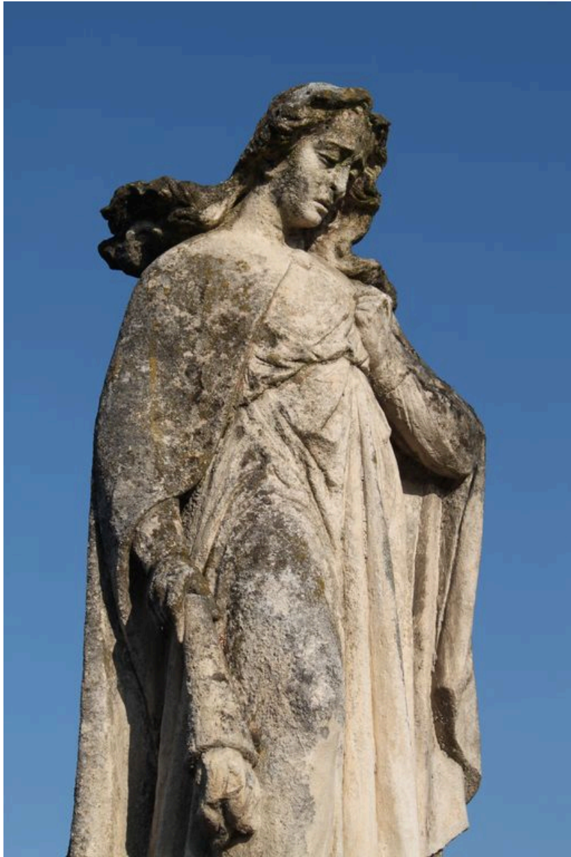
Statue : détail.