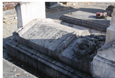
Détail du sarcophage.

IVR72_20124000619NUC2A