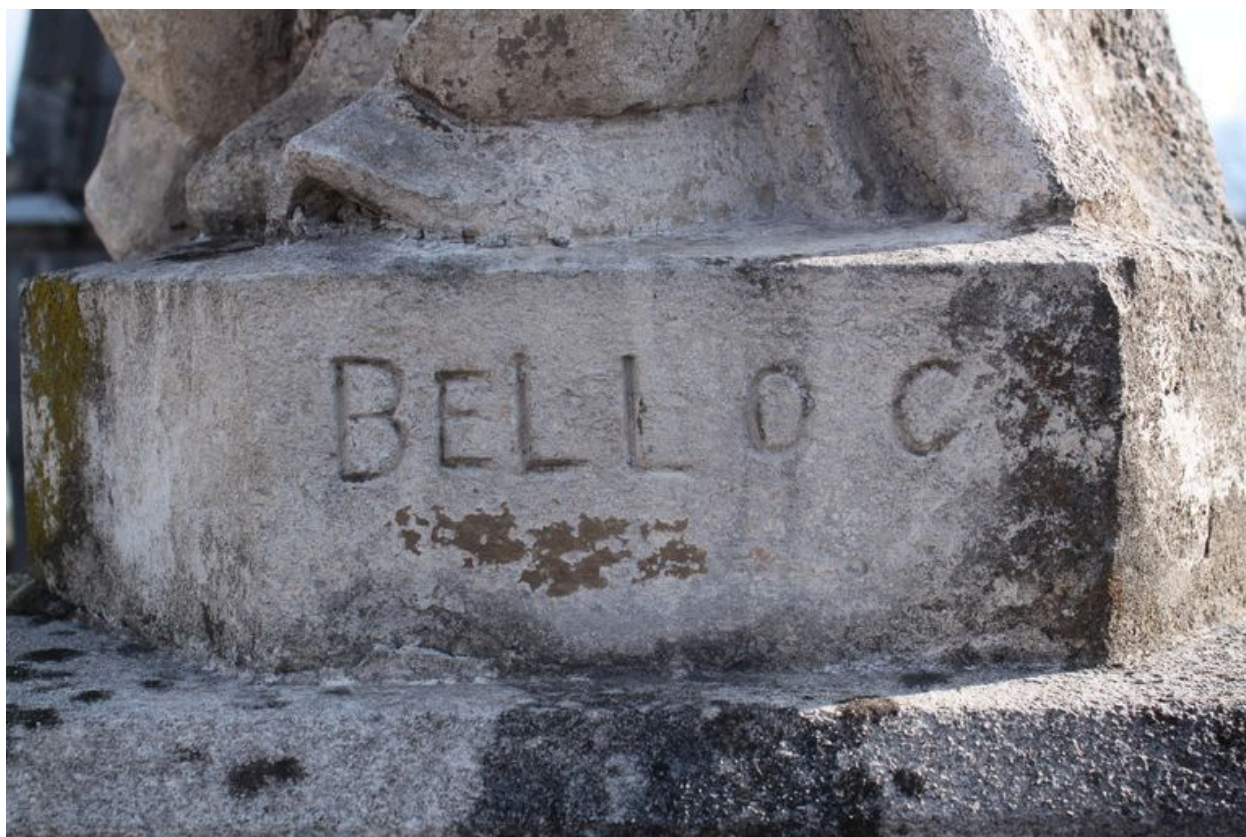
Signature sur le socle de la statue.