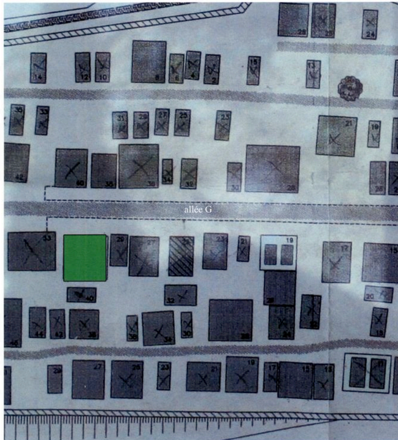
Plan de situation (ensemble et détail).