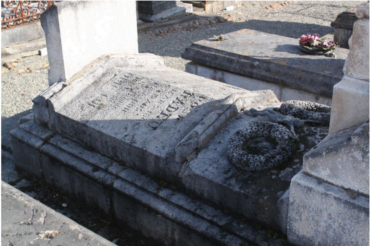
Détail du sarcophage.