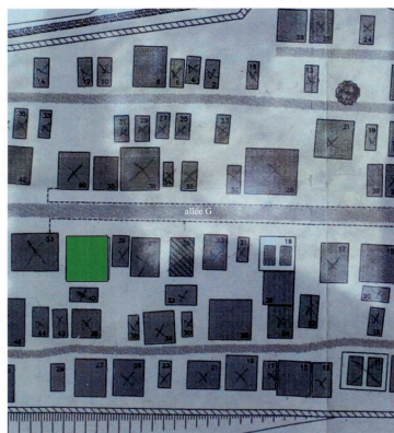
Plan de situation (ensemble et détail).

IVR72_20144000029NUC2A