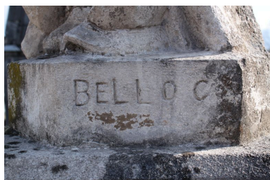
Signature sur le socle de la statue.

IVR72_20124000621NUC2A