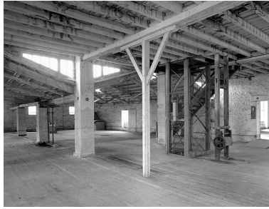
Vue intérieure du premier étage prise du nord-ouest vers le sud-est : mécanisme d'un ancien monte-charge sur la droite.