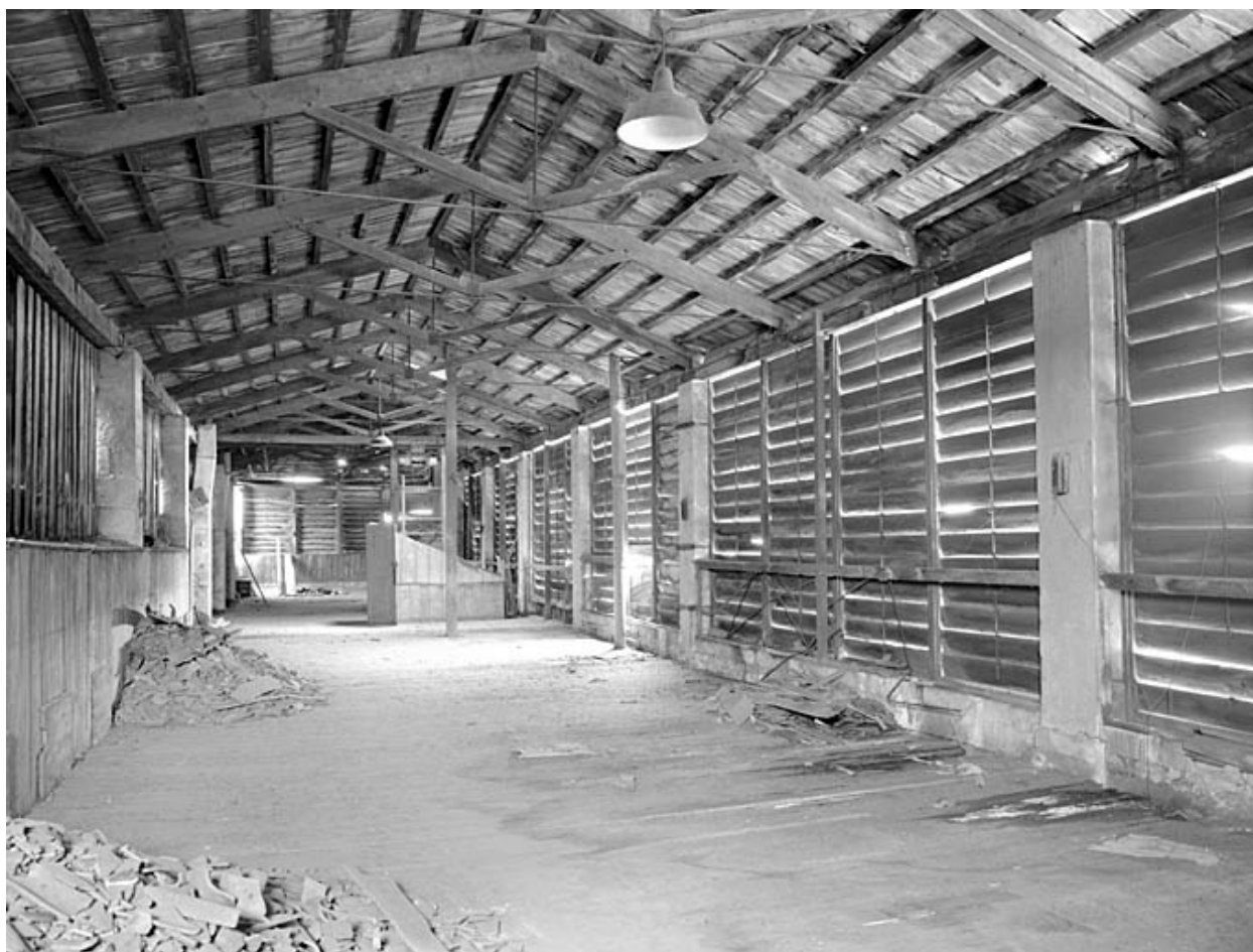
Vue intérieure du séchoir prise du sud vers le nord.