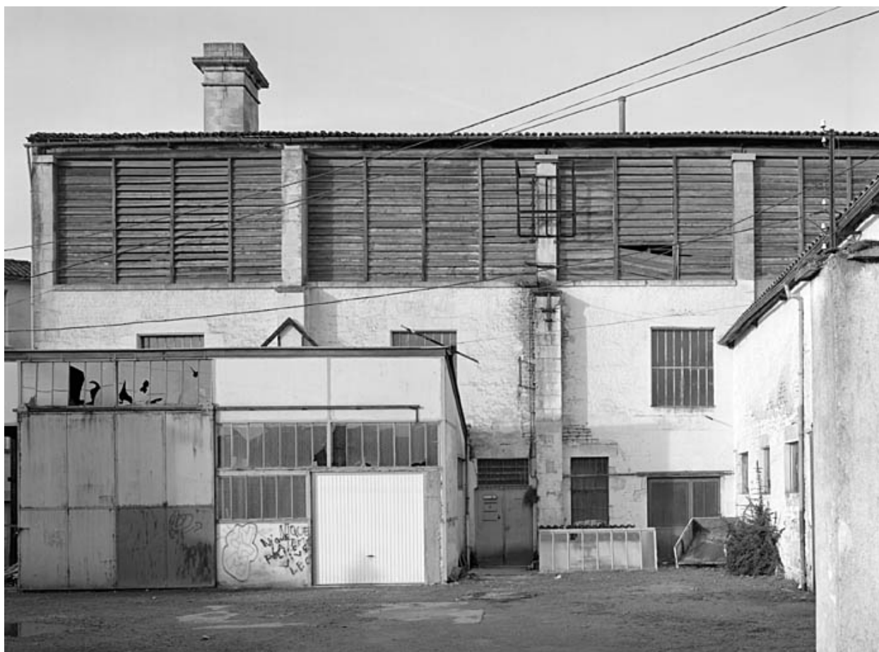
Élévation est du bâtiment abritant l'atelier de fabrication et le séchoir.