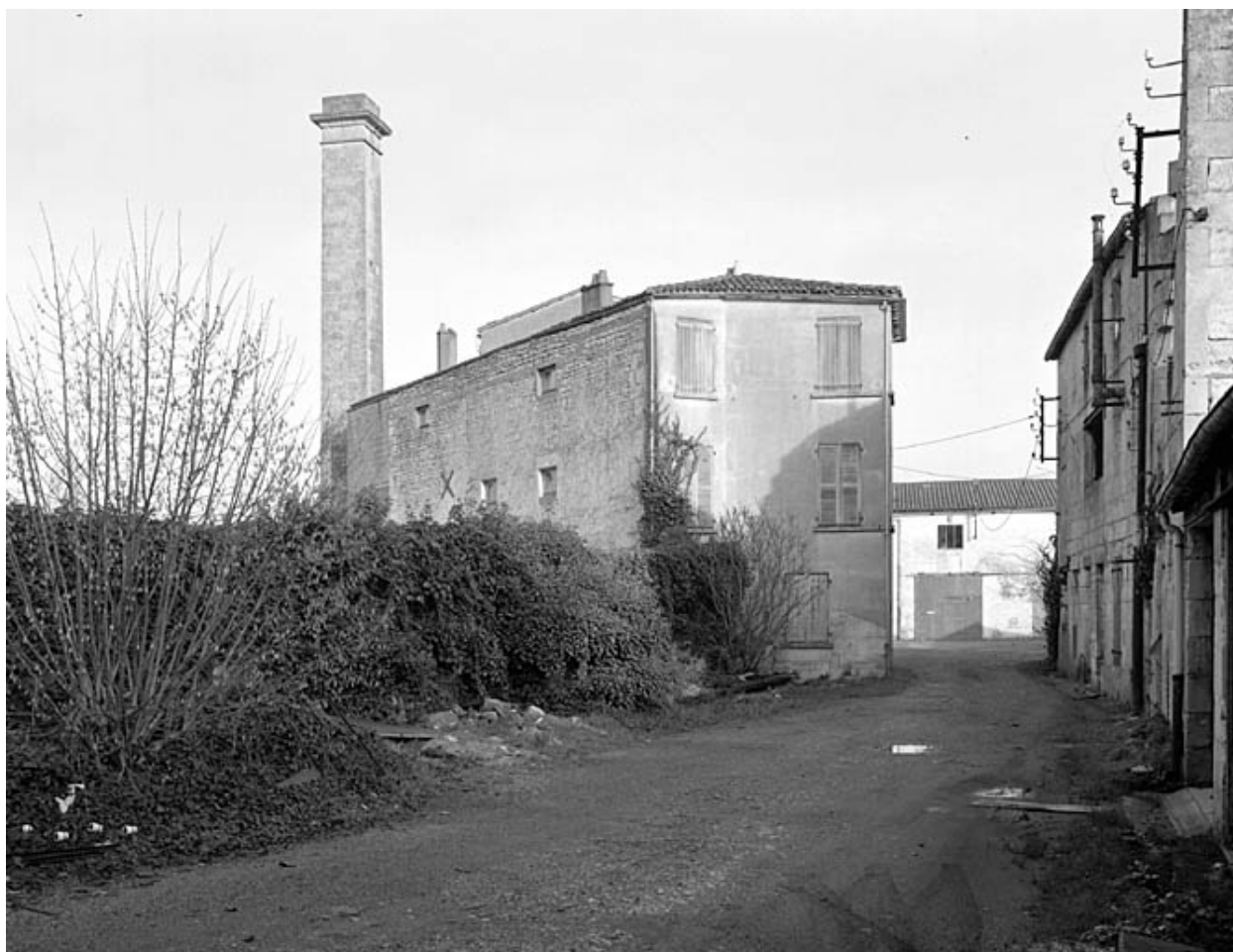
Vue générale prise du sud.