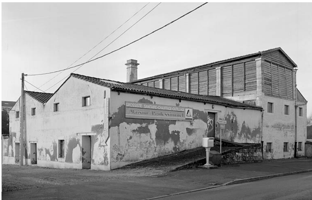
Vue générale prise du nord-est.