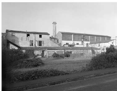
Vue générale prise de l'est.