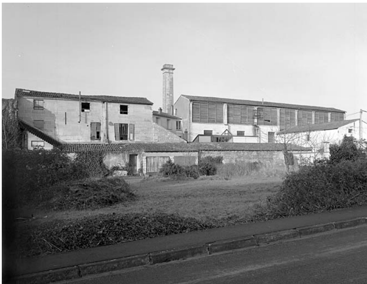
Vue générale prise de l'est.