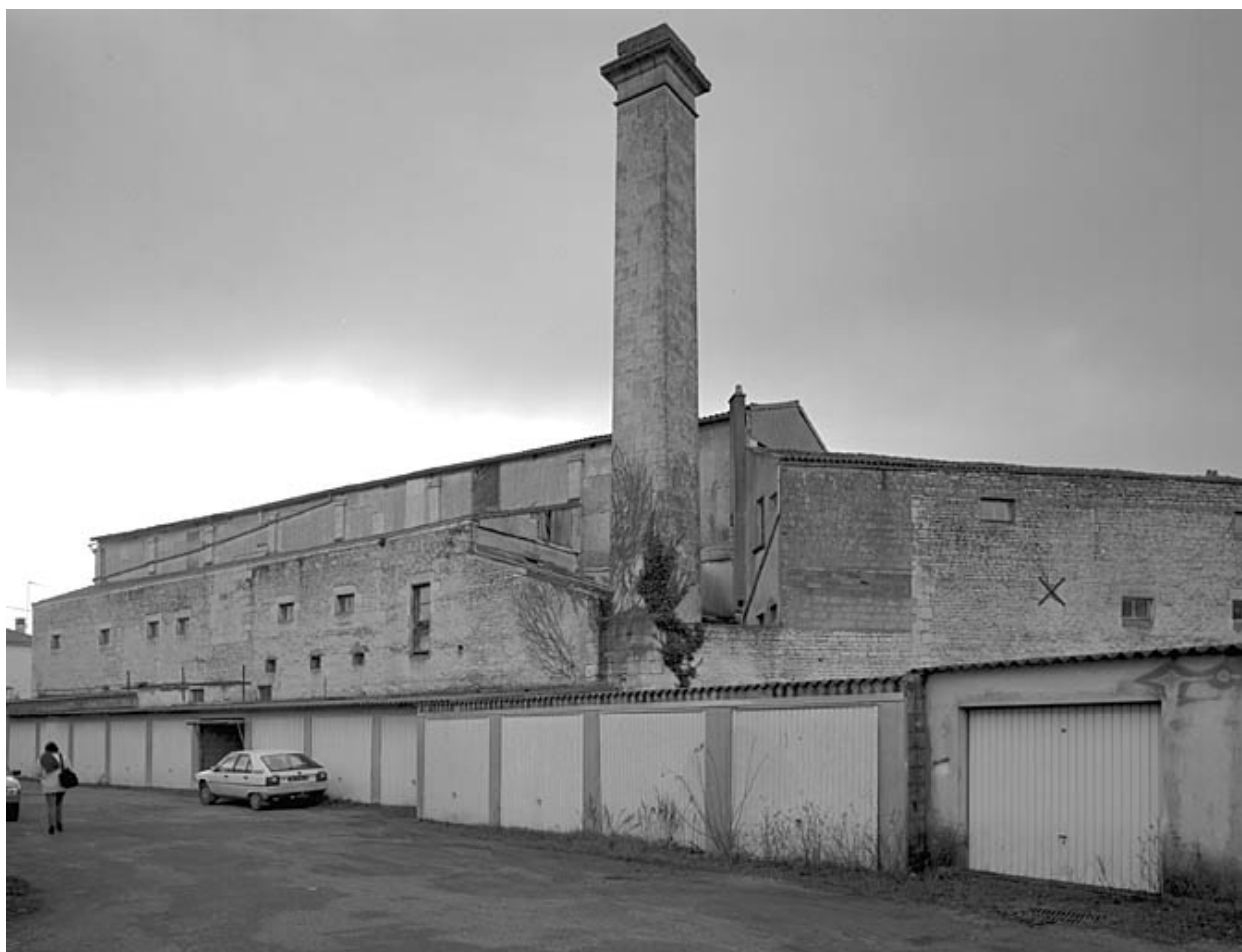
Vue générale prise du sud-ouest.