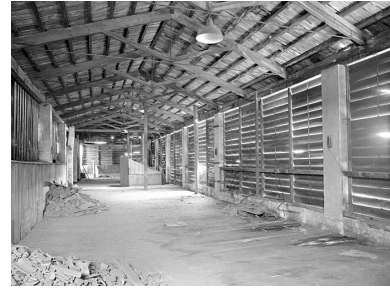
Vue intérieure du séchoir prise du sud vers le nord. IVR54_20017900098V