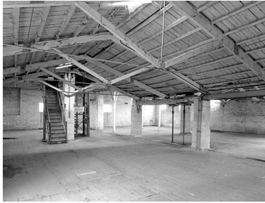
Vue intérieure du premier étage prise de l'est vers l'ouest. IVR54_20017900096V