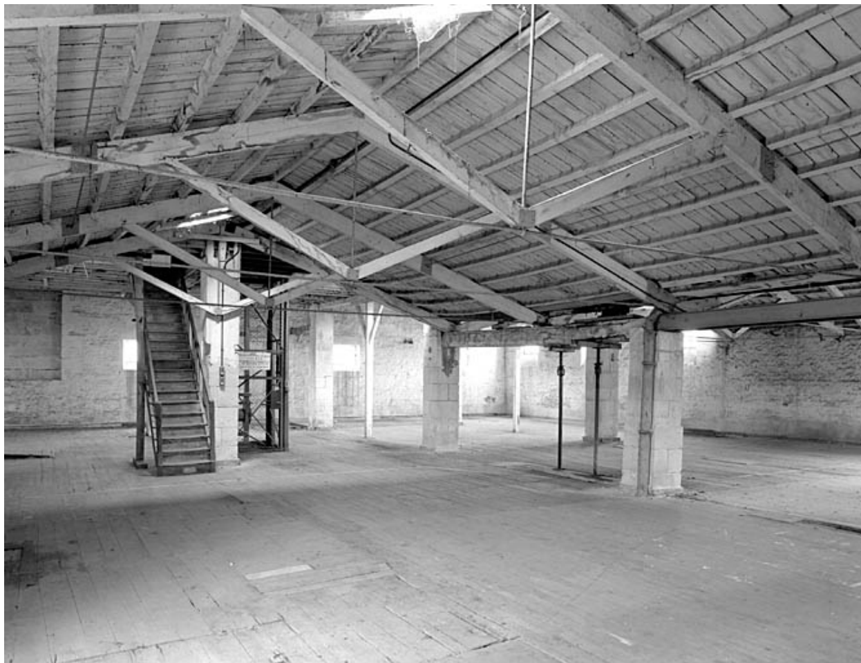
Vue intérieure du premier étage prise de l'est vers l'ouest.