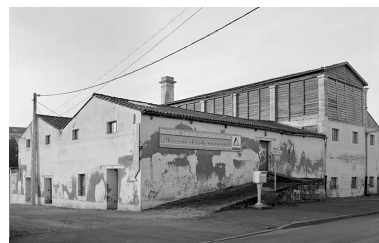
Vue générale prise du nord-est. IVR54_20017900039V