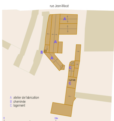
Plan masse, plan schématisé des toitures. IVR54_20047900038NUDA