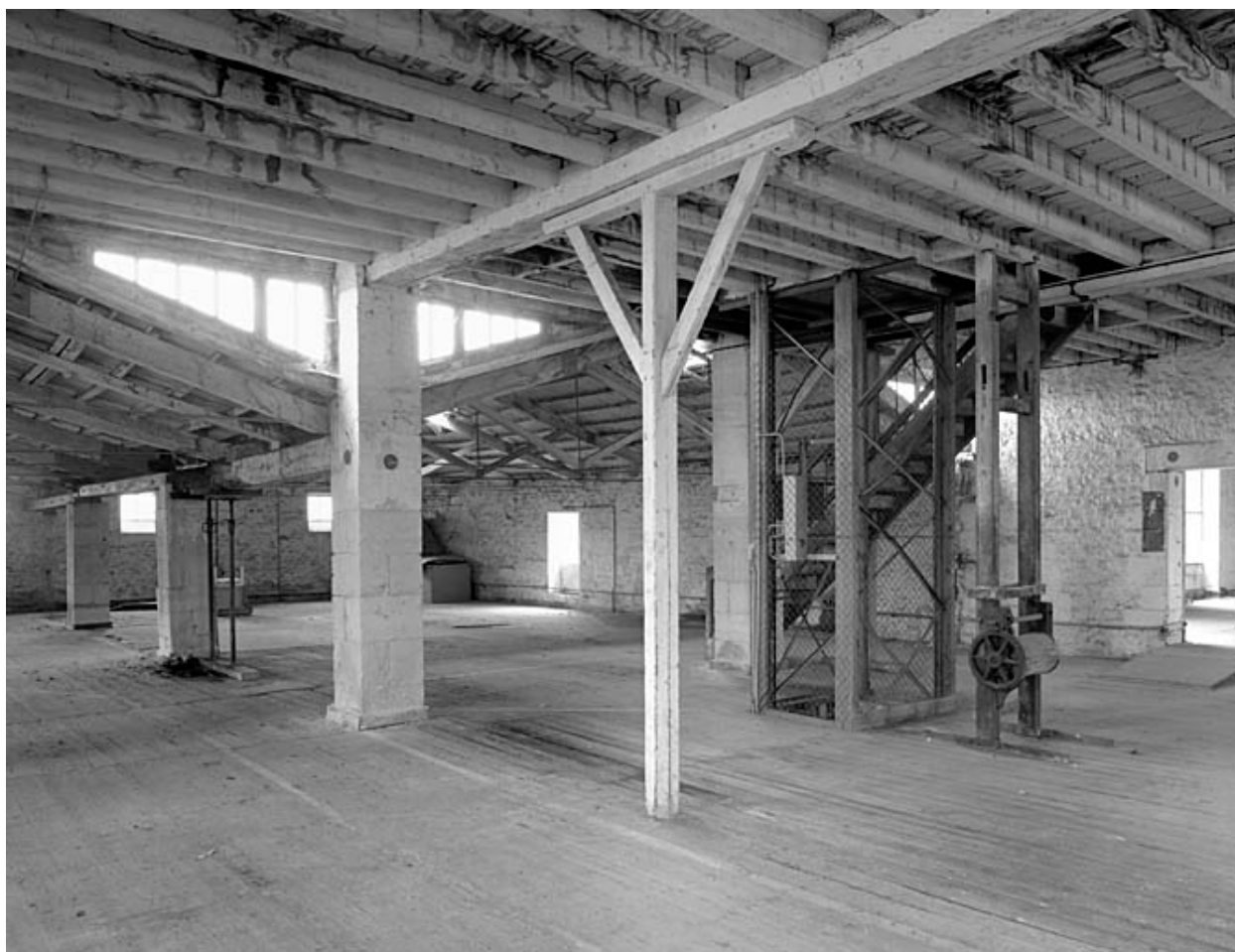
Vue intérieure du premier étage prise du nord-ouest vers le sud-est : mécanisme d'un ancien monte-charge sur la droite.