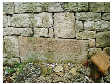
Mur de clôture est, détail du fragment de pierre tombale daté 1754 réemployé. IVR54_20027900261NUCA