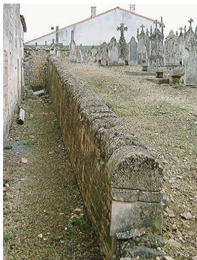
Muret de séparation entre l'église et le cimetière ; à remarquer la réutilisation des tronçons de couvercles de sarcophage en chaperon.