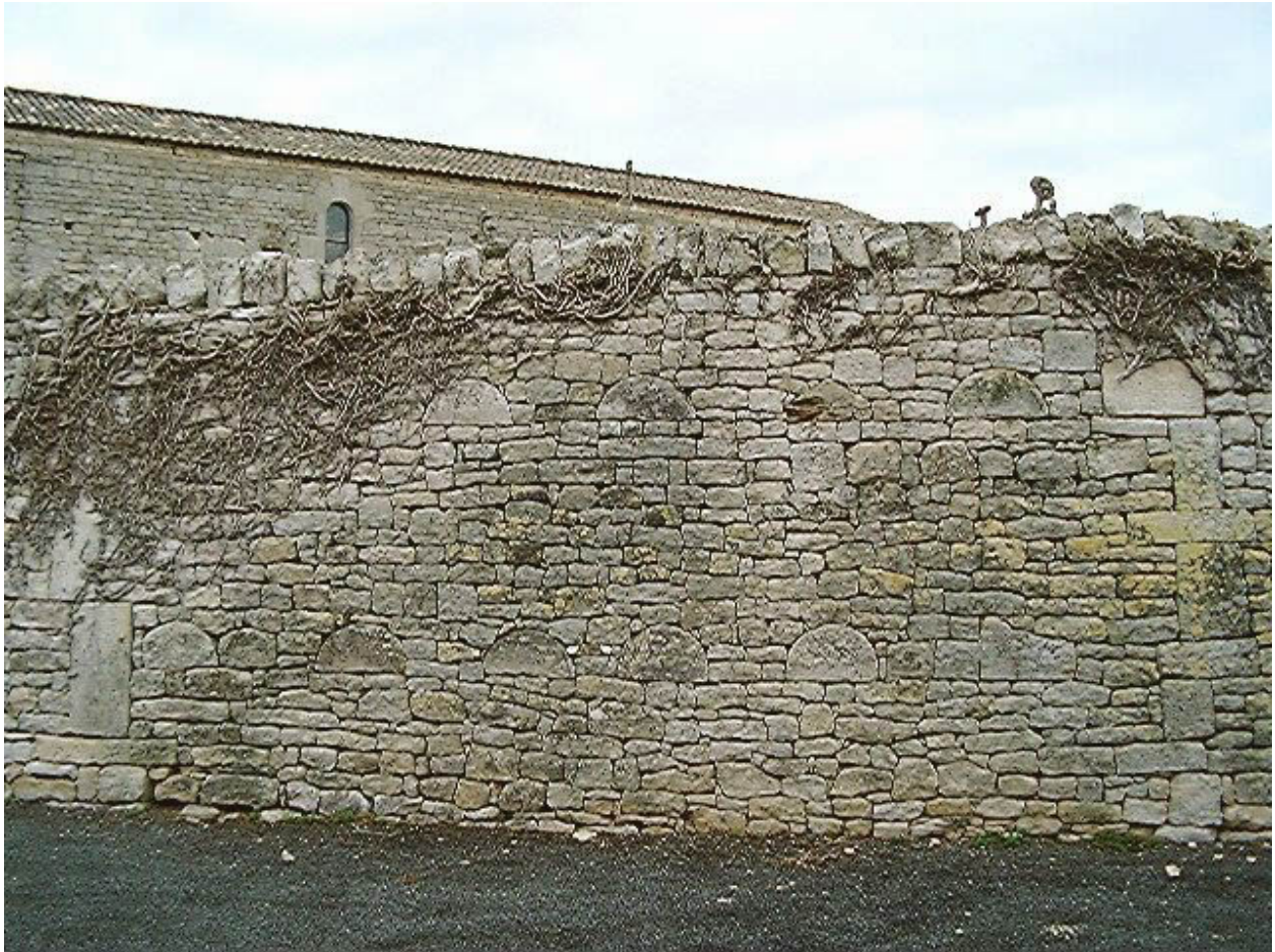
Mur de clôture sud, détail de la mise en oeuvre avec remplois de fragments de couvercles de sarcophages.