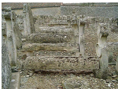
Vue d'ensemble d'une rangée de tombeaux à bâtière semi-circulaire avec stèle.