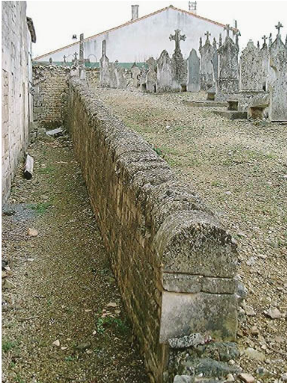
Muret de séparation entre l'église et le cimetière ; à remarquer la réutilisation des tronçons de couvercles de sarcophage en chaperon.