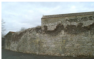
Mur de clôture sud. IVR54_20027900259NUCA