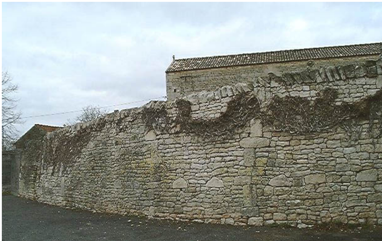
Mur de clôture sud.