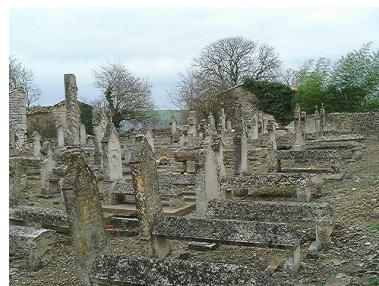
Vue d'ensemble de la partie sud prise de l'ouest vers l'est.