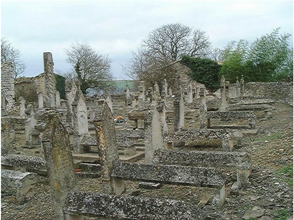
Vue d'ensemble de la partie sud prise de l'ouest vers l'est.