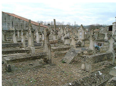
Vue d'ensemble de la partie est prise de l'ouest vers l'est. IVR54_20027900265NUCA