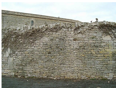
Mur de clôture sud, détail de la mise en oeuvre avec remplois de fragments de couvercles de sarcophages.