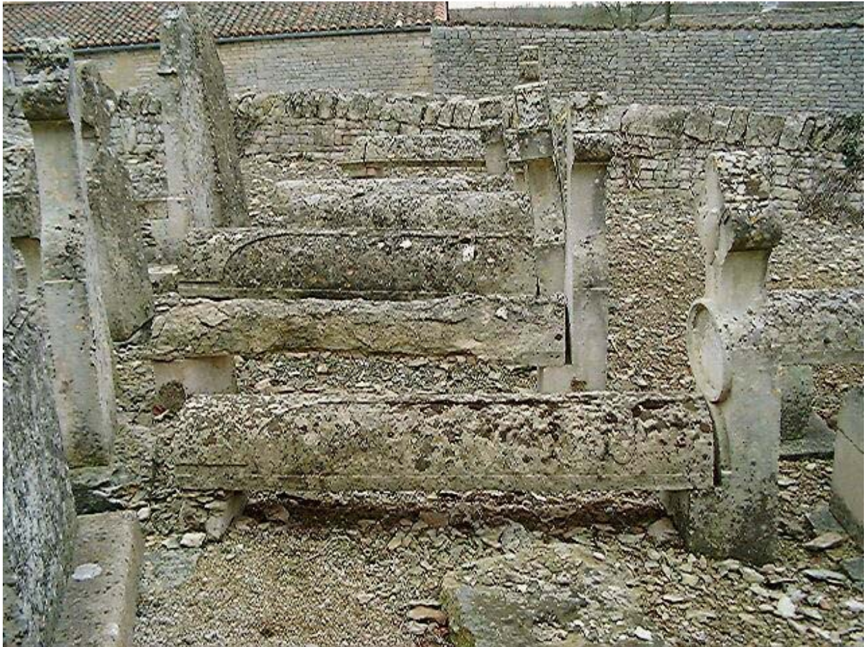
Vue d'ensemble d'une rangée de tombeaux à bâtière semi-circulaire avec stèle.