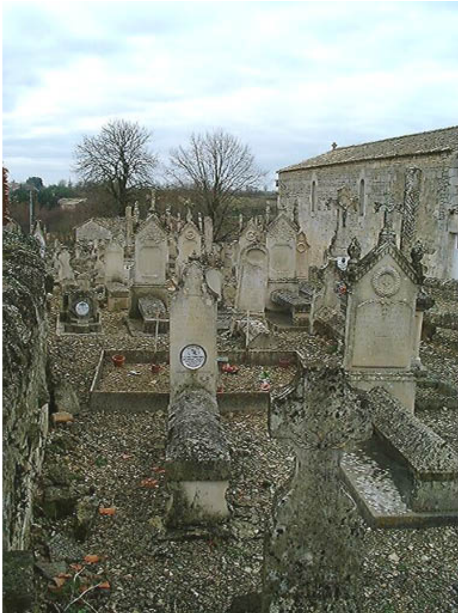
Vue d'ensemble de la partie est prise du sud vers le nord (entrée).