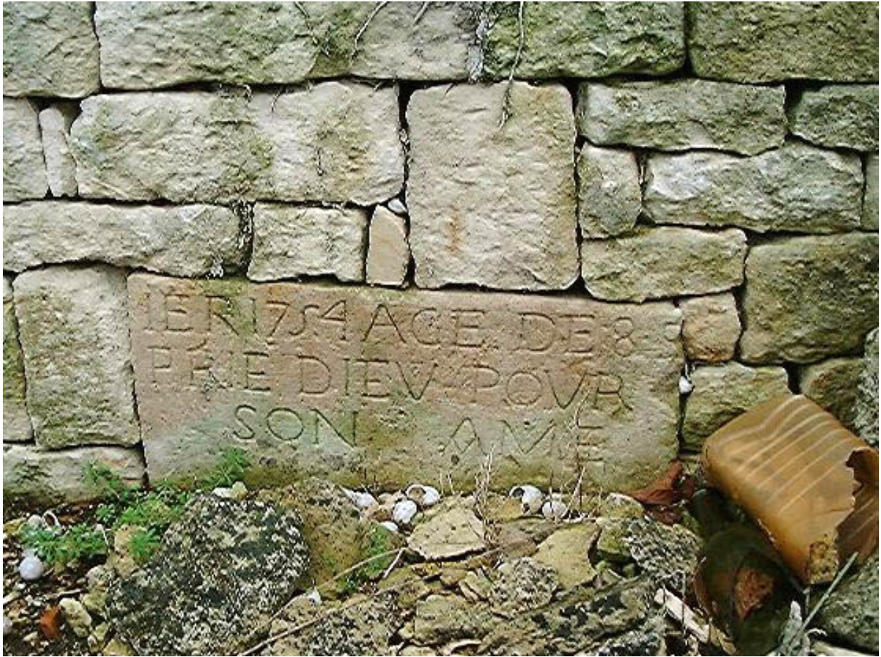
Mur de clôture est, détail du fragment de pierre tombale daté 1754 réemployé.