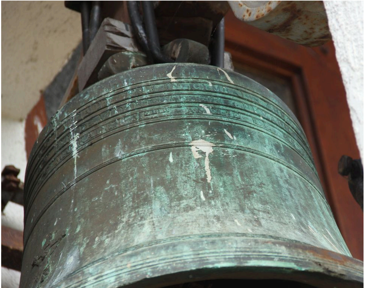
Détail de la dédicace sur le vase supérieur.