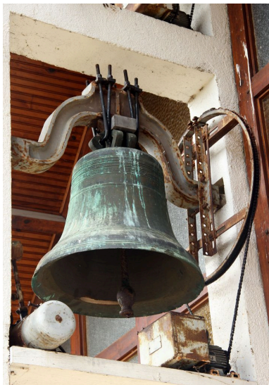
Ensemble. IVR72_20184000724NUC2A