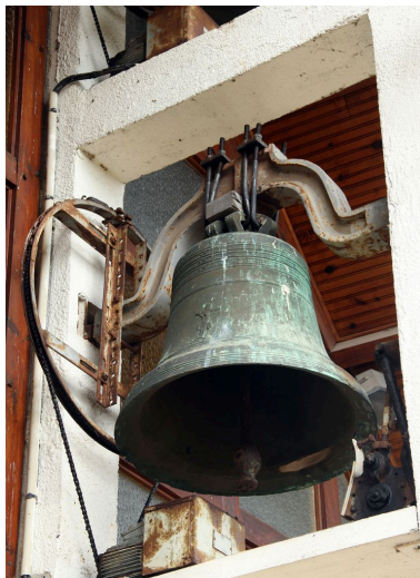
Ensemble. IVR72_20184000725NUC2A