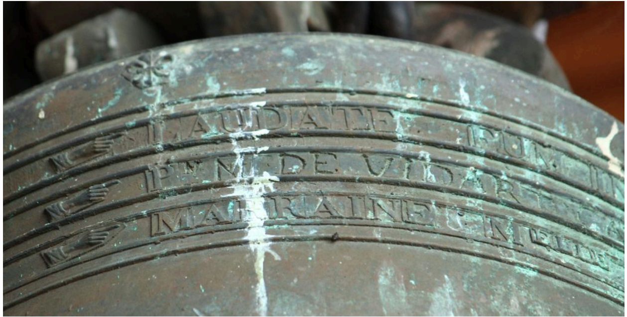
Détail de la dédicace sur le vase supérieur.