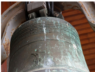
Détail de la dédicace sur le vase supérieur. IVR72_20184000727NUC2A