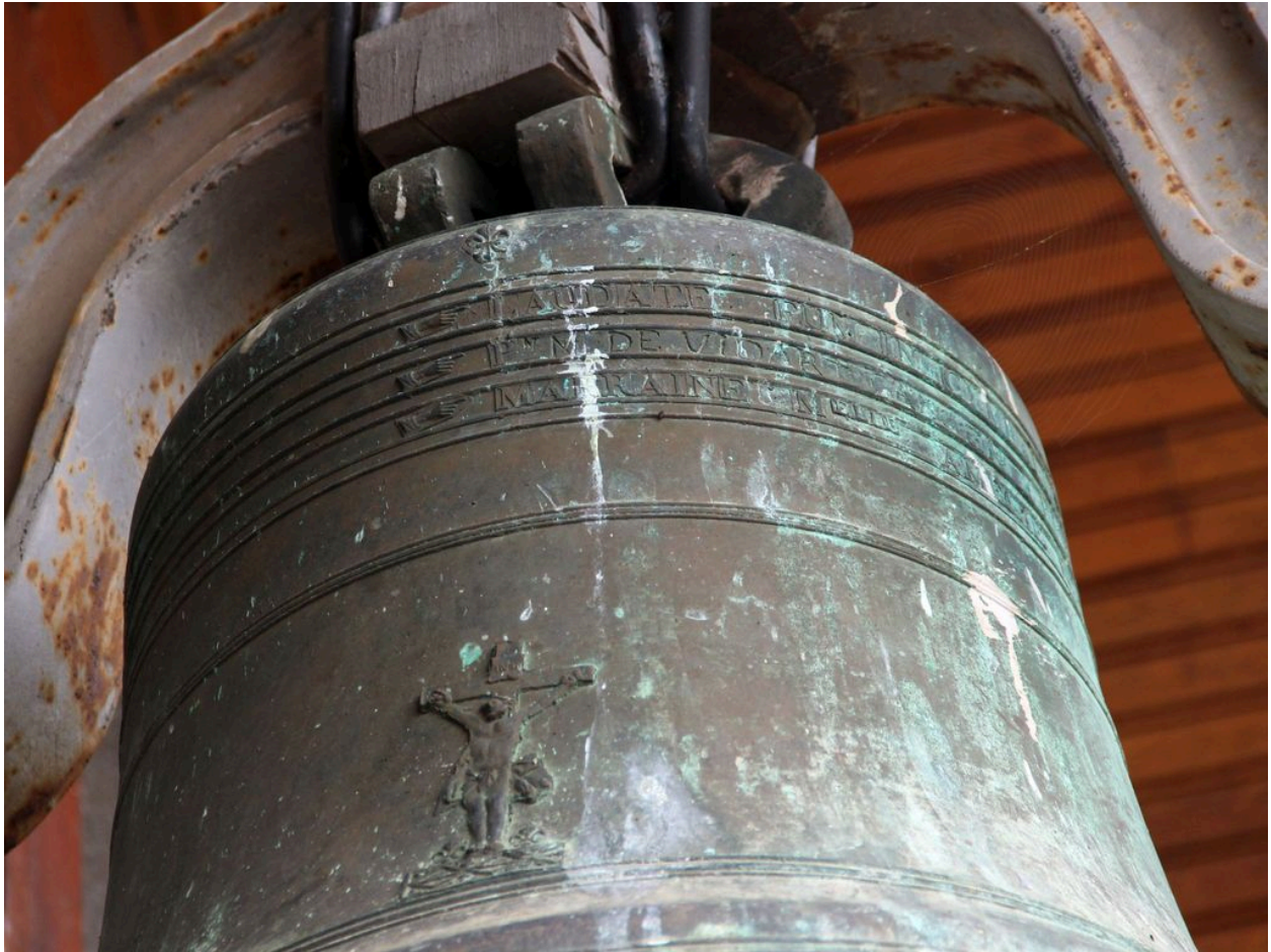
Détail de la dédicace sur le vase supérieur.