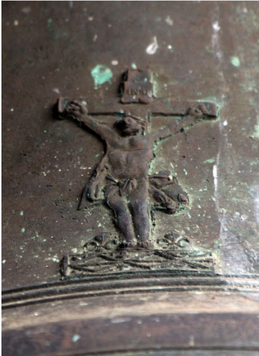
Détail : Christ en croix sur le vase.