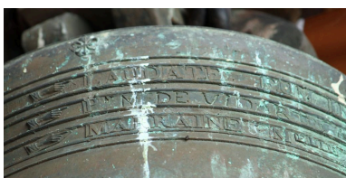
Détail de la dédicace sur le vase supérieur. IVR72_20184000730NUC2A