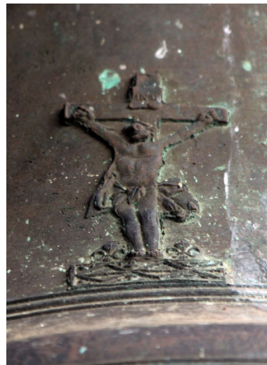
Détail : Christ en croix sur le vase. IVR72_20184000726NUC2A