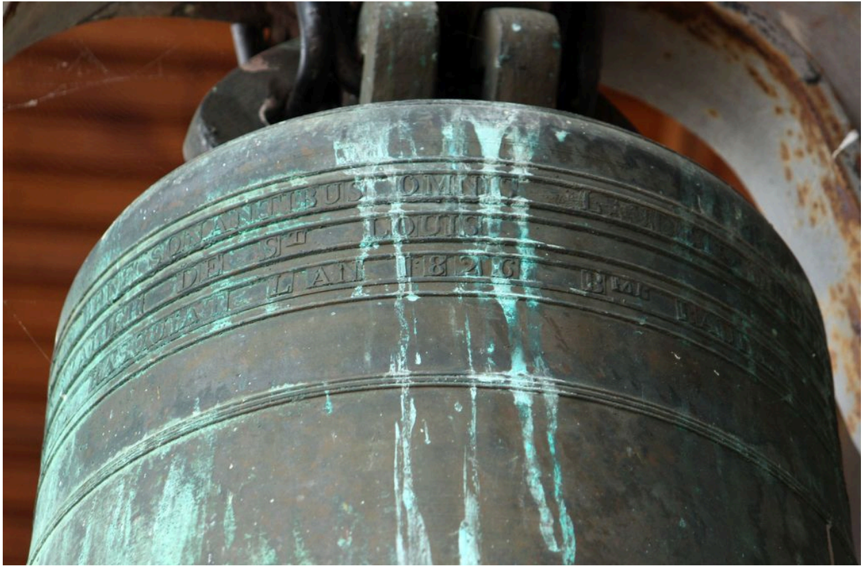
Détail de la dédicace sur le vase supérieur.