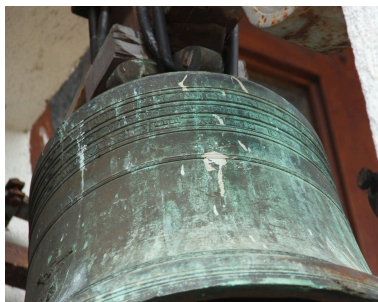
Détail de la dédicace sur le vase supérieur.