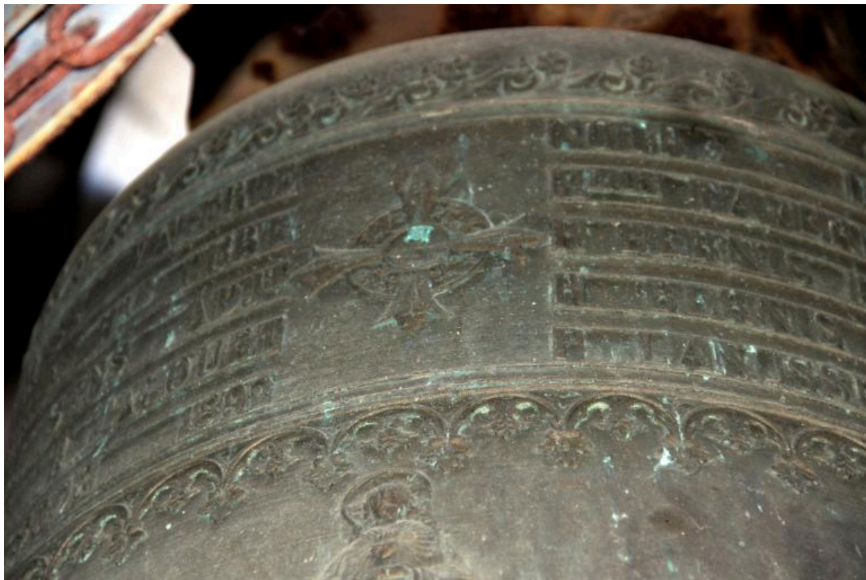
Détail de la marque du fondeur au milieu de la dédicace.