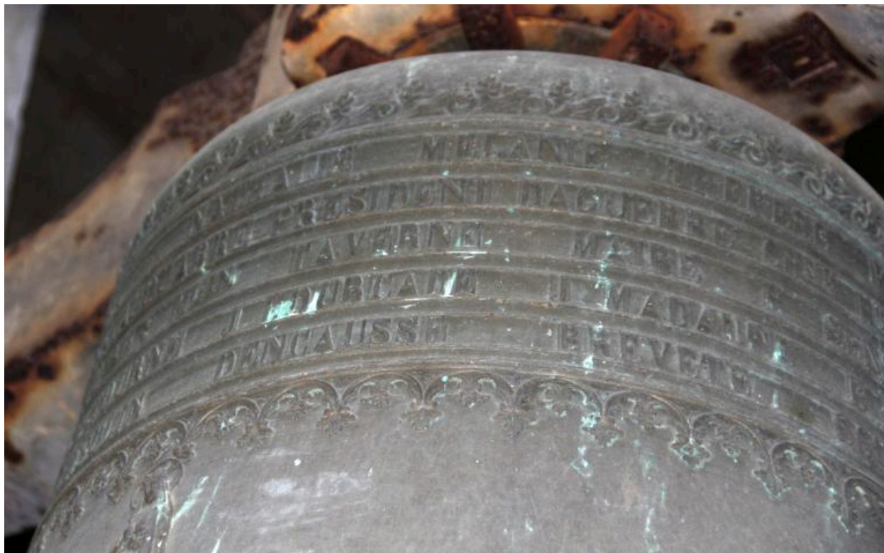
Détail de la dédicace sur le vase supérieur.