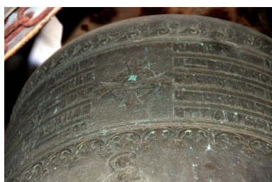
Détail de la marque du fondeur au milieu de la dédicace.