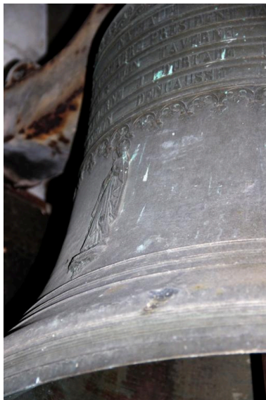
Détail de l'effigie de la Vierge sur le vase. IVR72_20196401040NUC2A