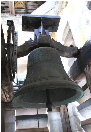
Ensemble. IVR72_20196401036NUC2A