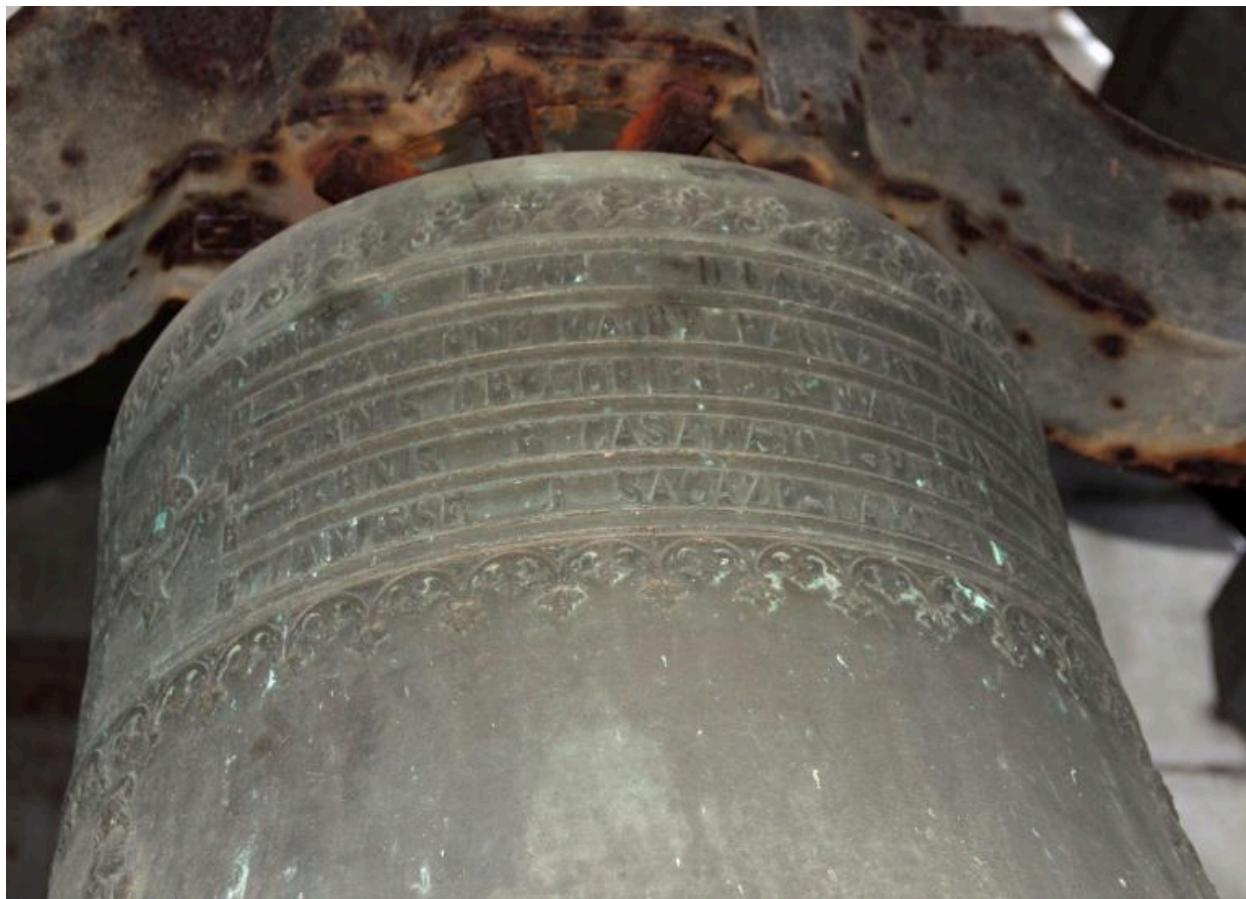
Détail de la dédicace sur le vase supérieur.