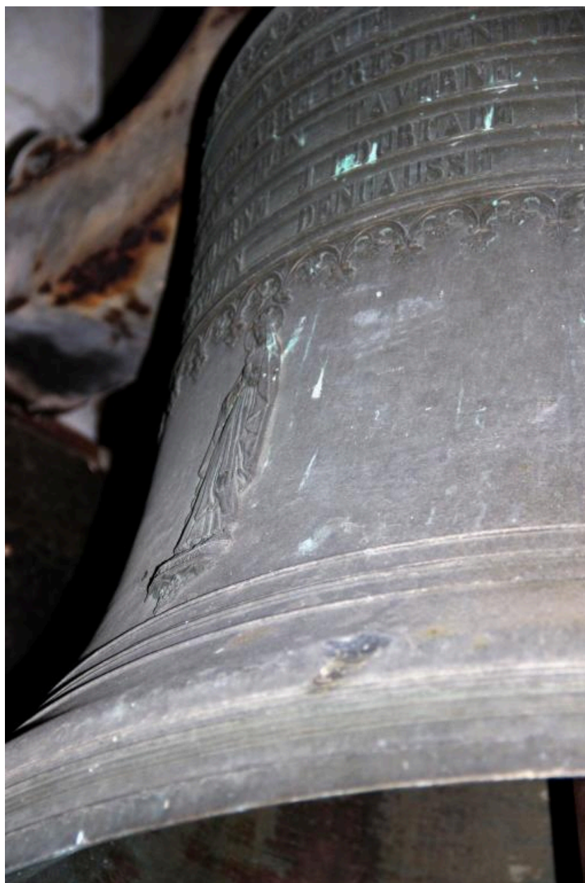
Détail de l'effigie de la Vierge sur le vase.