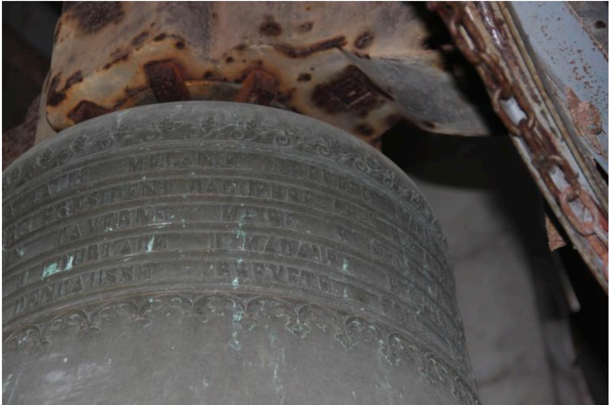
Détail de la dédicace sur le vase supérieur.