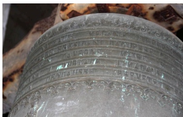
Détail de la dédicace sur le vase supérieur.