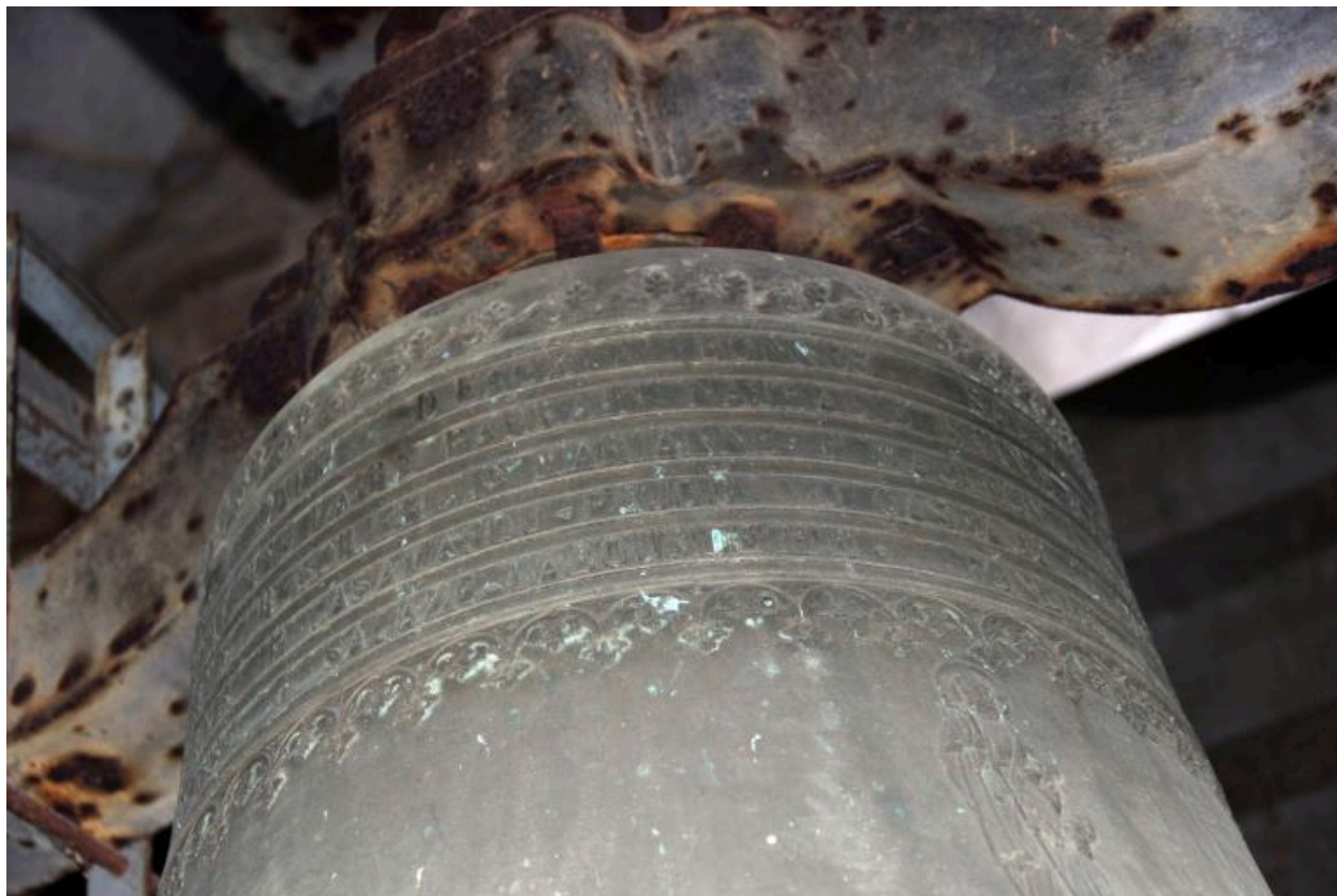
Détail de la dédicace sur le vase supérieur.