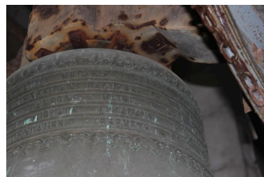
Détail de la dédicace sur le vase supérieur. IVR72_20196401041NUC2A