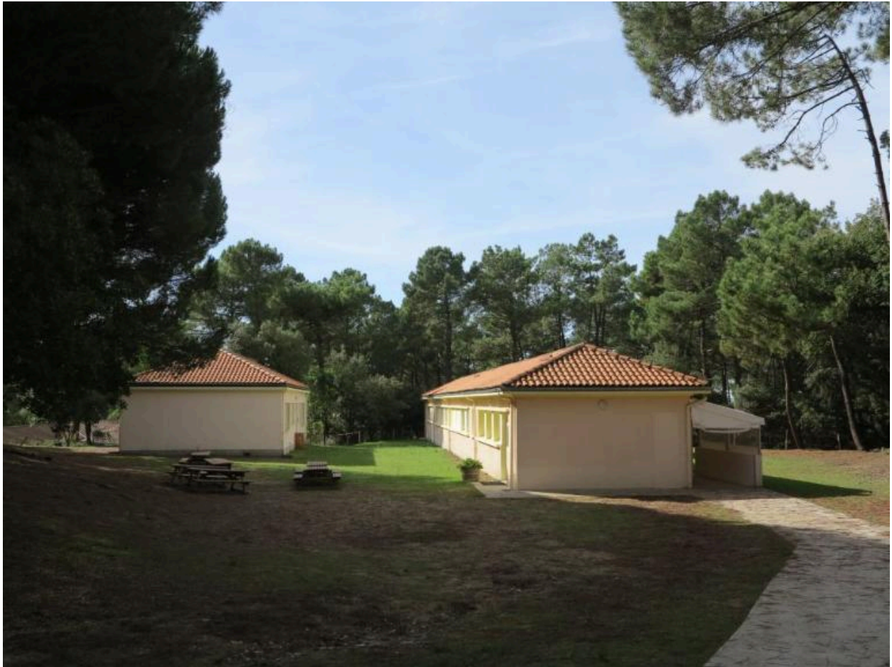
Deux blocs de dortoirs.