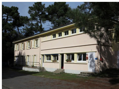
Le bâtiment qui regroupait la buanderie, à droite, et les logements du personnel, à gauche.