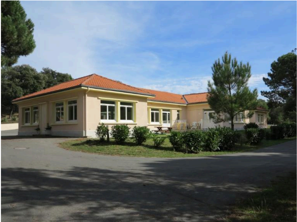
Le réfectoire vu depuis l'ouest.