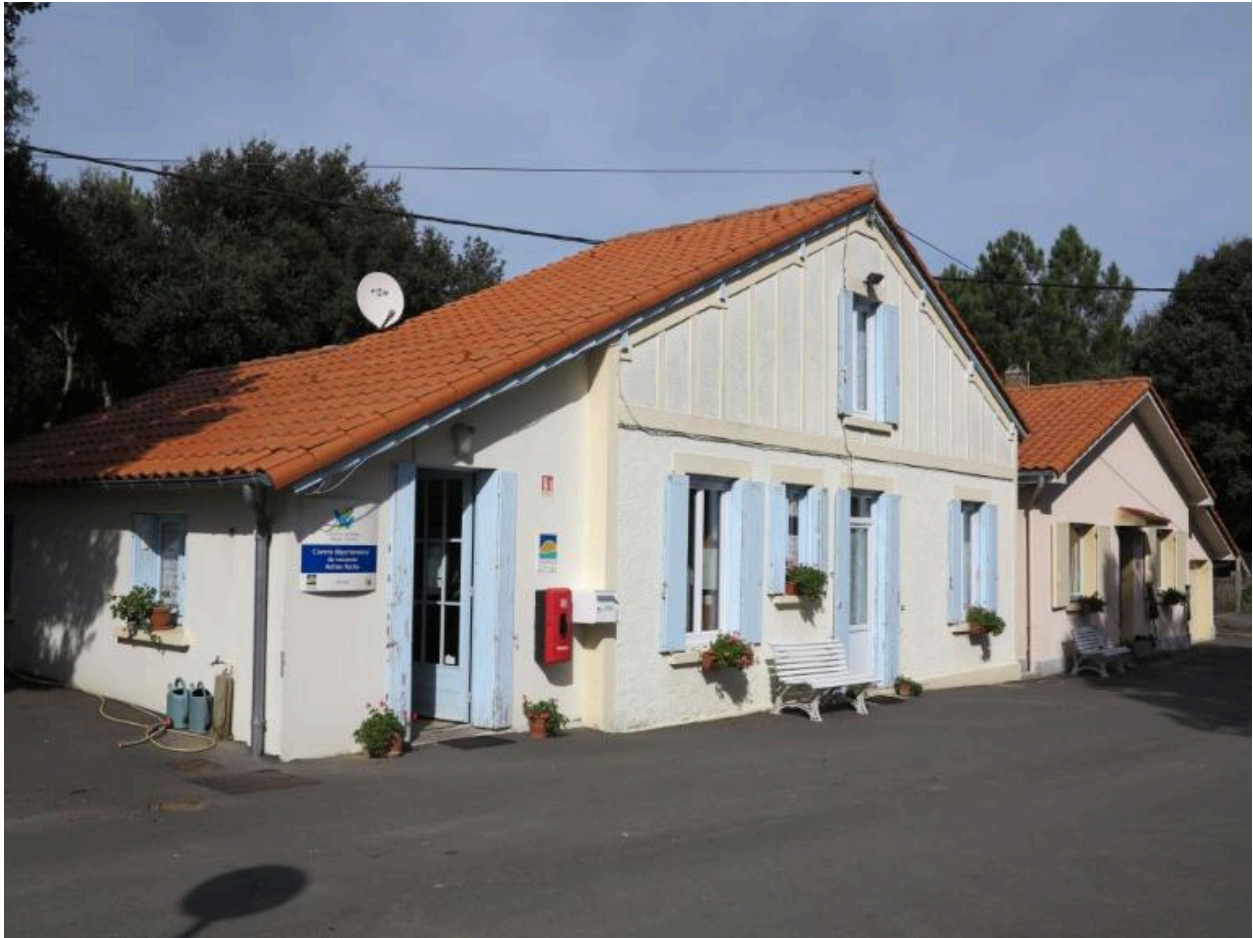
Le logement de gardien, bâtiment d'accueil.