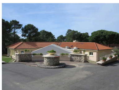
Le bâtiment des cuisines et du réfectoire vu depuis l'est.