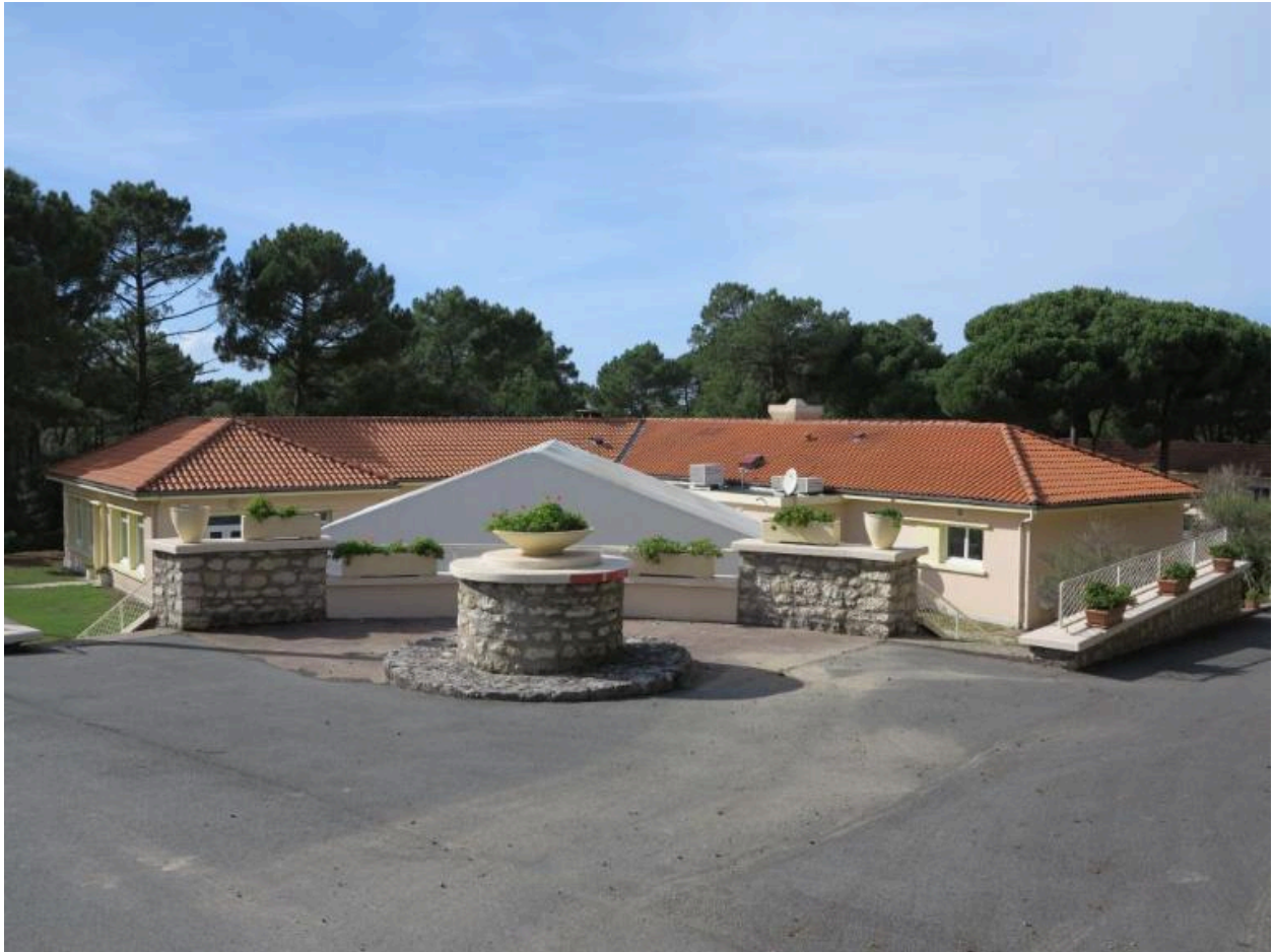
Le bâtiment des cuisines et du réfectoire vu depuis l'est.