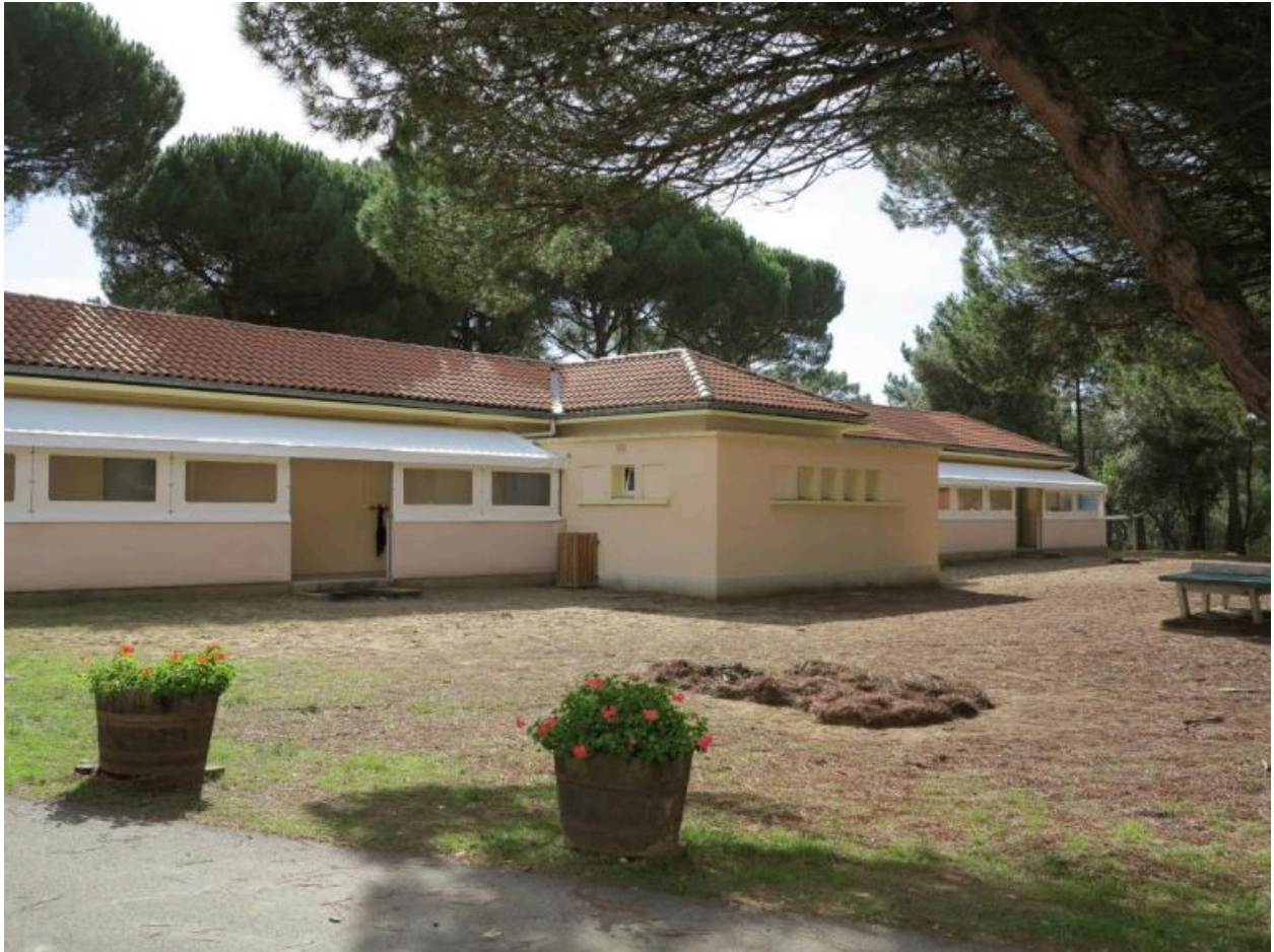
Un des blocs de dortoirs, côté sanitaires.