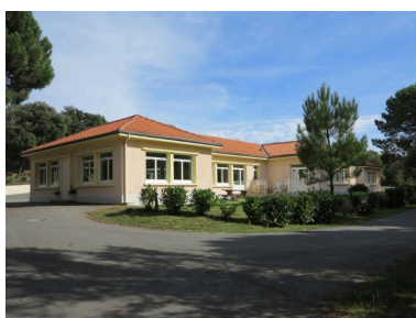
Le réfectoire vu depuis l'ouest.