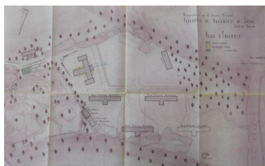
Plan d'ensemble du centre de vacances en 1966. IVR54_20141706811NUCA