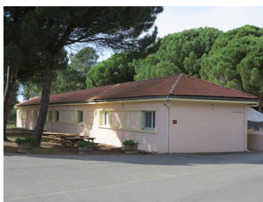
Un des blocs de dortoirs.