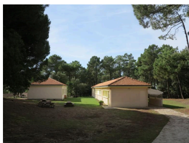
Deux blocs de dortoirs.