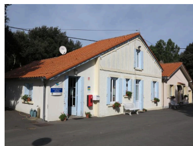
Le logement de gardien, bâtiment d'accueil.