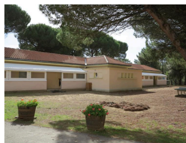
Un des blocs de dortoirs, côté sanitaires.