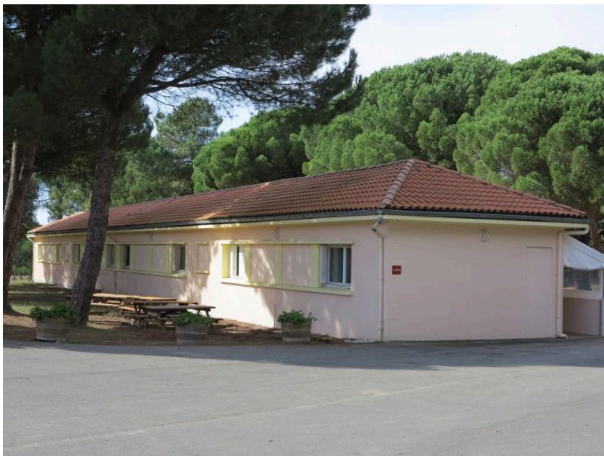
Un des blocs de dortoirs.