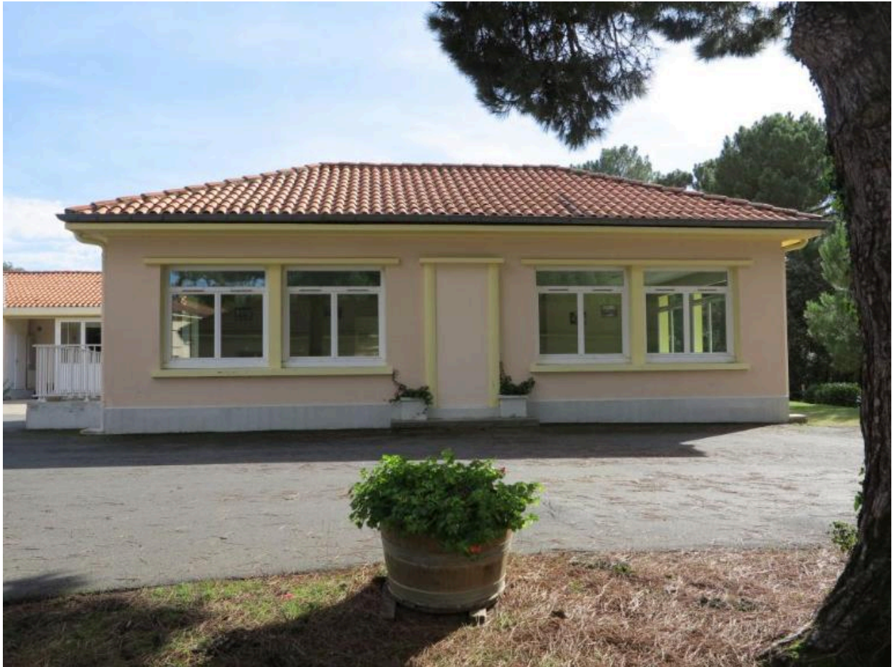
Partie nord du réfectoire.