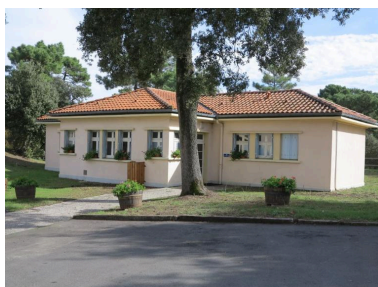
L'ancienne infirmerie.