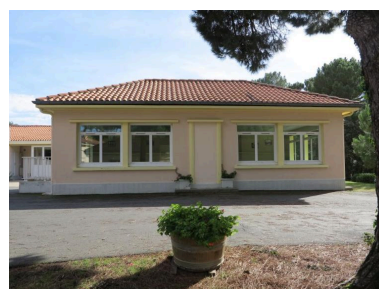
Partie nord du réfectoire. IVR54_20141706098NUCA