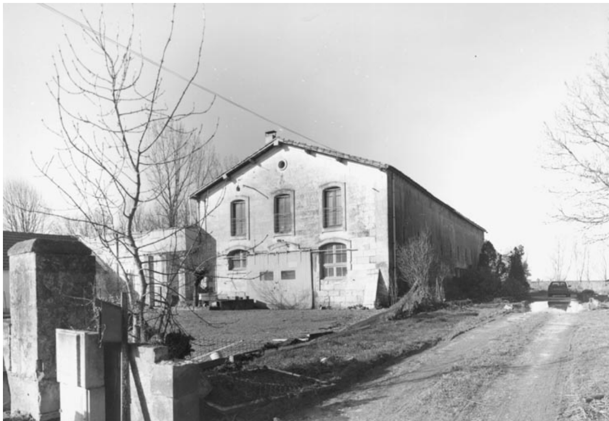
Vue d'ensemble prise de la route.