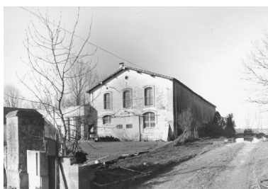
Vue d'ensemble prise de la route.