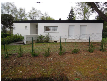
Façade d'entrée IVR72_20146400070NUC2A