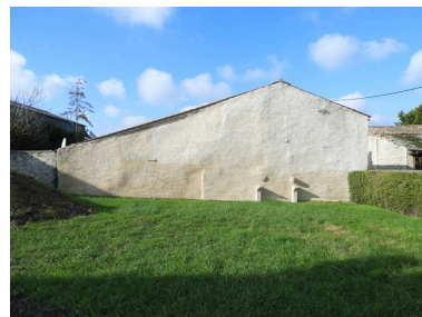
Vestiges d'habitation (cheminée) sur le côté ouest de la cour, vus depuis l'est. IVR75_20201701670NUCA