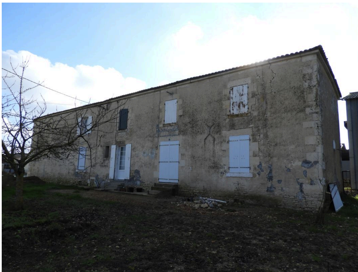
Le logis vu depuis le nord.