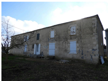
Le logis vu depuis le nord.