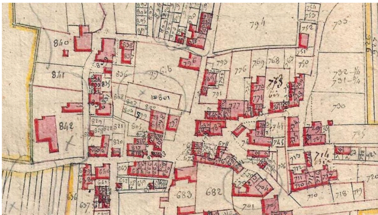
La parcelle 683, en bas, sur le plan cadastral de 1811.