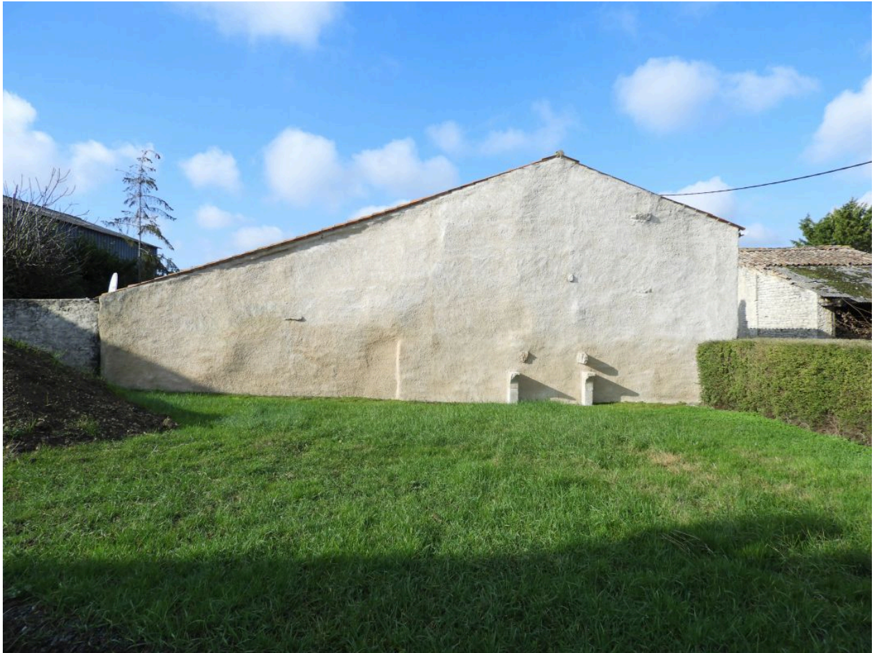
Vestiges d'habitation (cheminée) sur le côté ouest de la cour, vus depuis l'est.