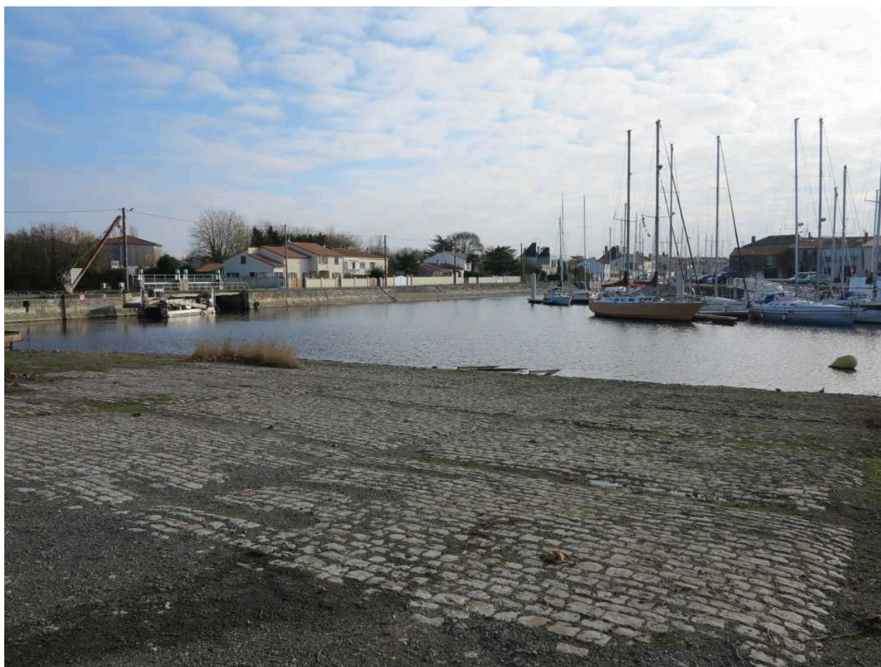
La partie sud-ouest de la cale, empierrée.