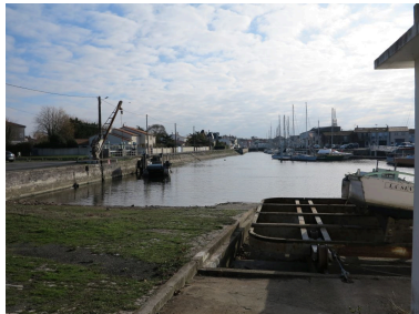
La partie nord-est de la cale, empierrée, et le grill de carénage.