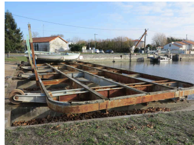
Le grill mobile au centre de la cale.