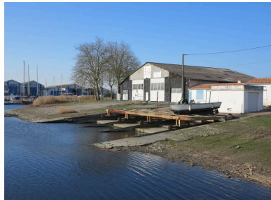
La cale vue depuis l'est. IVR54_20171705210NUCA