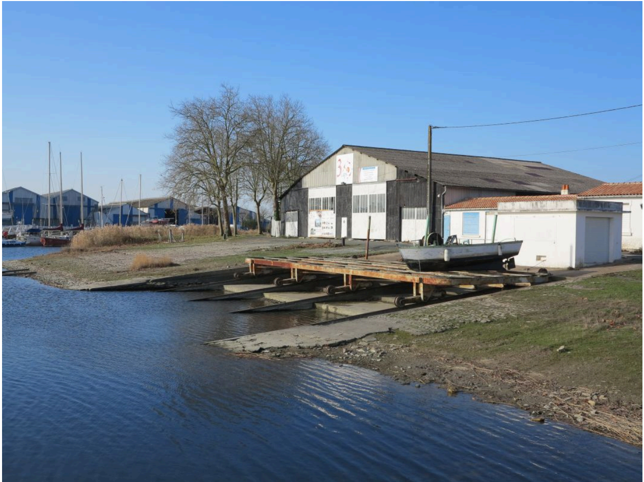
La cale vue depuis l'est.