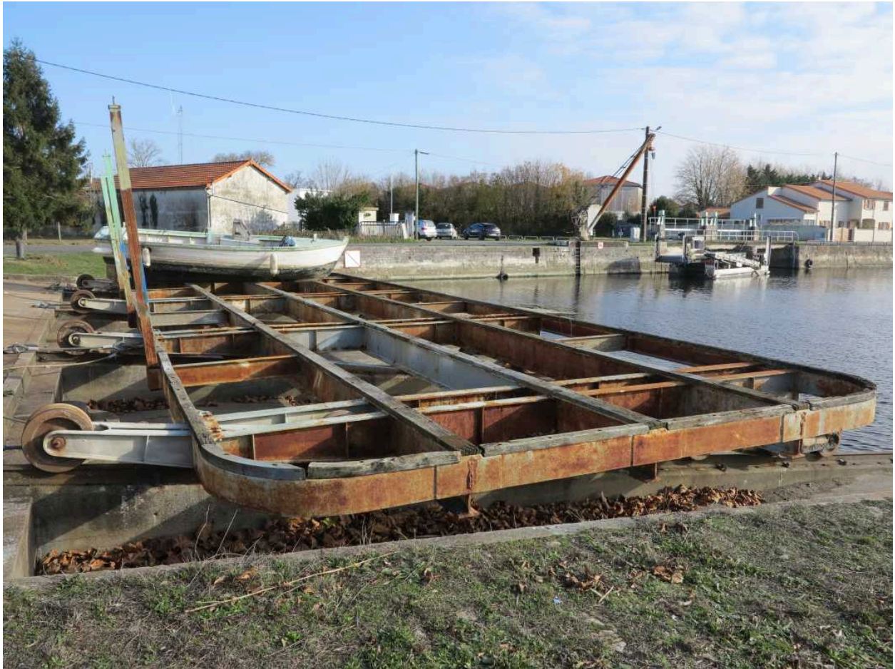
Le gril mobile au centre de la cale.