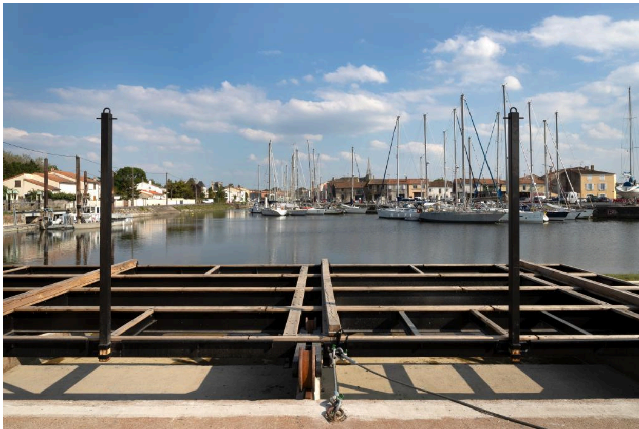
La cale vue depuis le nord-ouest.