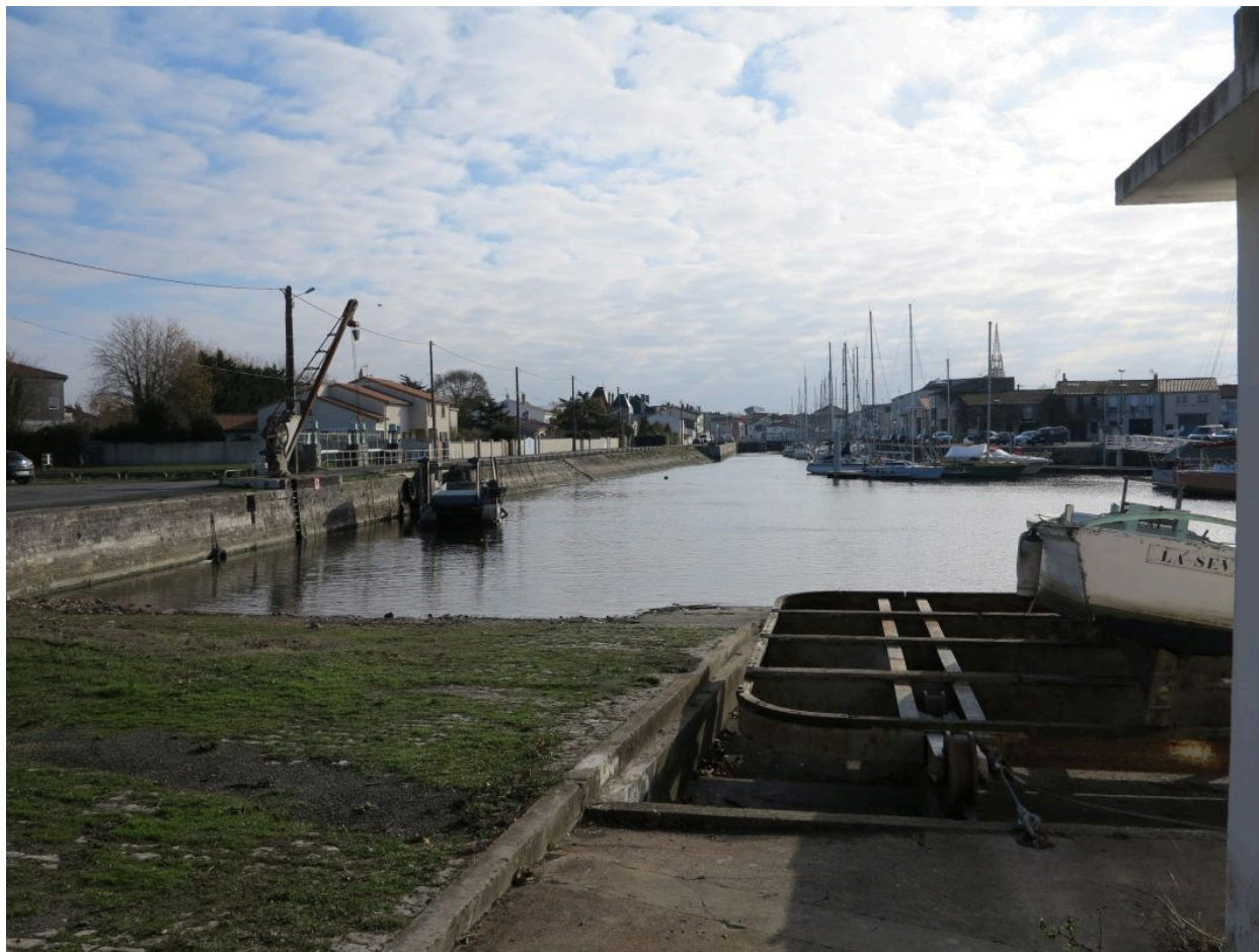
La partie nord-est de la cale, empierrée, et le gril de carénage.