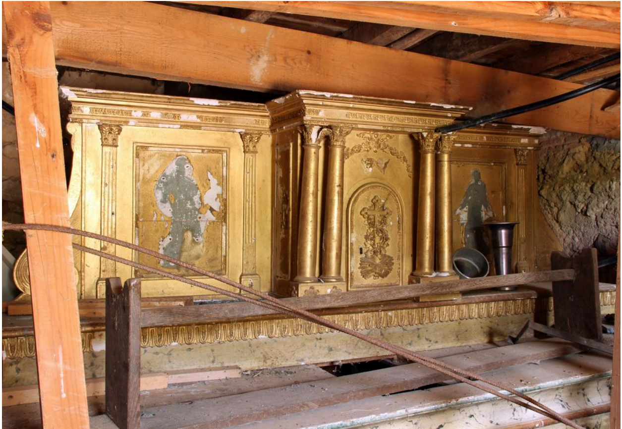
Gradin et tabernacle (état actuel).