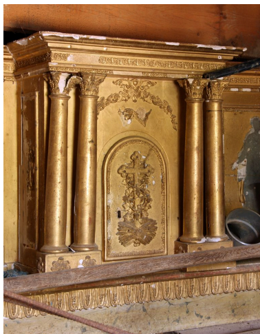
Armoire eucharistique du tabernacle (état actuel).