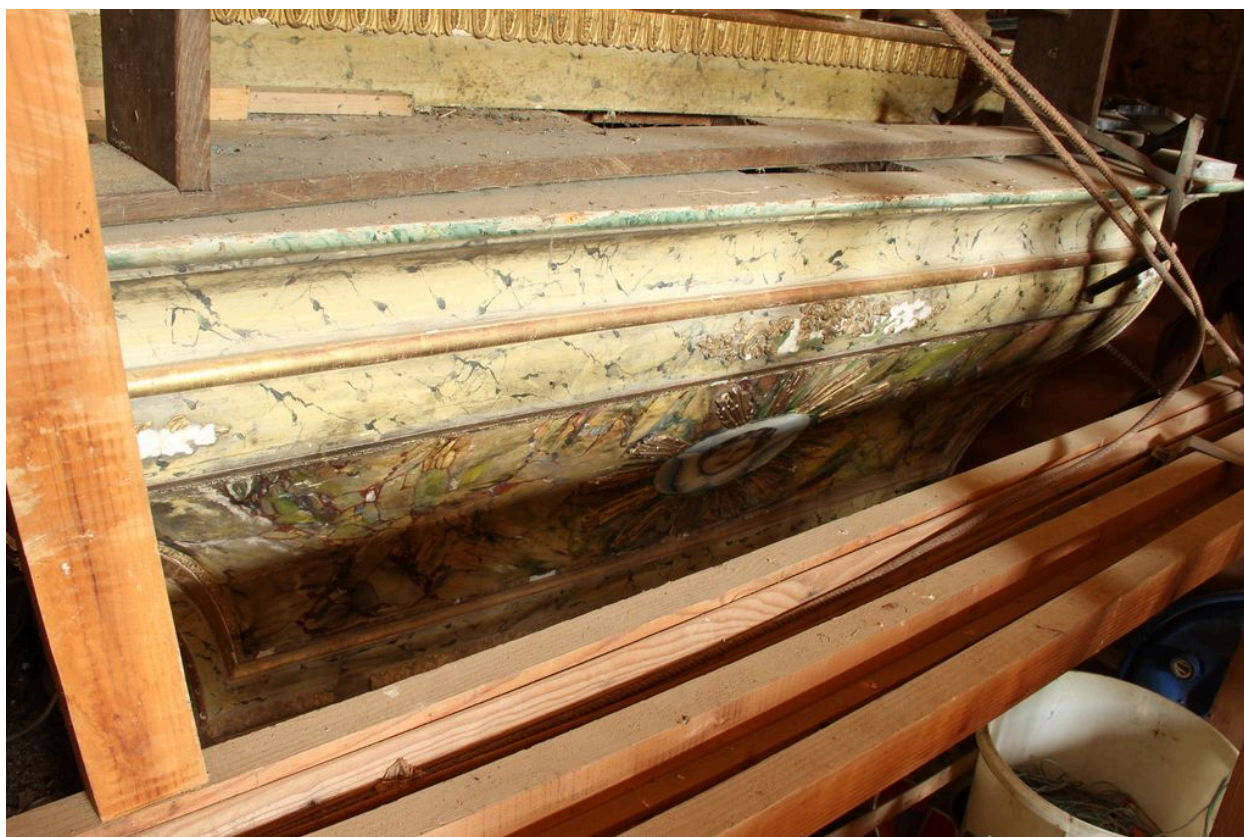
Tombeau d'autel (état actuel).