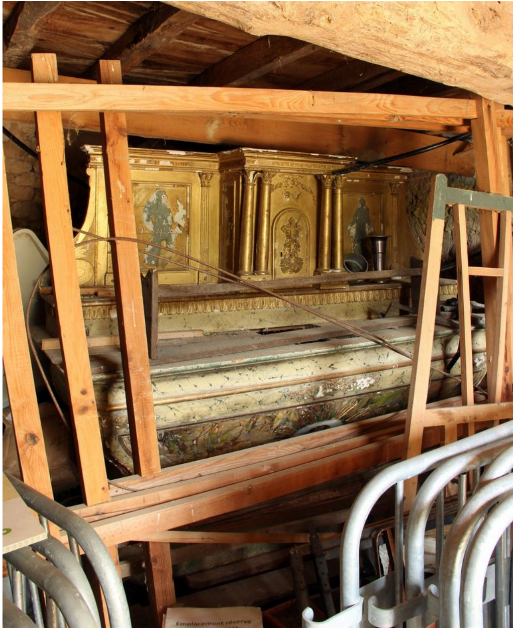
Ensemble (état actuel).