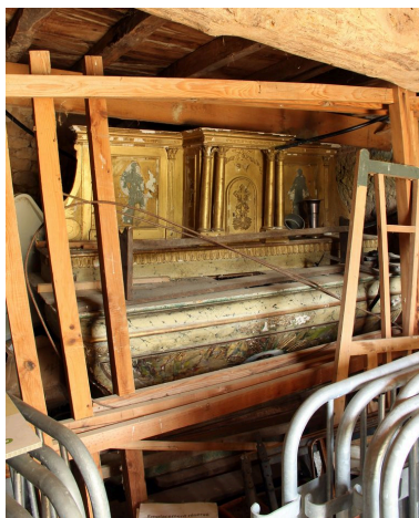
Ensemble (état actuel).