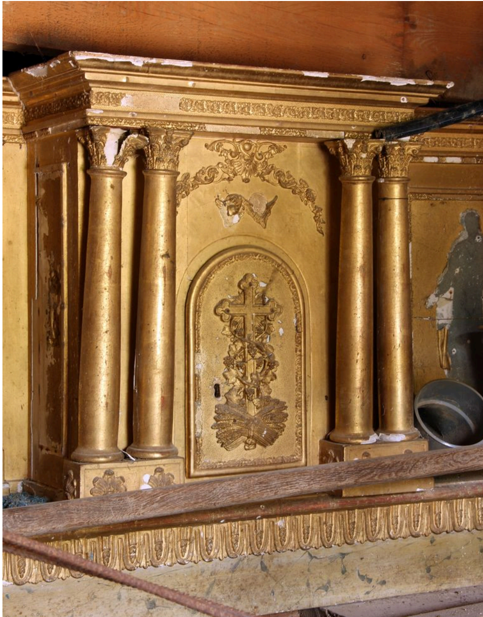
Armoire eucharistique du tabernacle (état actuel).