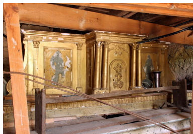
Gradin et tabernacle (état actuel).