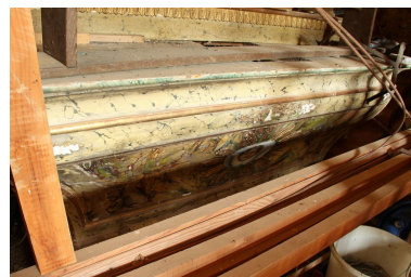
Tombeau d'autel (état actuel). IVR72_20174000114NUC2A