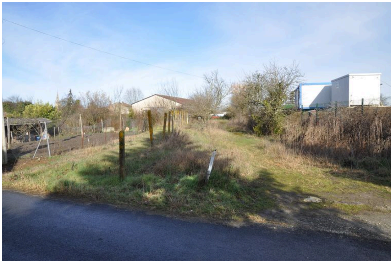
Vestiges au Bois du tracé de la voie ferrée Saint-André-de-Cubzac Saint-Ciers-sur-Gironde, vers le nord.