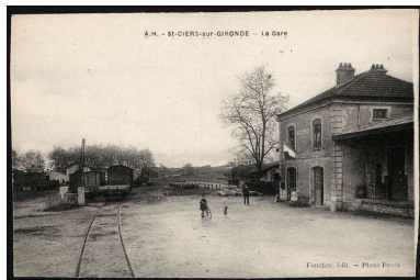
La gare : wagons sur les rails. Carte postale, début 20e siècle.