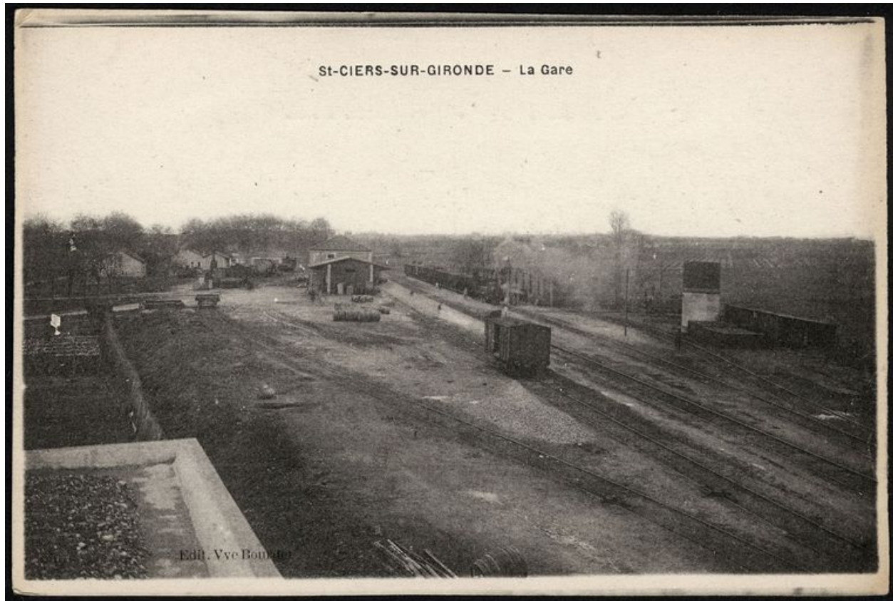
La gare, vue générale. Carte postale, début 20e siècle.