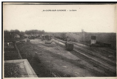
La gare, vue générale. Carte postale, début 20e siècle.