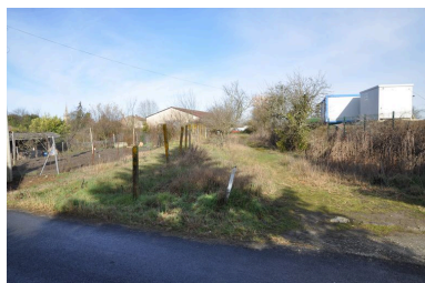
Vestiges au Bois du tracé de la voie ferrée Saint-André-de-Cubzac Saint- Ciers-sur-Gironde, vers le nord. IVR72_20113304687NUCA