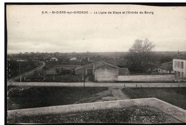
La ligne de chemin de fer, à l'entrée du bourg. Carte postale, début 20e siècle. IVR72_20113304663NUC