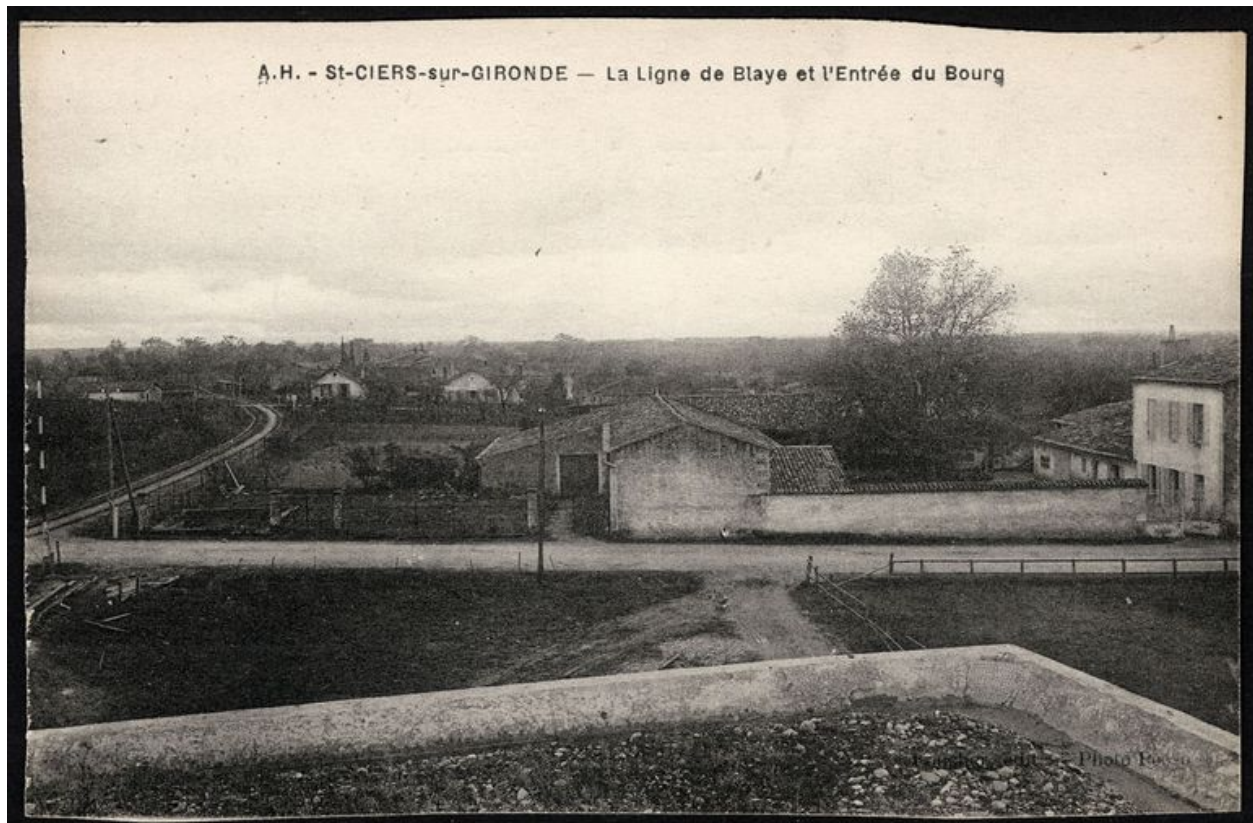
La ligne de chemin de fer, à l'entrée du bourg. Carte postale, début 20e siècle.