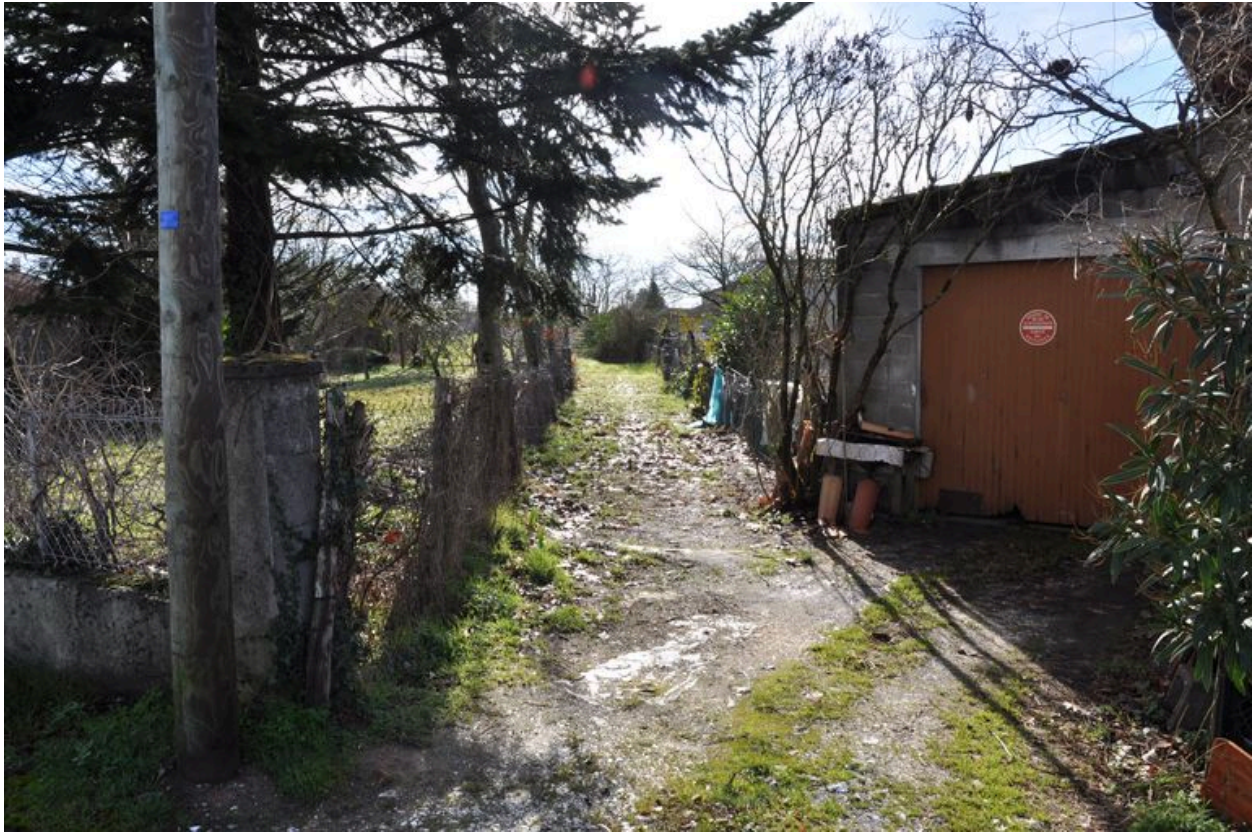
Vestiges au Bois du tracé de la voie ferrée Saint-André-de-Cubzac Saint-Ciers-sur-Gironde, vers le sud.