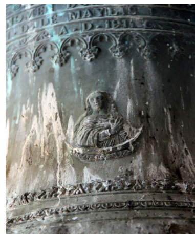
Détail du vase : buste de l'Immaculée Conception.

IVR72_20174000136NUC2A