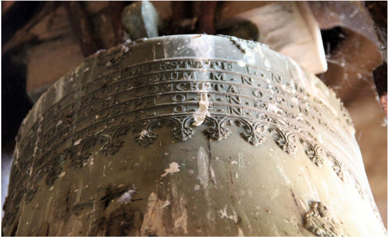
Détail de la dédicace sur le vase supérieur.