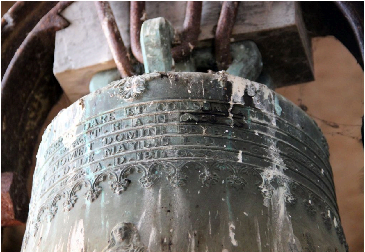
Détail de la dédicace sur le vase supérieur.