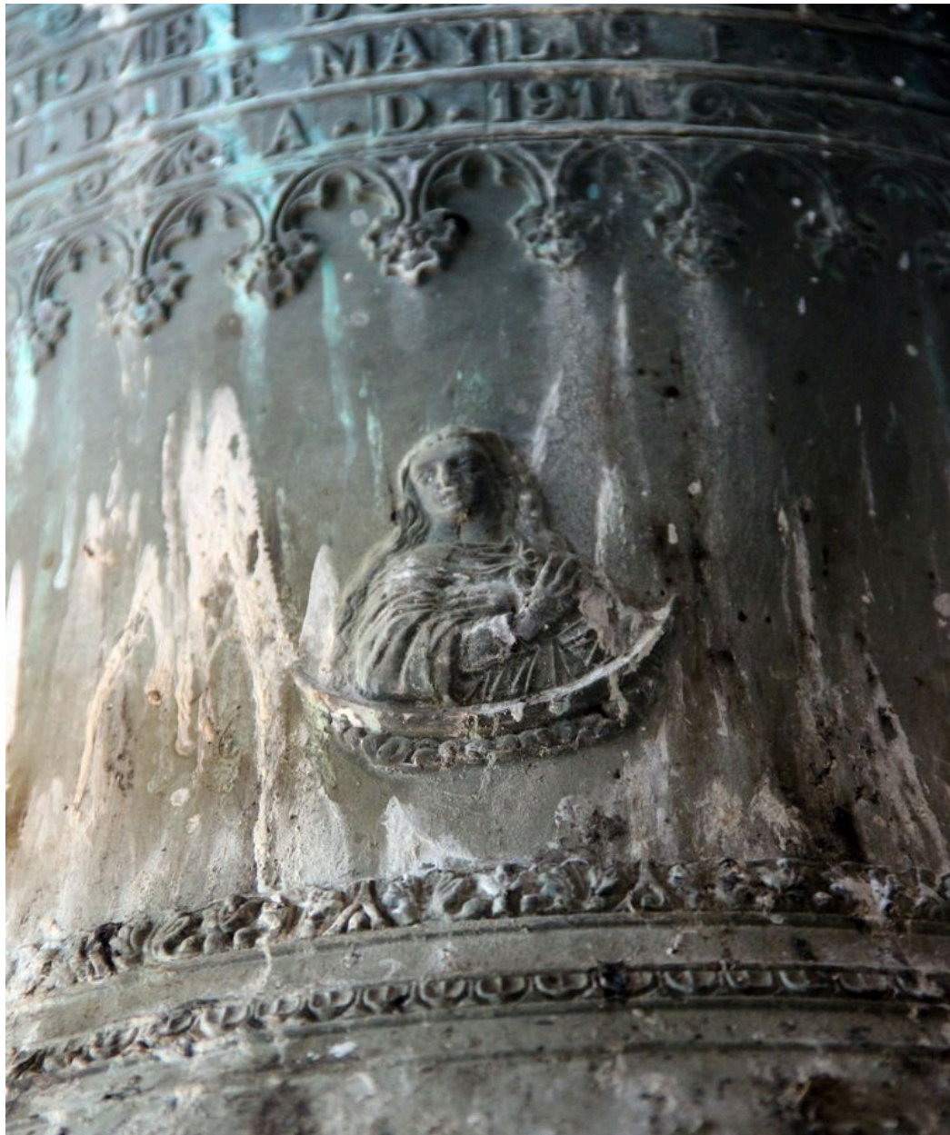
Détail du vase : buste de l'Immaculée Conception.