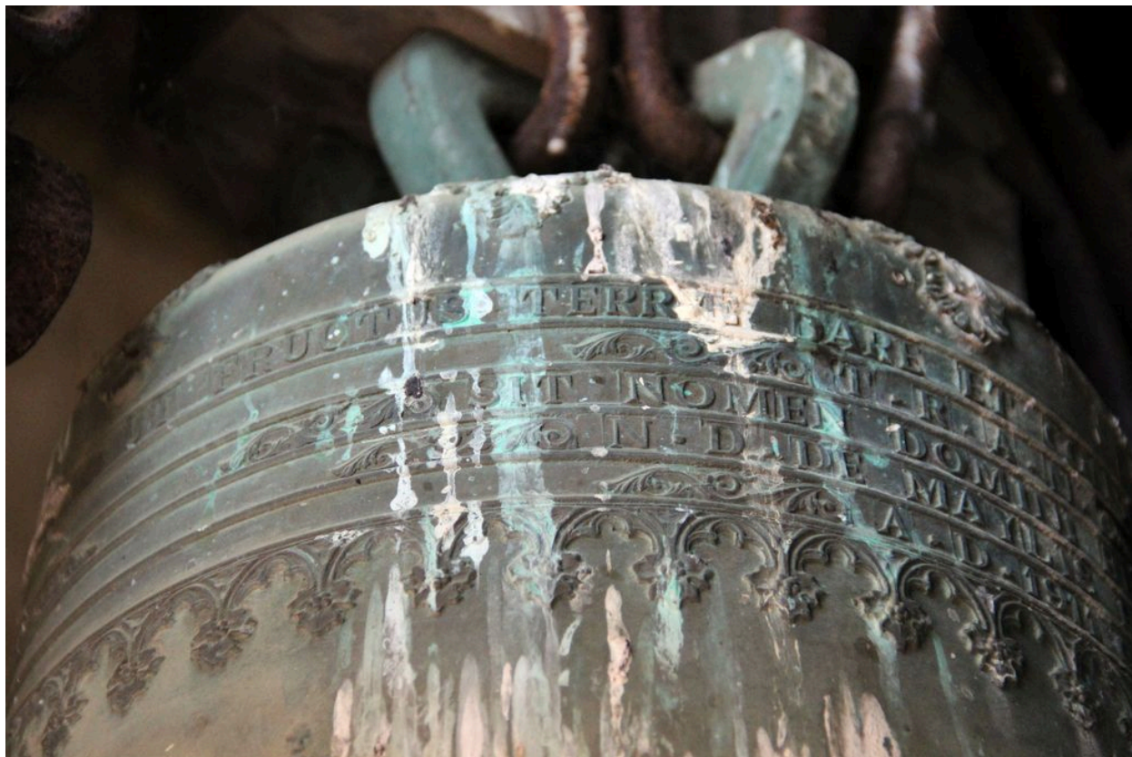
Détail de la dédicace sur le vase supérieur.