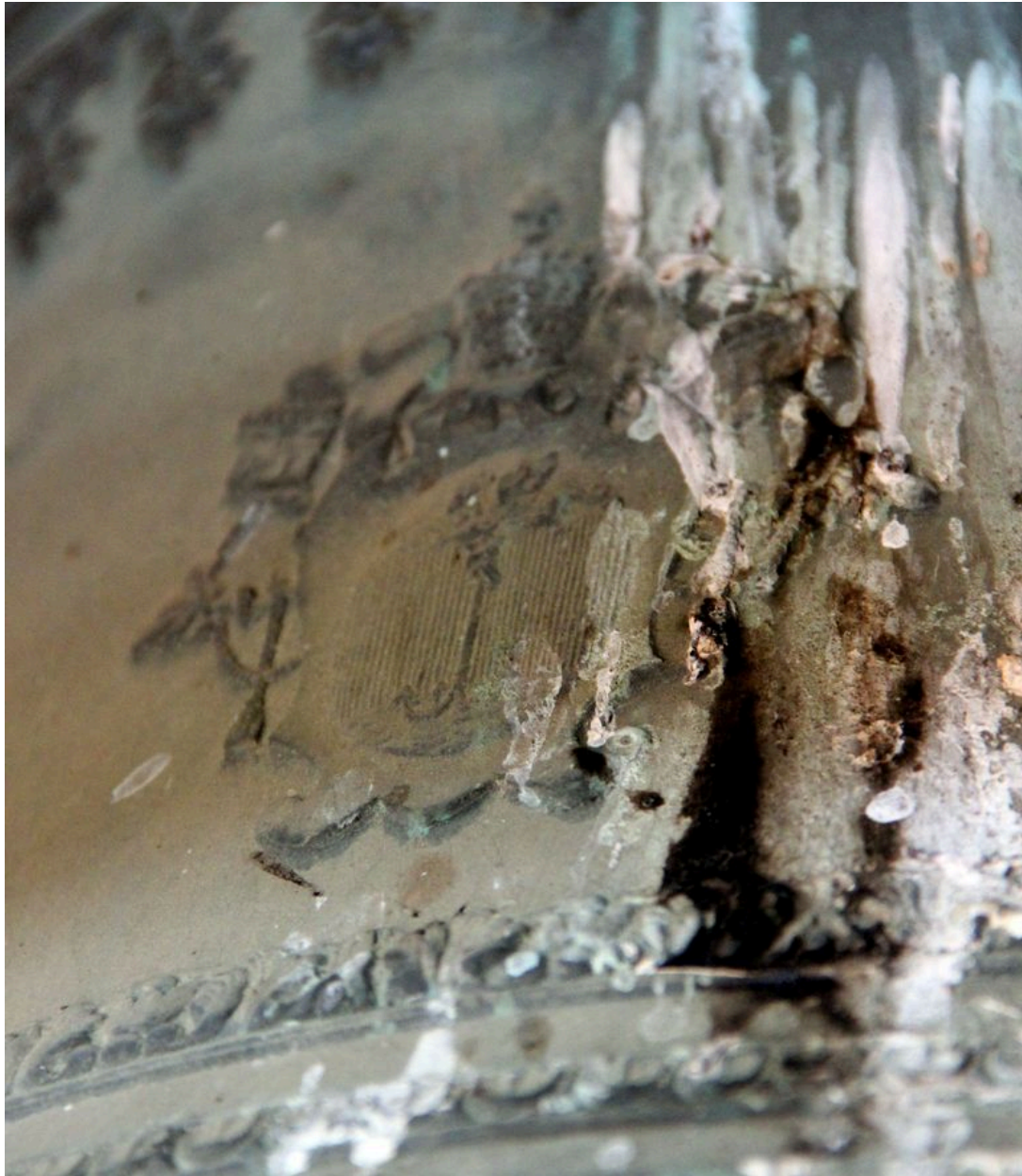
Détail du vase : armoiries du pape Pie X.