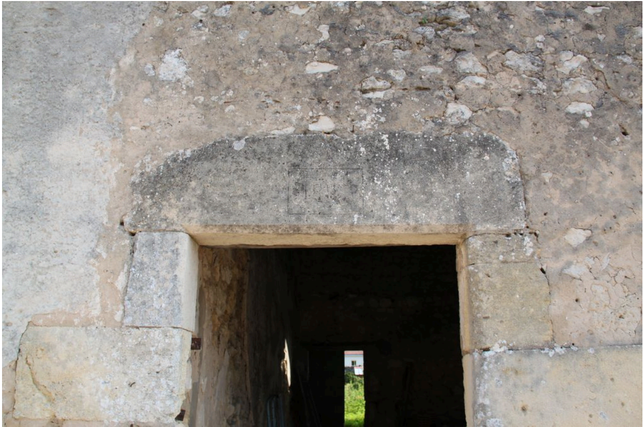
Détail du linteau chanfreiné avec date portée 1818.