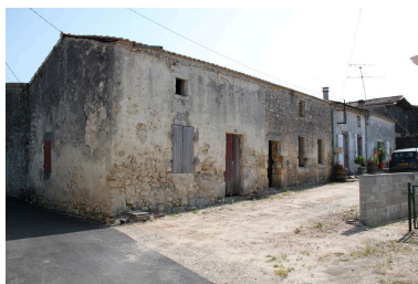
Vue d'ensemble. IVR72_20163301585NUC2A

IVR72_20163301037NUC1A