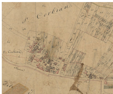
Extrait du plan cadastral de 1825 : parcelles 857, 860, 861.

Phot. Archives départementales de la Gironde IVR72_20163301037NUC1A