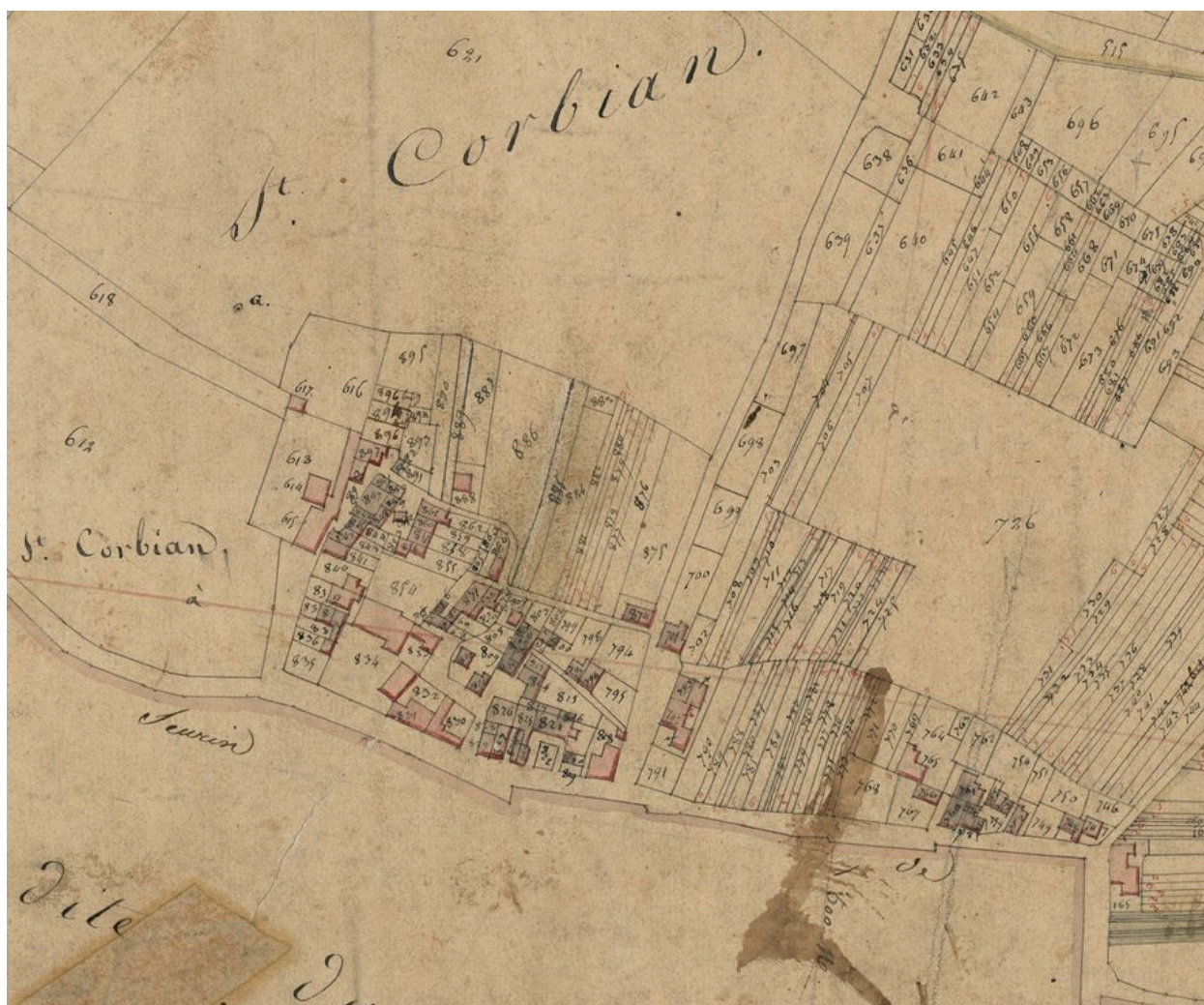
Extrait du plan cadastral de 1825 : parcelles 857, 860, 861.