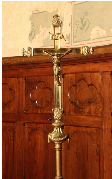
Ensemble (face). IVR72_20194001362NUC2A