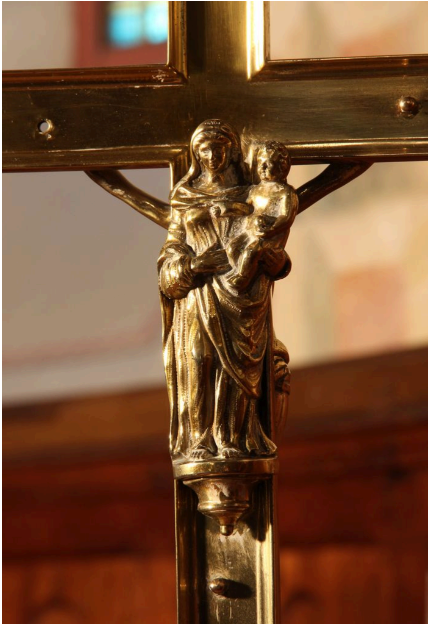
Détail : Vierge à l'Enfant au revers du montant.